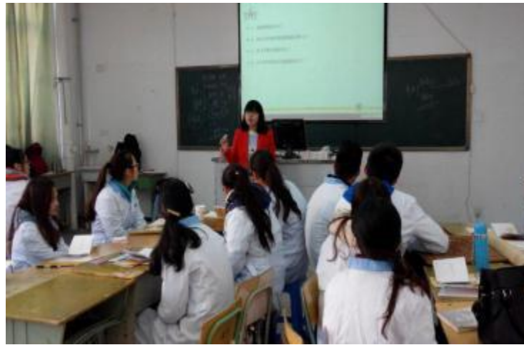
杏林医药班在校授课

大二在校期间，学校与公司根据实际共同制定培训课程，企业每月定期派出营销、管理、营运等方面经验丰富的老师到校对杏林班学员进行专业培训，培训和分享的内容包括企业文化、销售理念、销售技巧、团队精神、自我管理 with 自我提升等。课堂形式多元化，户内和户外、理论和实操相结合。