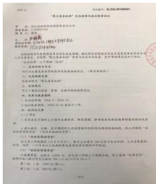
“杏林医药 5 班” 定向培养与就业服务协议

3. 公司与杏林医药 1-5 班学生签订定向培养及就业服务协议，一式三份，明确在培养期间企业企业应尽义务与责任，学员应遵守的规定，可享有的奖助福利。