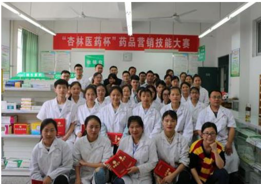
第四届“杏林医药杯”药品营销技能大赛