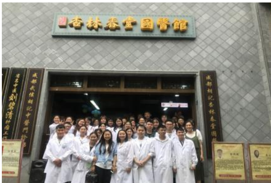
17 级中药学全班到公司见习