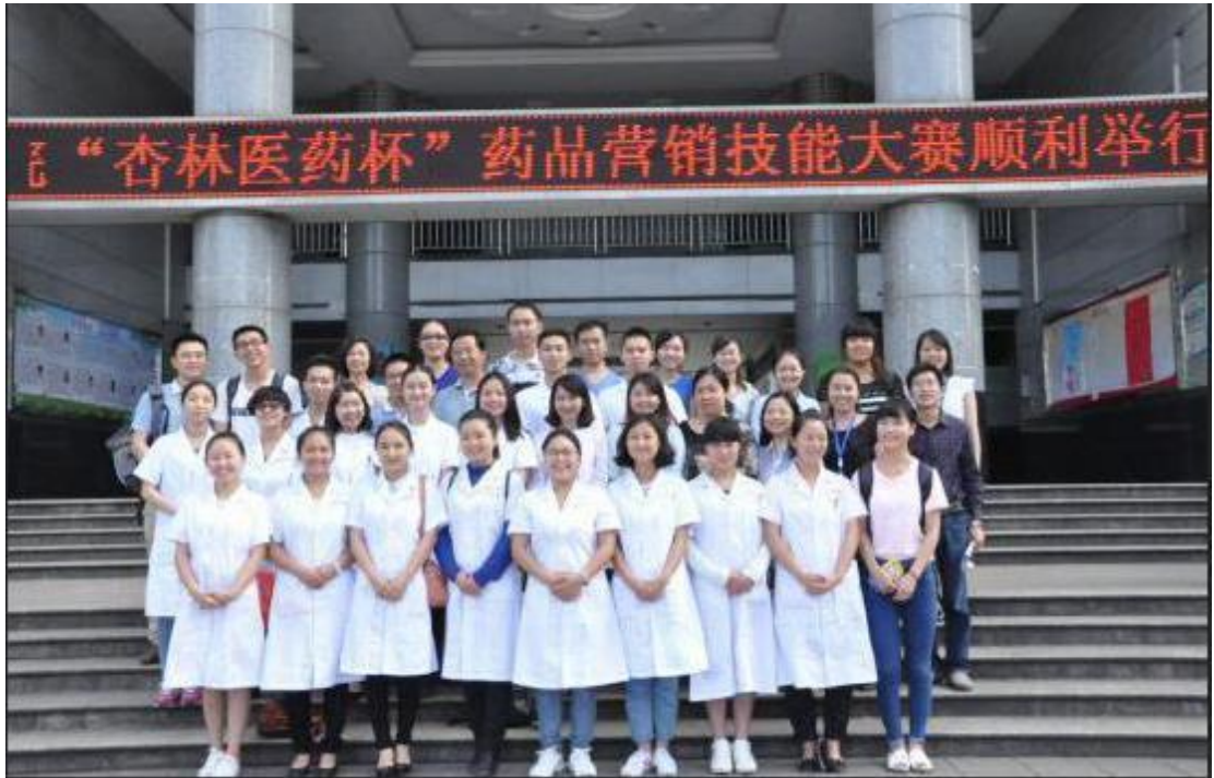
首届“杏林医药杯”药品营销技能大赛