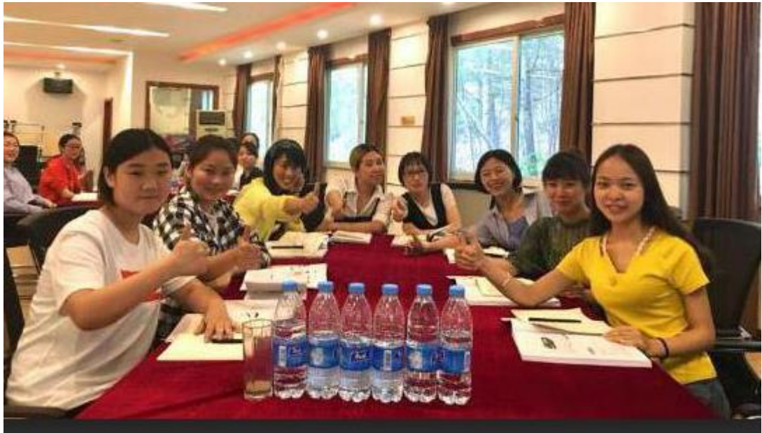
学生在公司管理学院培训