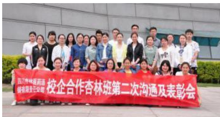
杏林医药班沟通会