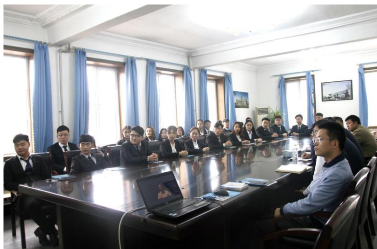
图 3 学生职业素养培训

培养学生能重点掌握餐饮业管理、餐饮业服务等基本知识，同时熟悉餐饮业行业现状并且具备国际化餐饮业服务技能，具备餐饮业各岗位服务技能、企业基层管理人员管理能力、社会交际能力，面向高星级酒店（宾馆、酒店）及餐饮企业管理、服务第一线，熟练掌握酒店、餐饮企业管理方法及运作方式，具备较高服务技能与管理水平、具有良好职业道德的高技能人才。