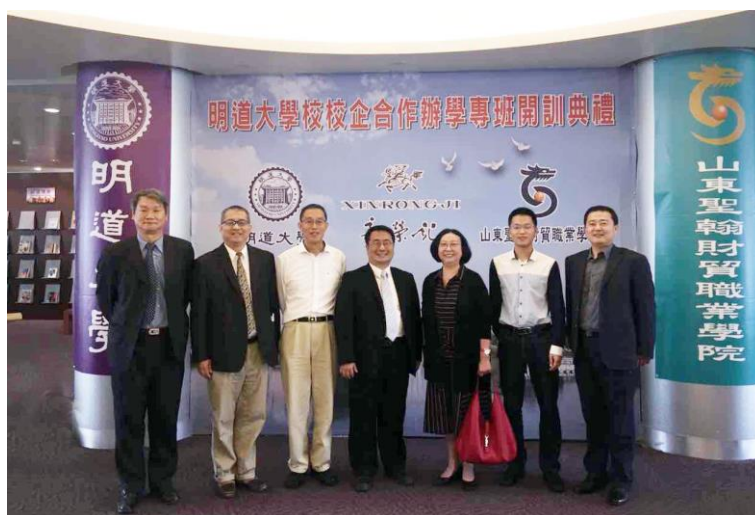
图 4 明道大学

除此之外，学校为规范校校企合作订单班，加强对订单班的管理，保障订单式人才培养模式有效运作，提高人才培养质量，制订了订单班管理制度。以期通过定期考核，动态管理的方式，为校校企合作效率和质量提供保障。