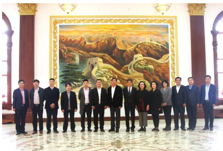
图1 三方合作单位领导洽谈合影留念

2018年6月份，2016级定向培养班23名学生已经赴新荣记相应岗位进行毕业实习，2018年9月份经过层层选拔，已经选定14名学生组成新一期定向培养班，将于2019年2月份进入台湾明道大学进行为期6个月的专业技能强化培训。