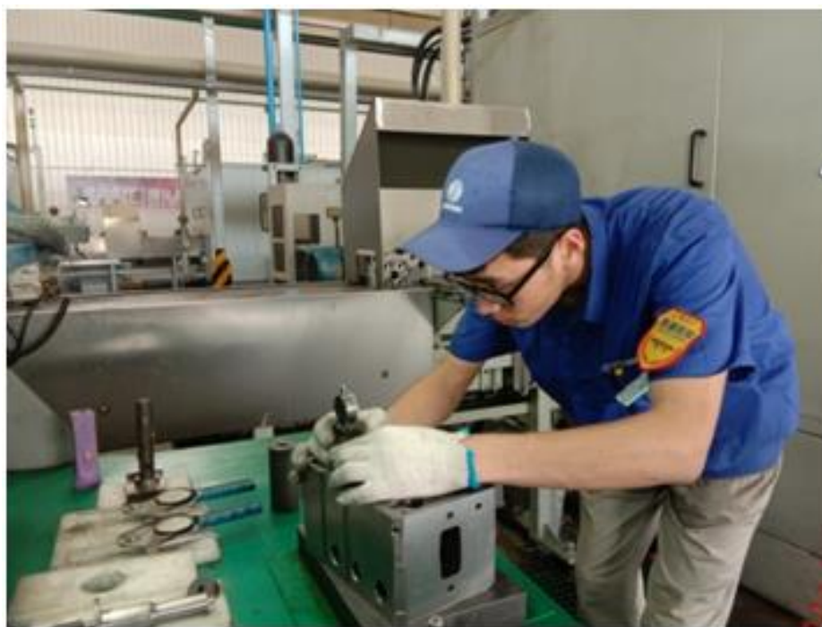
学生实际上课操作场景

目前在校学习的 16 级 86 位学生分成两个白班和夜班两个班次授课，每个班次安排 5 名经验丰富的技师授课，1 名师傅带领 2-3 名学生采用手把手进行教学，进行顶岗阶段的训练。17 级和 18 级在校生将按照“校企共育、工学交替”的现代学徒制人才培养模式有序开展教学工作。经过企业师傅们的仔细讲解与耐心指导，学生们既能将所学的理论知识与实际技能有效结合，又能学到企业师傅们丰富的实践经验和独到的技巧方法，有效促进了学生实践能力与实际岗位技能的无缝对接。