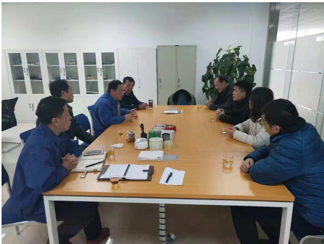
山东信息职业技术学院与潍柴双方研讨人才培养方案

潍柴控股集团有限公司与山东信息职业技术学院携手，联合招收学员，按照工学结合模式，推行“校企共育、工学交替”的现代学徒制人才培养模式，实行校企双主体育人。由学校教师和企业师傅共同承担教学任务，形成双导师制，第一阶段学校为主，潍柴为辅，学校承担专业知识学习和技术基础能力训练，企业到校进行文化宣讲，带领学生到企业参观，完成“识岗”，了解专业所需各项基本技能，体验感悟企业文化；第二阶段潍柴为主，学校为辅，在校内完成部分职业核心课程学习和专业技能实训，企业方面完成与岗位直接对接的职业核心课程学习，并通过手把手师傅带徒弟教学方式完成“跟岗”；第三阶段全部在潍柴完成，采“顶岗”形式让学生完全融入企业，锤炼岗位专项技能。通过真实实践锻炼，提升学生的就业竞争力。人才培养过程中采用“一师多徒”“一师一徒”“多师一徒”等形式，完成学生的“识岗-跟岗-顶岗”的技能训练，实现学生→学徒→准员工→员工的蜕变。