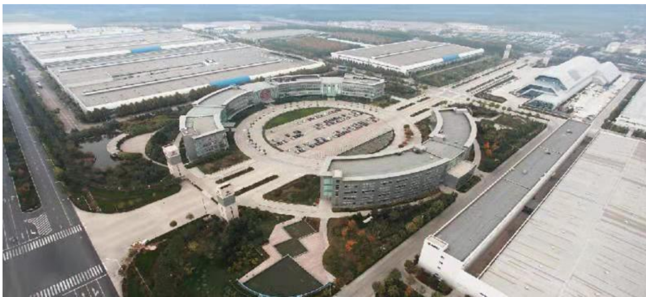
潍柴控股集团有限公司俯视图

潍柴控股集团有限公司是目前中国综合实力最强的汽车及装备制造集团之一。集团在全球拥有员工 8 万余人，名列 2017 年中国企业 500 强第 155 位，中国制造业 500 强第 60 位，中国机械工业百强企业第 2 位。潍柴控股集团有限公司是国内唯一同时拥有汽车业务、工程机械、动力系统、豪华游艇、金融服务和智慧物流六大业务平台的企业，是一家跨领域、跨行业经营的国际化公司。