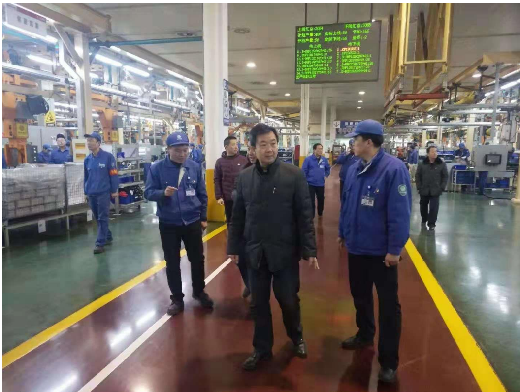
山东信息职业技术学院领导赴潍柴考察

借助潍柴优势教育资源，校企双方建立由潍柴控股集团有限公司、车间主任、一线专家、首席技师和山东信息职业技术学院专家、专业负责人、骨干教师等组成的专业建设指导委员会，双方共同分析主要就业岗位和所需的职业岗位能力，共同协商确定人才培养方案，实施以柴油机组装、数控机床操作、数控机床维修三个主要职业方向的人才培养。