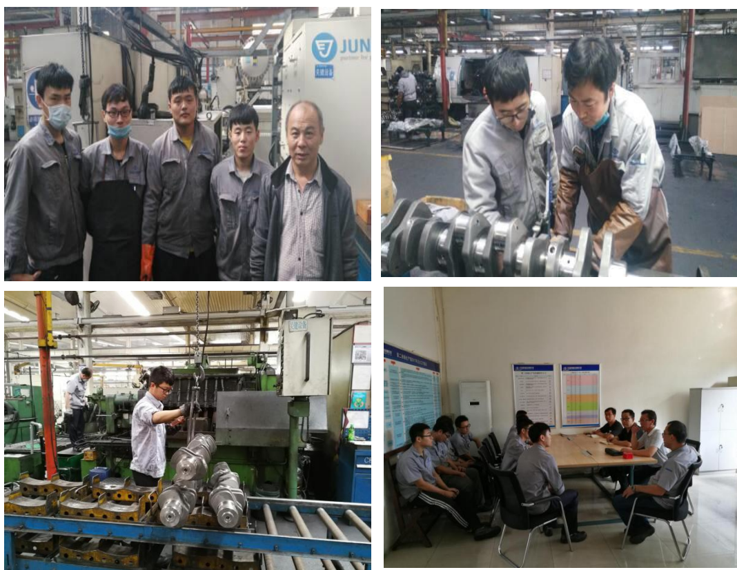
图 2 双元育人 三方共赢

对于公司来说，现代学徒制人才培养模式不仅为企业的战略发展储备了一定的人才资源，而且为企业目前的发展充实了新的能量。学校根据公司的人才需求，专门制定人才培养方案，人才培养具有针对性，缩短了人才培养时间，公司优越的实践条件又为人才培养奠定了基础，节省了学校人才培养的资源。双方合作的现代学徒制，树立了以工作过程为导向的高职课程观，课程体系建设以企业实际工作过程为导向，培养了学生全面的工作能力。双方合作完成了 12 门以上课程标准、合作编写了 4 门校本教材，都是以企业培训为核心，承担培养技能型劳动者的主要责任。学生既通过学校的教育，学到了丰富的专业理论知识，又通过公司师傅的指导学到了相应的岗位技能，能够培养学生的职业精神和职业技能，提升他们的综合素质。从企业、学校、学生的长远发展来看，这种人才培养模式能够达到三方共赢。