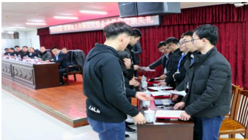
图3 现代学徒制拜师仪式