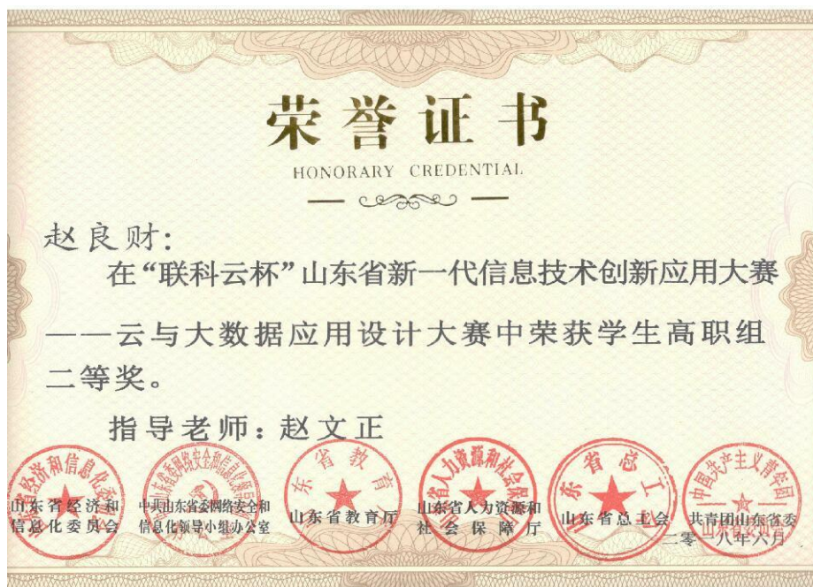
图 10 校企合作学员获得山东省创新大赛证书