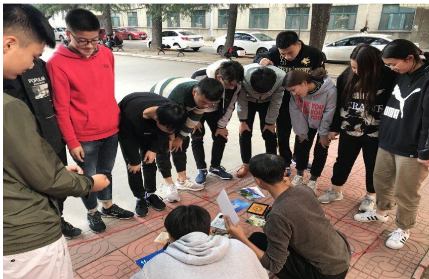
图 13 18 级新生课外素质拓展活动

华为 ICT 巡展活动 10 余次，让学生改变拘束内向性格，使学生在求职过程乃至今后的职业生涯中知己知彼，百战不殆，脱颖而出。