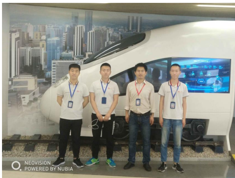
图 7 校企合作学员参加华为 ICT 大赛