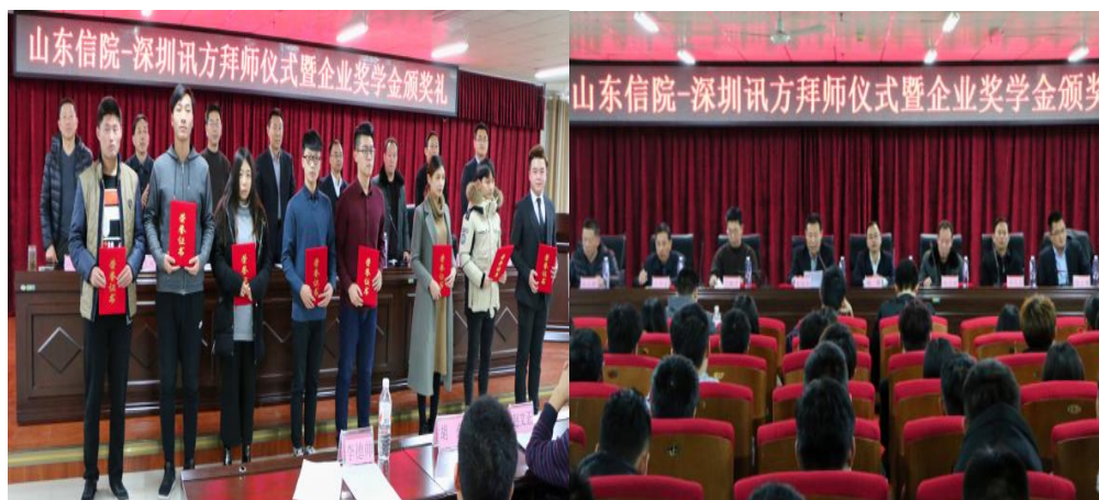
图2 优秀企业学员颁发奖学金