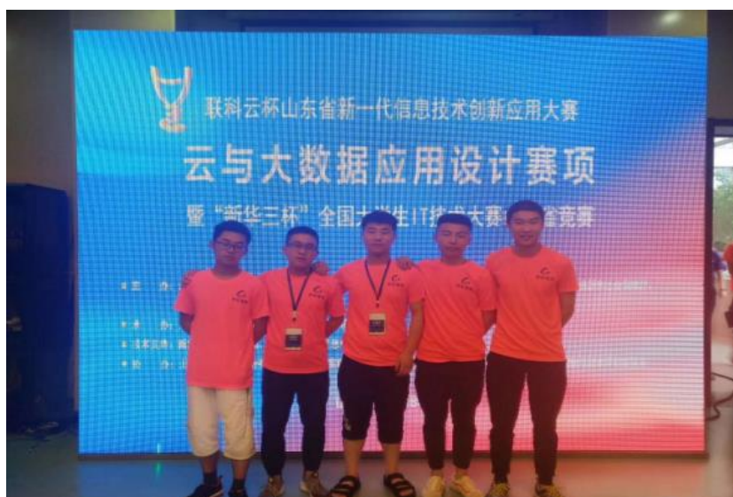
图 5 校企合作学员参加山东省新一代信息技术大赛