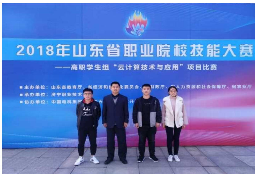
图 4 校企合作学生参加山东省职业技能大赛