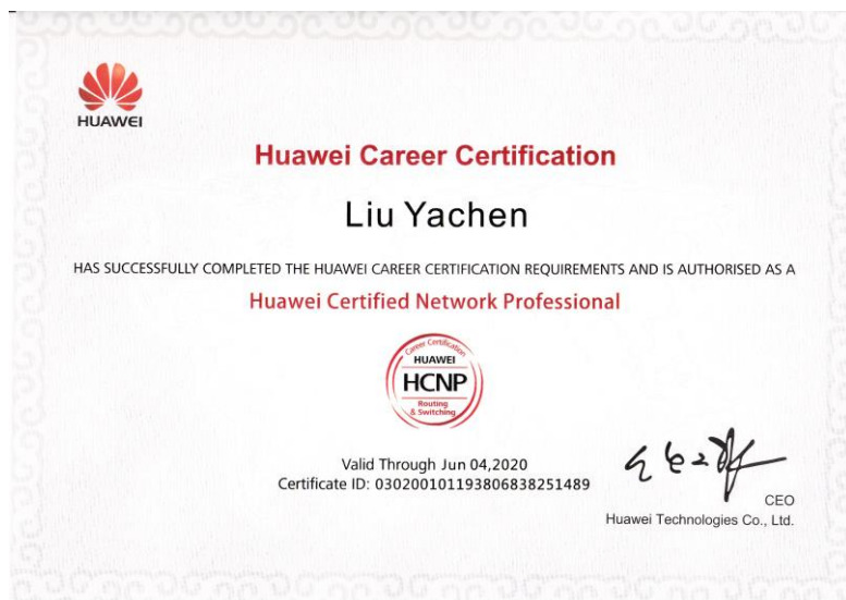
图 11 学员考取华为路由交换高级工程师证书