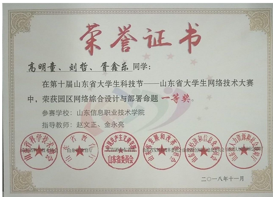
图8 校企合作学员获奖网络技术大赛证书