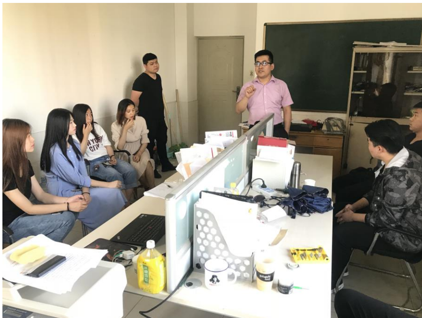
图 14 优秀企业进校招聘

考核、筛选，经过几轮双选，离校之际，通信技术校企合作班所有同学去了讯方公司提供的就业单位实习，学员就业率100%。