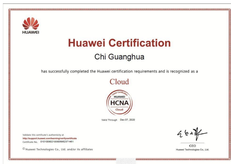
图 12 学员考取云计算工程师证书