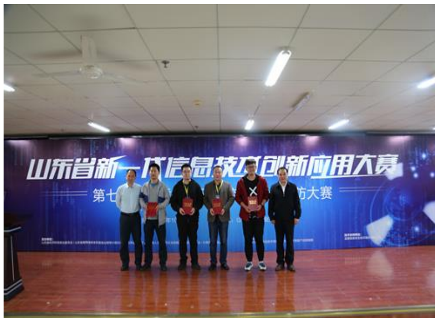
图 6 校企合作学员参加网络安全攻防大赛