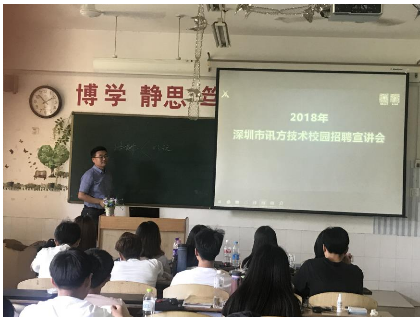
图 15 讯方校园招聘会