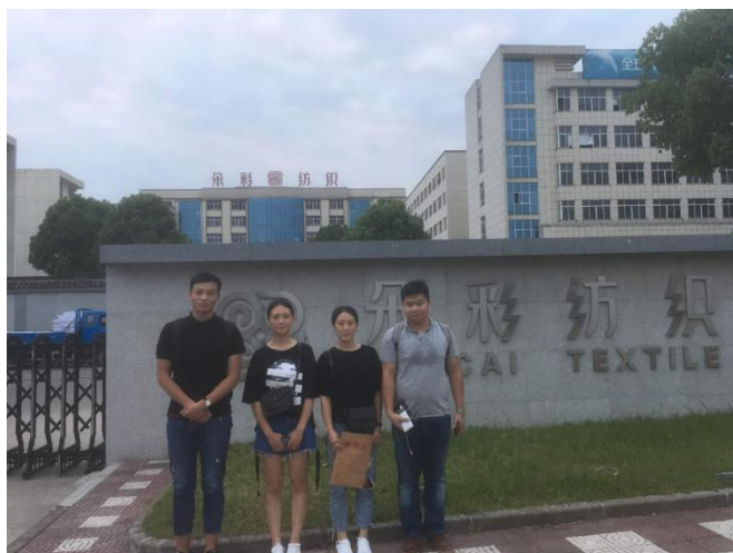
图 13 学生在实习单位合影