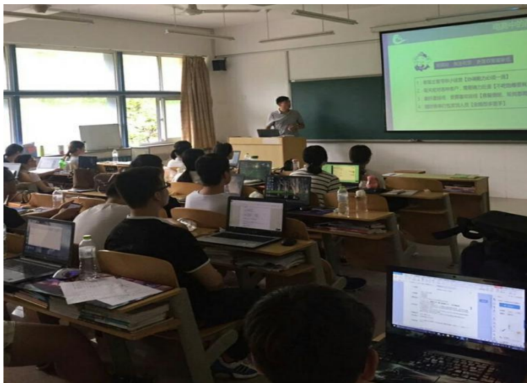
图 11 企业专家开展职业导向训练

为使学生更好的认识企业、掌握企业基本岗位技能、增强专业能力，中清研安排学生到浙江互联网企业进行实训实习，挑选行业美誉度高、规模大、已开展电商项目且盈利状况良好、组织结构完整、工作流程完善、员工福利高、晋升通道完善的合作企业安排学生实训实习。