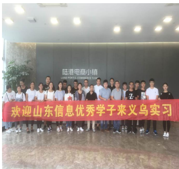
图 12 学生到义乌进行实习

然后由实习老师带队乘坐火车到达实习地点，实习老师组织并安排企业对学生选拔，所有学生全部安排到岗后中清研实习就业老师对学生进行了回访，了解学生到岗后的状态，对心态不稳定的学生进行单独沟通，积极引导。