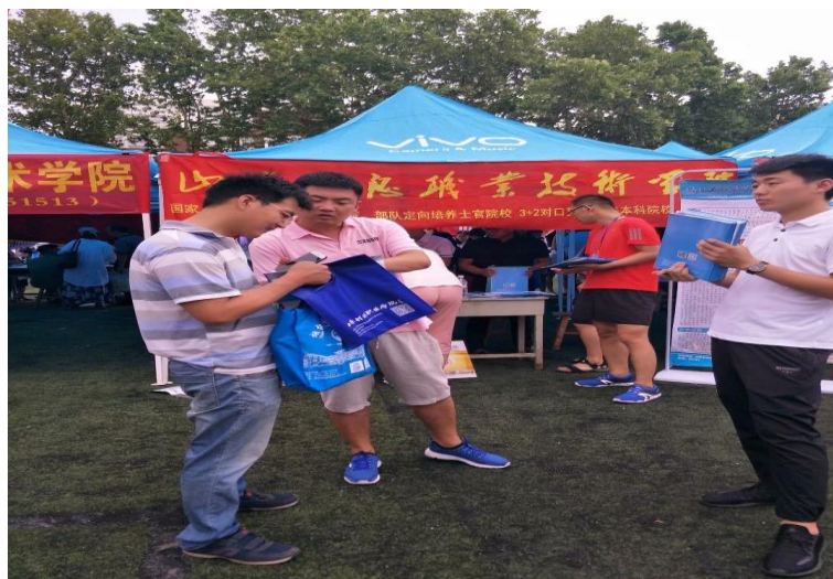
图2 高招会现场咨询讲解

九月份新生开学报到，为了让新报到的学生对选择的电子商务专业有更清楚的认识，中清研精心组织了别出心裁的迎新活动和入学教育。