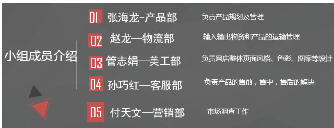
图9 K0 团队小组成员