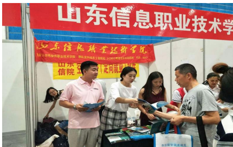
图1 高招会现场发放资料

六、七月份开始参加各地举办的高招会，中清研按照学校要求，积极配合参与。参加了潍坊、泰安、菏泽、济宁、济南、临沂等地举办的高招会，在高招会现场进行咨询、院校介绍、高考志愿填报指导、专业知识讲解、学生信息收集，加强学生对校企合作专业认识。