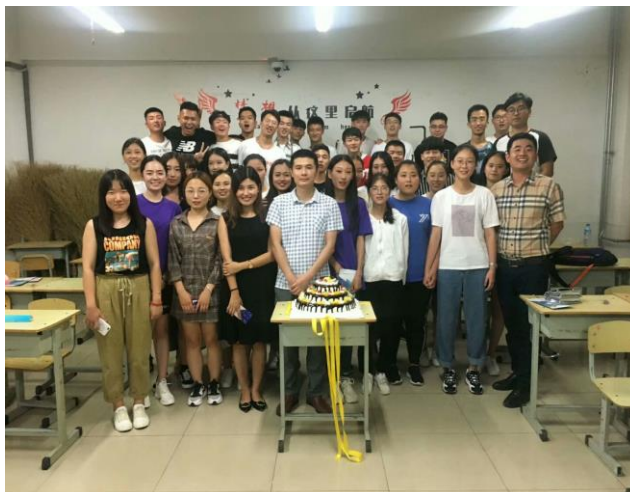
图3 2018级电子商务校企合作班