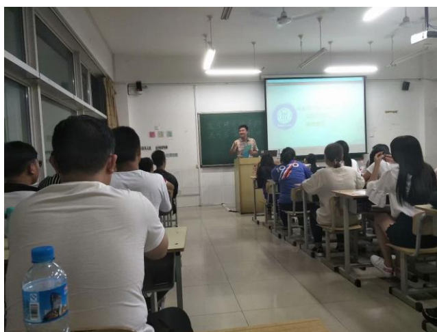
图4 中清研专家入校开展入学教育