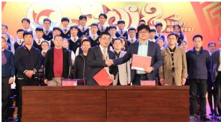
图 1 2018 年重点企业参与学校人才培养工作签约