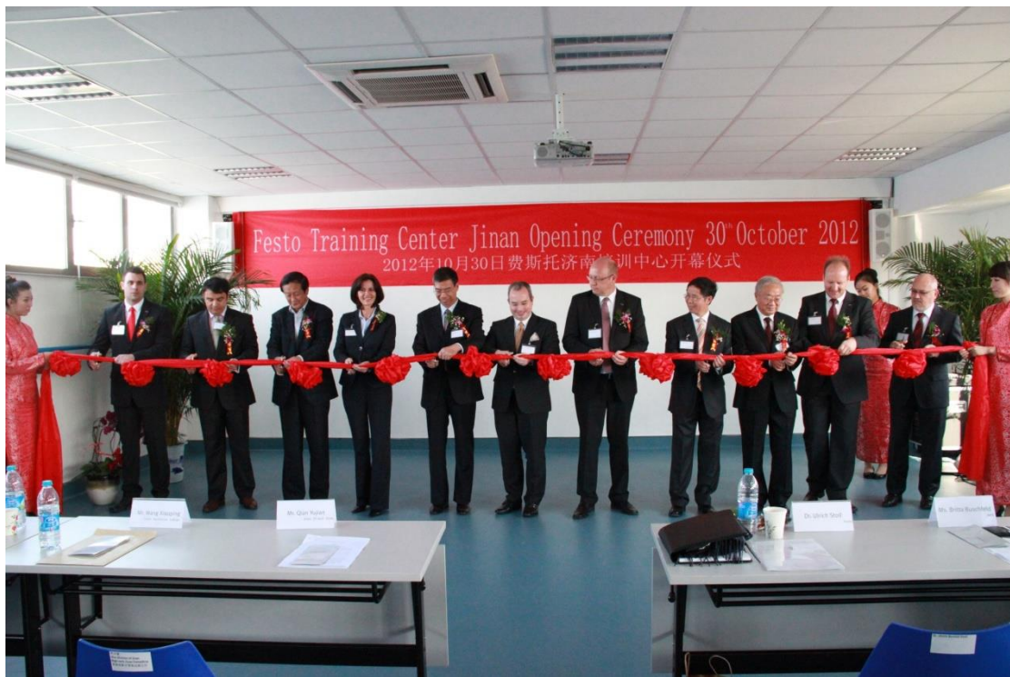
图一 三方合同签字仪式及济南费斯托培训中心启用庆典

2011 年 9 月份在德国工商大会上海代表处(简称“AHK 上海”)协作下费斯托启动有限公司与济南职业学院合作举办职业教育项目。