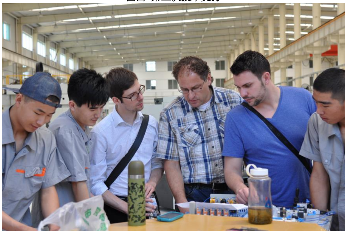
图五 德国双元制专家车间现场指导