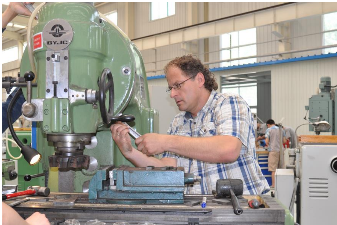
图四 第三次技术支持