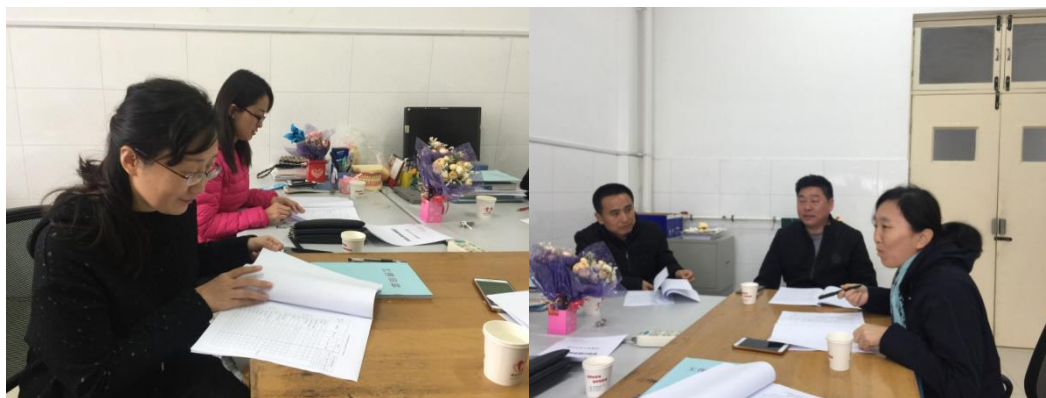
图3 校企双方修订人才培养方案

校企双方强化“双导师”队伍建设，建立由学校专业指导教师和企业技术骨干组成的教学团队，通过“双向挂职锻炼”“能工巧匠进校园”等举措，加强培养培训，提升教学水平，初步建立了一支技能过硬、品质优良的“双导师”队伍。