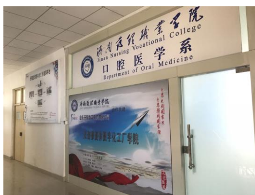
图 2：校企双方建设数字化口腔实验室