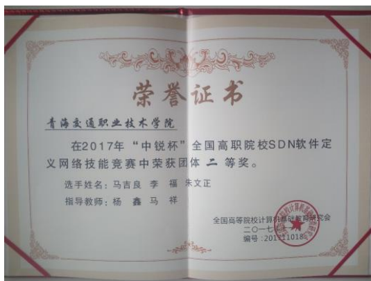
图2 “中锐杯”全国高职院校 SDN 软件定义网络技能竞赛荣获团体二等奖

2018 年 11 月，在第二届全国高校 SDN “软件定义网络”技能竞赛中学校一队和二队分别获得团体二等奖和三等奖的好成绩，排名较 2017 年更加靠前。