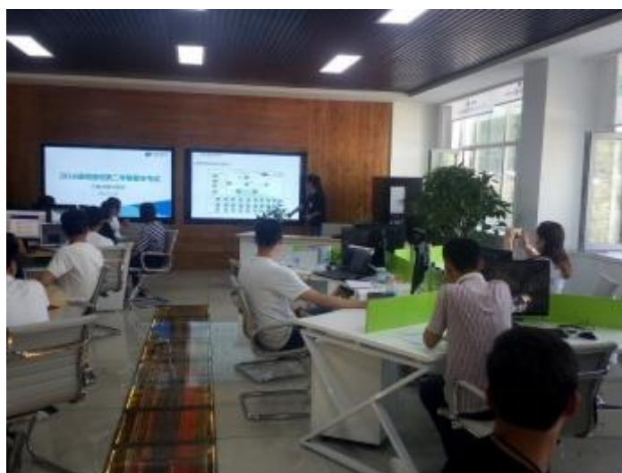
图 11 学生进行期末考核项目方案答辩的方案讲解

录 CII 云教学领航系统实验平台按照国赛的相关标准在规定的时间内完成上机调试项目实施并提交《答题卡》、《设备配置记录》以及设备《RIIP 健康检查报告》。为使得锐捷班学生在毕业时取得更加优异的毕业答辩成绩，从进入锐捷班开始，学生就要树立一个理念“平时即考核，考核即平时”。方案讲解与答辩要求学生在平时就要锻炼专业技术表达能力、沟通交流能力、方案讲解等在真实项目中非常接地气的技能技巧。学生在规定时间内输出答辩 PPT 并进行项目方案讲解（等价于项目完工后客户培训），邀请系主任及相关教研室老师担任评委，讲解完毕后考生参加项目答辩环节。