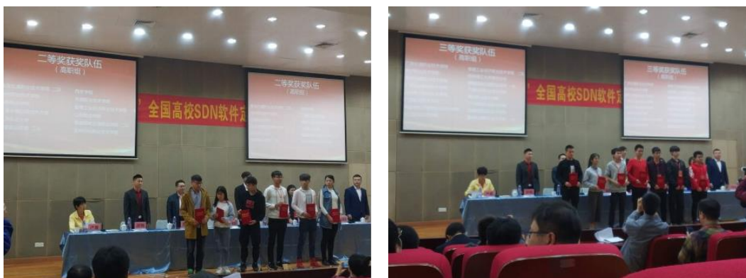
图3 第二届全国高职院校 SDN 软件定义网络技能竞赛颁奖现场

2018 年 11 月，在第二届全国高校 SDN “软件定义网络”技能竞赛中学校一队和二队分别获得团体二等奖和三等奖的好成绩，排名较 2017 年更加靠前。