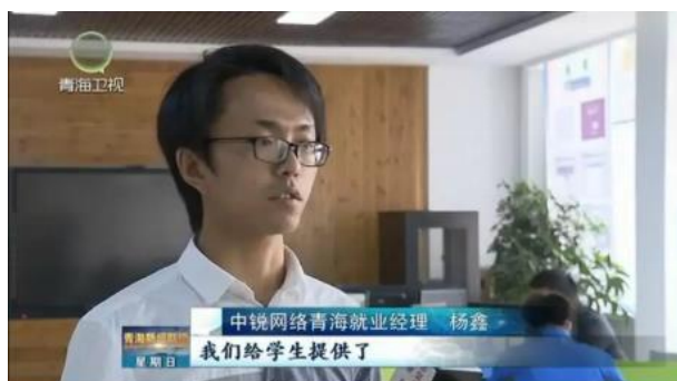
图8 锐捷班企业导师接受青海卫视专访

对锐捷·中锐班人才培养模式、产教融合人才培养取得的相关进展以及学员顶岗实习情况进行了介绍。通过此次采访，使社会各界看到了学校与企业进行深度合作所取得的成果，用事实验证了校企合作模式对于新一代应用型人才的培养是切实有效的。