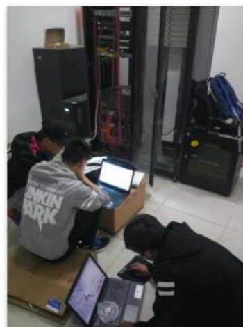
图4 学生在英德尔酒店实施网络新建项目

服务社会获赞誉。 依托信息工程学院，学校成立了创客工作室。创客工作室是一个由学校老师主持，中锐企业导师辅导，学生参与企业化构建，主要面向学校、社会提供技术服务，为学生提供创业及就业实践、勤工俭学的服务平台。据此组建了“中锐网络青海交职创客团队”，该团队由锐捷班 16 名学生组成，团队成员常驻于网络人才培养孵化工作室，目前工作室 NA 水平学生 11 人，达到准 NP 水平学生 5 人。该团队致力于为青海本地提供 IT 综合服务，包括设备硬件安装，锐捷设备调试，巡检等。团队自 2017 年组建以来先后参与了青海省英德尔酒店网络新建项目和西宁市纪检委网络新建项目，高效优质的工程顺利通过了项目验收。