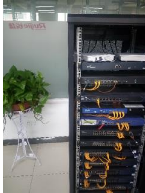
图6 设备齐全的实验机柜