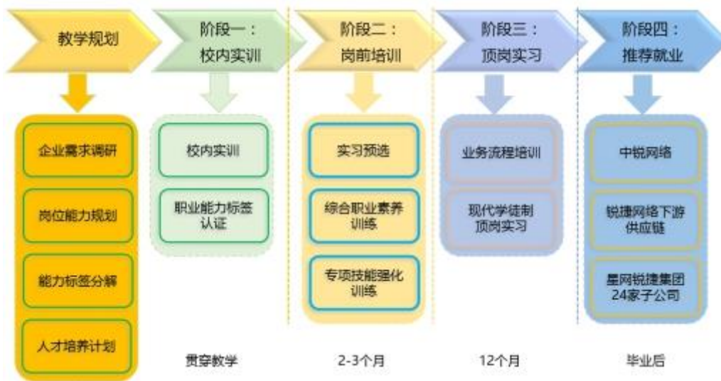
图 10 计算机网络专业人才培养总体结构示意图