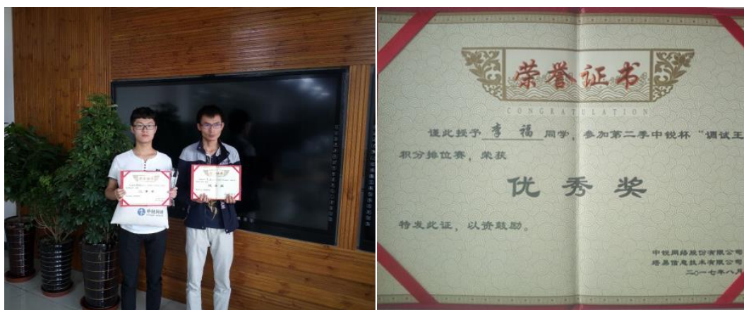
图1 第二季中锐杯“调试王”暑期积分排位赛获奖学生及证书

全国技能竞赛取佳绩。 2017年7月，学校选派5名锐捷班学生参加中锐网络公司举办的第二季中锐杯“调试王”暑期积分排位赛，其中2名选手分别获得二等奖和优秀奖。