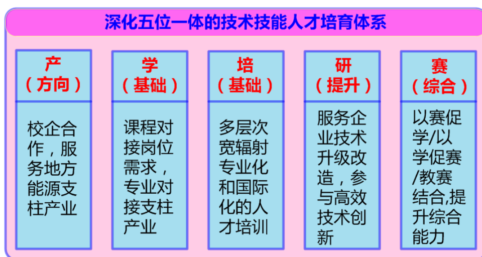
图1 “五位一体”人才培养体系

应用化工技术、煤化工技术专业依托现代煤化工职业技能公共实训中心，创建了“产、学、培、研、赛”五位一体的技术技能型人才培养体系。公司结合煤化工实际情况，与宁夏工商职业技术学院教师一起对化工生产职业岗位工作职责、任务、要求、对象、方法、形式、所需知识、能力及职业素养等进行分析，依据职业岗位工作职责、任务要求，完成工作任务所需知识、能力及职业素养，化工、煤化工企业生产运行控制对人才的需求要求，确定应用化工技术、煤化工技术专业人才培养目标。共同调查与分析宁夏地区及周边区域化工行业人才需求，得出从事化工生产运行、岗位操作、设备维护检修、生产技术管理等工作的高素质劳动者和技能型人才应具有的职业能力。以“五位一体”培育体系为抓手，参与产教对接平台、实训教学平台、技能培训与鉴定平台、技术研发平台、技能竞赛平台的创建工作。与宁夏工商职业技术学院共同创新实践教学体系，实现学生“主流、主导”职业技能的培养与提升