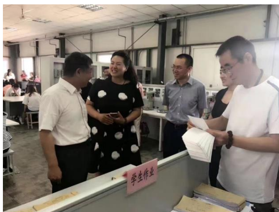
“神州顺利办·大连记账工厂”启动仪式现场

记账工厂将企业真实业务引入校园，学生不出校园即可实现企业真实业务的单证审核、代理记账、纳税申报、财务报表报送等业务，实现课堂和企业工作的无缝对接。在这里，学生可以在会计岗位独立体验会计工作，真正做到学以致用，在校内完成“准会计”到“会计”，再到“老会计”的提升。