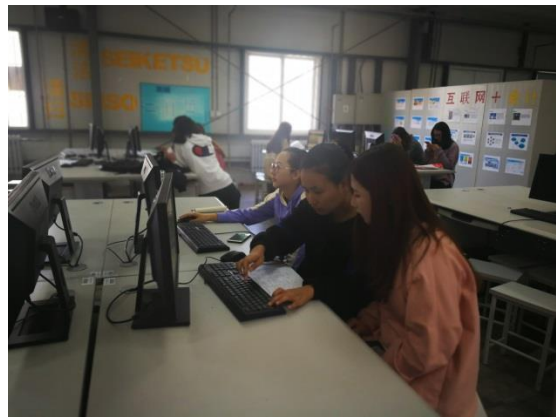
企业教师指导记账工厂成员工作

同时，每个寒暑假企业为学校师生提供企业实践机会。在企业实习期间，企业为每一位学生分配一名企业的指导教师，对学生实行“一对一”的指导，帮助学生提前认知企业，熟悉企业岗位分工、岗位职责和 workflows，提前适应未来的企业工作岗位。