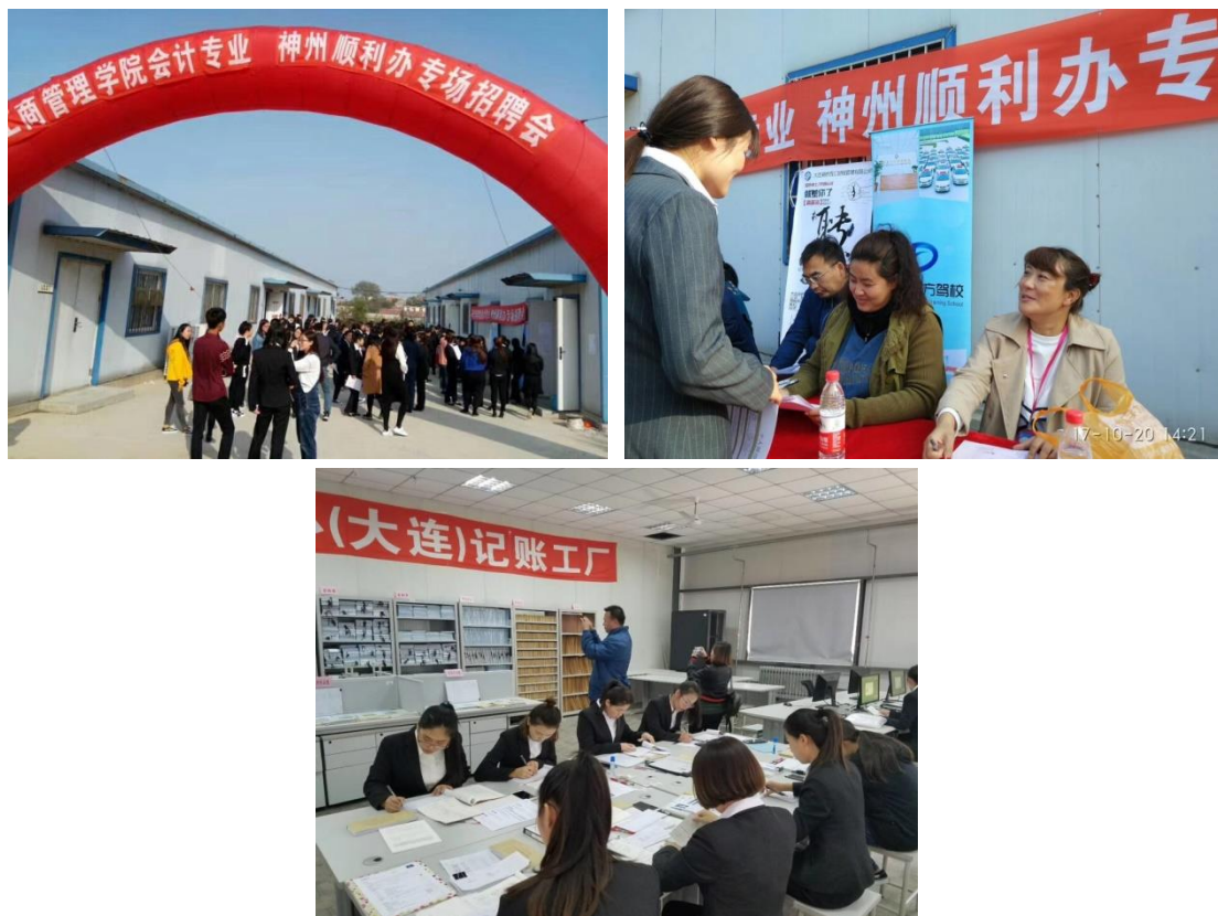
首届记账工厂专场招聘会

校企合作不仅仅是共同进行人才培养，更重要的是为企业输送更多更优秀的人才。2017 年，依托记账工厂神州顺利办旗下的各家财务公司来到学校展开专场招聘。学生们现场展示会计专业技能，各家企业进行现场的面试和招聘。不但解决了会计专业学生从课堂到企业的无缝对接，更为学生提供了更多的就业出路。