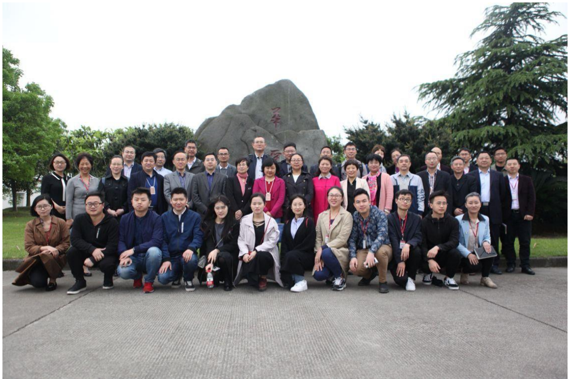
图 4 校企师生见面会