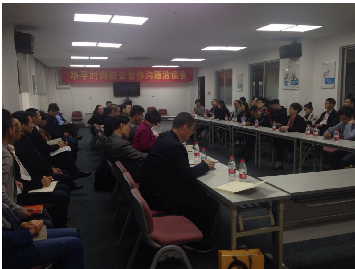
图2 与华孚时尚企业洽谈