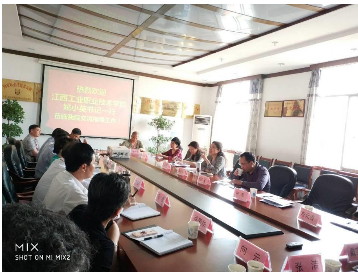
图1 前往江西冶金职业技术学院学习交流

经过政校企共同研讨，确定现代纺织技术专业为现代学徒制试点专业，开展现代学徒制试点工作，完成相关试点任务，探索建立校企联合招生、联合培养、双主体育人的长效机制，形成和推广政府引导、行业参与、社会支持，企业和职业院校双主体育人的中国特色现代学徒制模式。