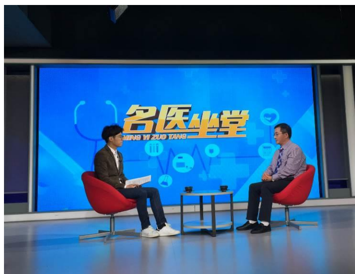
图 18 名医坐堂栏目