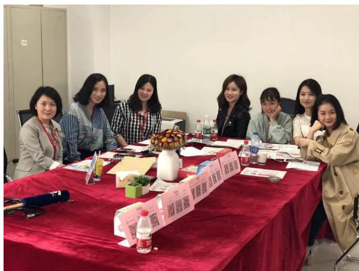
图 15 学院师生参与筹备会