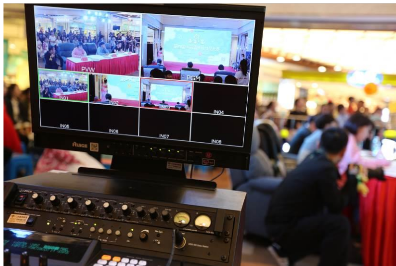
图 12 比赛现场网络直播切换