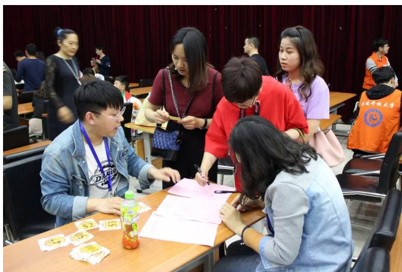
图 13 比赛签到现场

学院挑选 20 多名品学兼优的在校学生以及两名带队老师全程参与公司“江苏省少儿才艺大赛”项目以及《未来之星》栏目生产制作，还配备数码单反相机、高清摄像机、非线性编辑线提供技术保障。“江苏省少儿才艺大赛”时间长、赛区多、岗位杂、规模大，学院师生积极主动、精心设计、不断优化执行流程。从赛区海选、地区决赛到全省总决赛，学院师生参与的近百场线下比赛，分工明确、流程清晰、服务规范，为参赛选手提供了较好的参赛体验。尤其是 2000 多条参赛视频录制、剪辑和上传，基本做到零差错。比赛期间恰逢暑期，学院专门为参与学生提供住宿和编辑房，指定专门教师确保学生食宿安全。参与《未来之星》栏目生产的学生，能吃苦、肯动脑筋，积极发挥自己专业特长，在摄像、剪辑、文稿、新媒体传播方面很快适应栏目需求，基本达到电视媒体在岗人员的相关岗位要求。