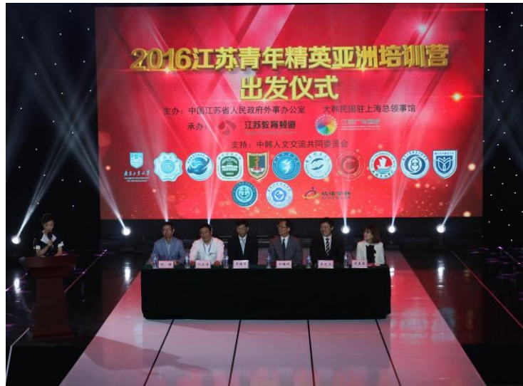
图 1 2016 江苏青年精英亚洲培训营出发仪式