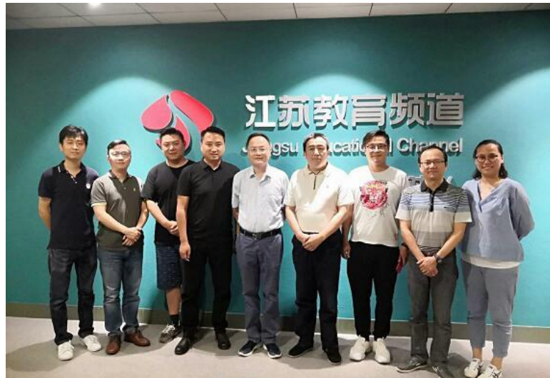
图8 学院领导去企业参加校友联谊活动

岗位上取得事业成就。近些年，在江苏广播未来教育产业发展有限公司的牵引下，江苏教育频道校友频频与学院开展校友联谊活动。通过校友联谊活动，讨论了如何促进资源共享，充分发挥校友资源推动合作，助力学校事业发展。