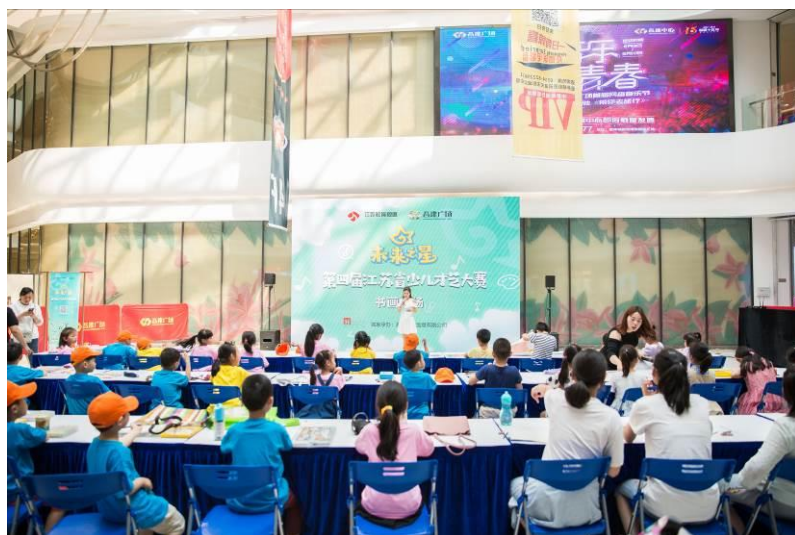
图 14 书画比赛现场执行