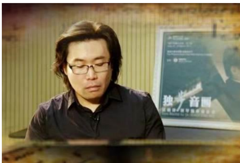
图 19 艺术之门栏目

2017 年全年栏目共制作播出 365 期，在江苏教育频道每天正常播出。为学校贡献了 1000 多集的社会教育学习资源，《名医坐堂》版块通过 4 年来的积累，已成为国内排名靠前的医学类视频知识库。《老王说法》、《艺术之门》等版块也受到观众的广泛欢迎。目前，栏目形成的学习资源除在江苏开放大学资源库网站（点石网）发布外，还在无锡、常州、南通、宜兴、徐州、通州等市、县开放大学（学院）的社区教育网站上发布。《开放大学》栏目在社会教育中起到了重要的作用：它是学校社会教育品牌宣传的重要窗口，是学校社会教育学习资源建设的重要途径，是学校对外合作的重要桥梁、是学校培养学习