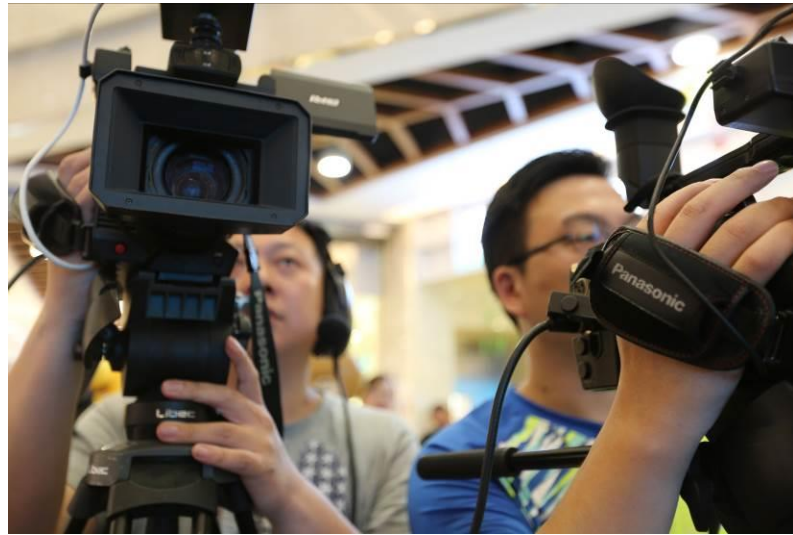
图 10 比赛现场视频录制