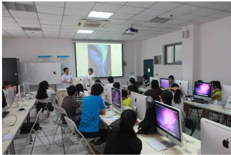
图 7 企业教授官必京来校授课

业教授，直接参与江苏省高水平骨干专业——广播影视节目制作的教学活动中，指导学生毕业设计、开设专题讲座并主讲电视编导课程每学期达 90 学时。江苏广电未来教育产业发展有限公司产业精英进入到人才培养的核心，通过整合和利用现有产业和技术优势资源，为广播影视节目制作专业学生创造出丰富而有益的科研实践机会，并从产业最前沿的视角去指导和培养学生，从而增强学生的创新能力，实实在在地去推动人才培养模式的改革。