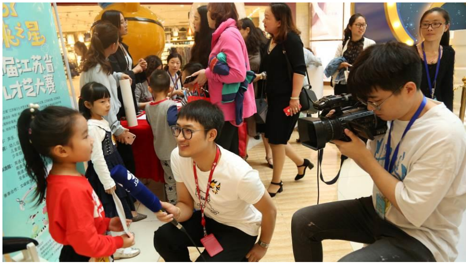
图 11 比赛现场采访选手