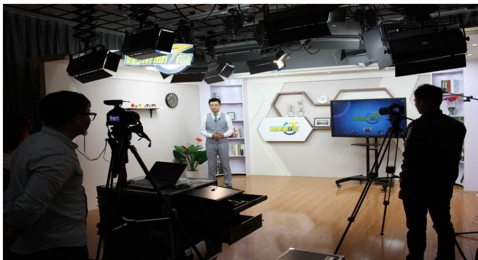
图9 《健康新7点》拍摄现场