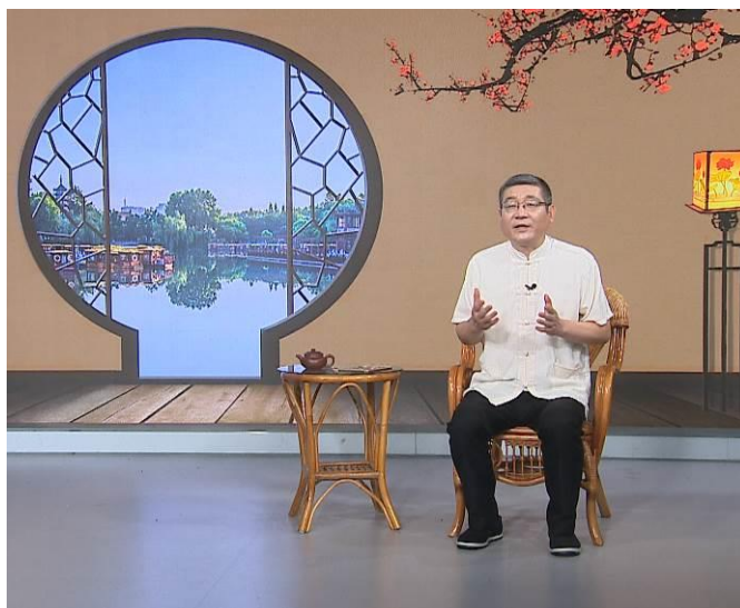
图 17 老王说法栏目

学校是传播高深知识的殿堂，拥有一流的技术，集聚了大量的人才和大师。学校具有人才培养、科学研究和服务社会三种职能。通过校企合作，学校的提上了社会服务能力。2013年，公司与学院合作，制作《开放大学》栏目，该栏目于7月1日正式在江苏教育频道播出，栏目为日播节目。栏目以为社会公众的生活提供贴心服务为目的，突出知识性、服务性、实用性、趣味性。目前设置的版块有“老王说法”、“名医坐堂”、“艺术之门”、“江苏社教巡礼”四个版块。