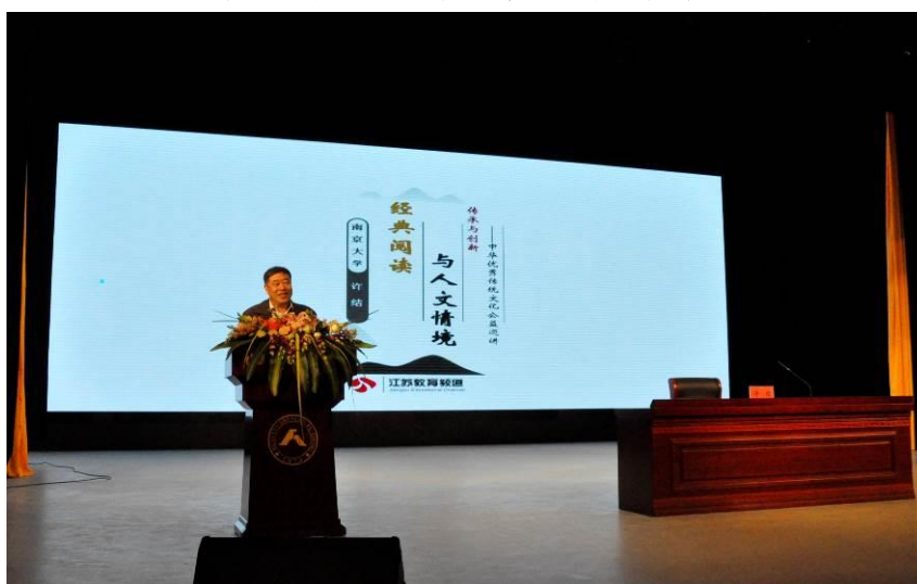
图5 “传承与创新——中华优秀传统文化”公益巡讲