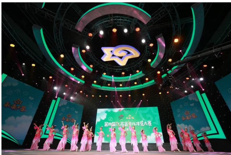
图4 第四届江苏省少儿才艺大赛