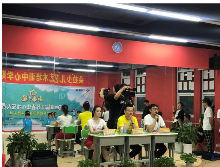
图 16 《未来之星》栏目现场拍摄