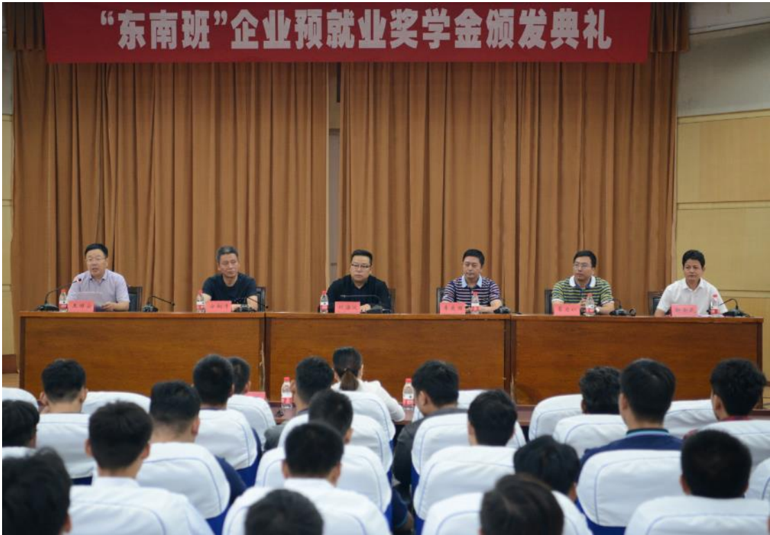
图 1-1 在学校为学生颁发奖学金典礼