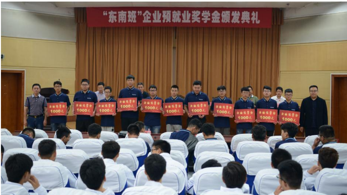
图 1-2 企业为学生颁发奖学金

师资队伍建设方面： 江苏东南工程咨询有限公司与学校互派人员交流，三年来共接收 20 名教师企业交流。