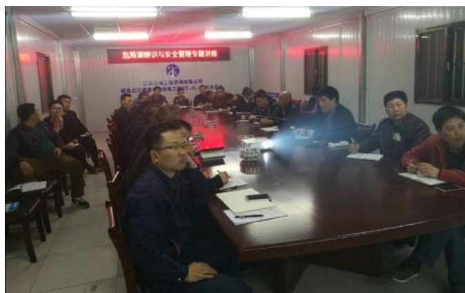
图 1-3 “双轨制”工学交替期间教师为企业开展安全讲座