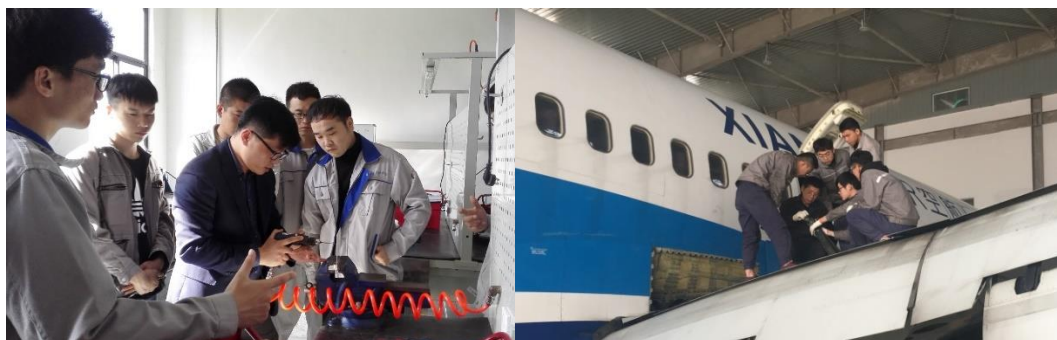
图 实施现代学徒制人才培养相关图片