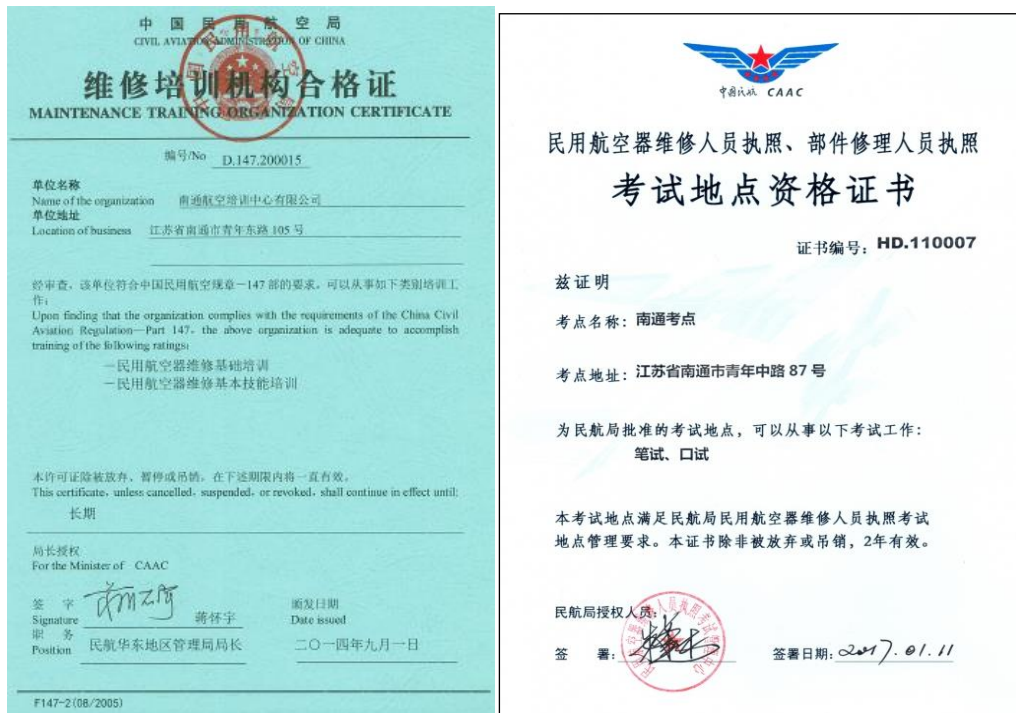
图 培训机构及考点资格证书

2013年6月企业与学校共同出资成立南通航空培训中心有限责任公司,2014年9月1日获得由中国民用航空局颁发的“CCAR-147 民用航空器维修培训机构合格证”,2017年1月获批 CCAR-66 民用航空器维修人员执照考试考点资质。全面实施 CCAR-147 基本技能培训、CCAR-66 基本技能培训、CRJ200/A320 机型培训等民航行业资格培训,以及民用航空器维修人员执照考试的理论考试及口试考试服务。