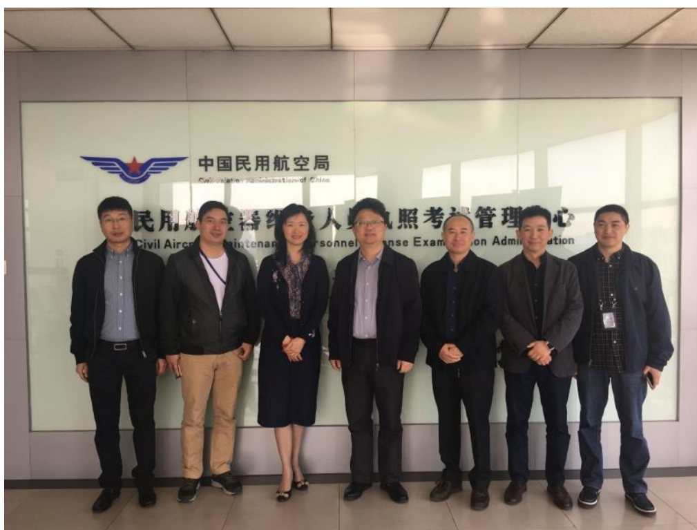
图 考点考试相关照片