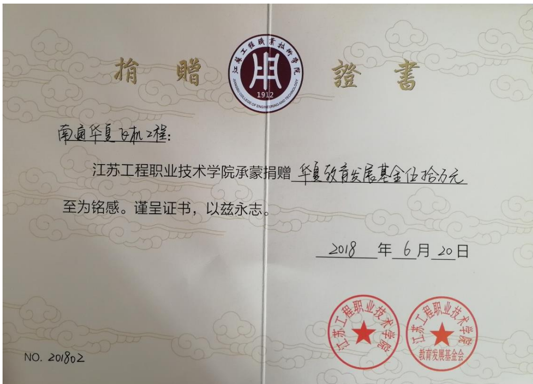
图 江苏工院捐赠证书