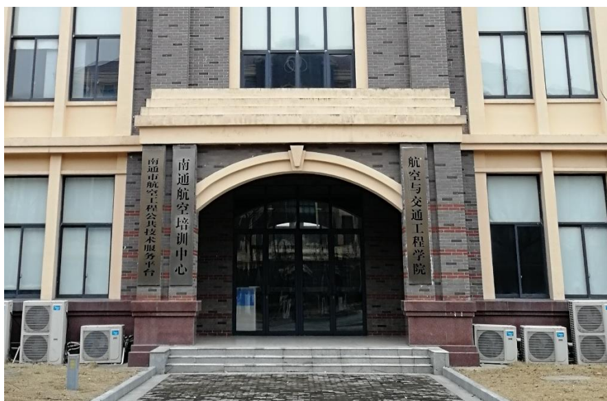
校企共建南通航空培训中心

企业与江苏工院共同建设南通航空工程公共技术服务平台，该平台的建设填补了从南通市到江苏省乃至整个长三角地区航空公共技术服务平台的空白，成为长三角以及华东地区航空及其配套产业的区域性重点公共技术服务平台。2018年服务平台完成横向课题 16 项，到账经费 80 多万元。