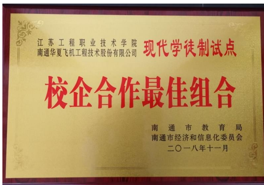
图 校企合作最佳组合铜牌