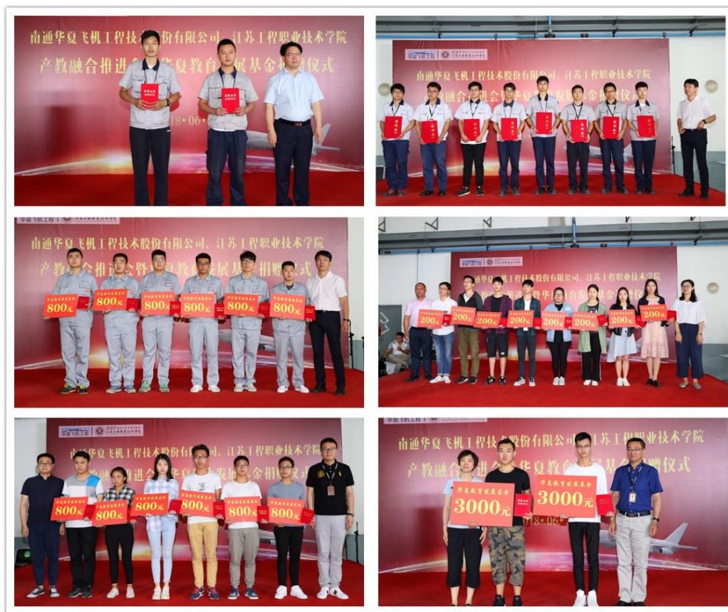
图 首批“华夏教育发展基金”奖学金获得者