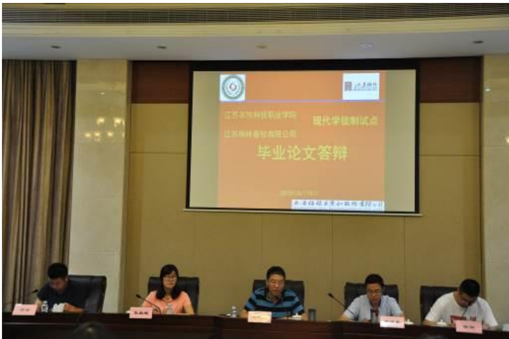
图 6 学生在企业毕业论文答辩