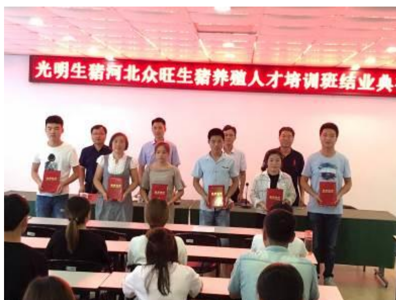
图3 生猪养殖人才培训班结业典礼

校企联合举办生猪养殖人才培训班，专业教师与企业专家组成双师授课团队，学校精心安排教学经验丰富的骨干教师担任主讲老师，企业安排经验丰富的场长担任带队老师，培训的学员从畜牧兽医零基础开始，学到了相关的理论知识，为下一步从事生猪养殖事业打下了坚实的基础。