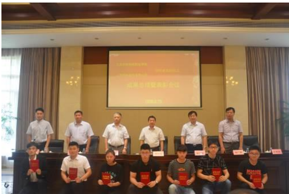
图2 现代学徒制班学生毕业典礼