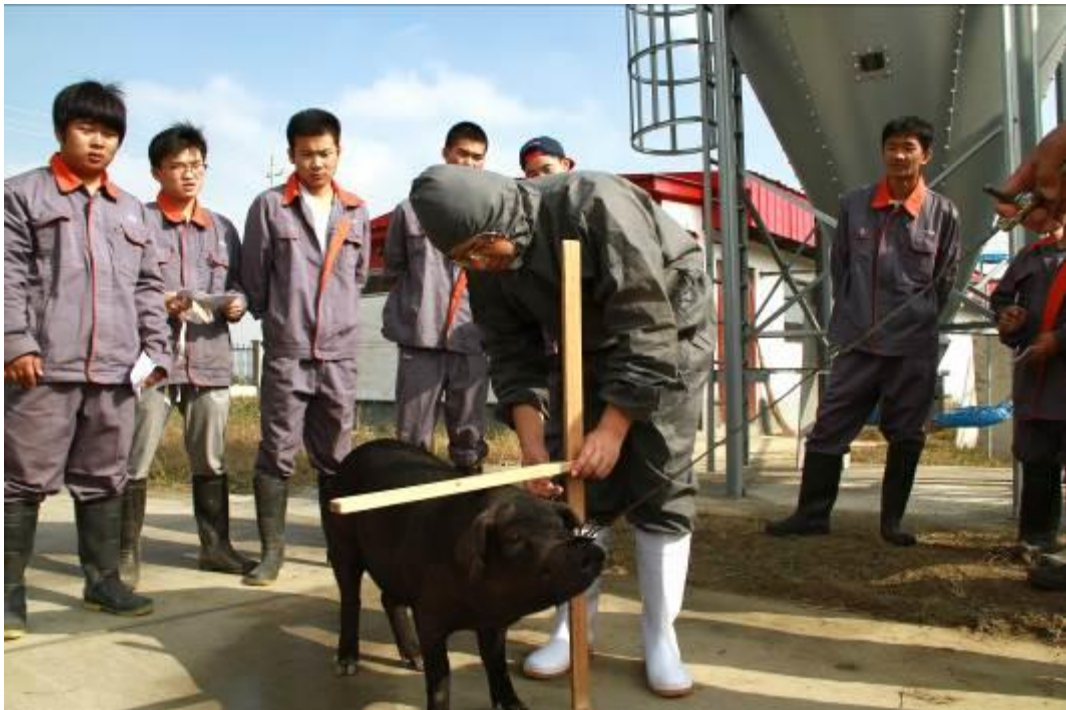
图4 企业师傅现场授课

按照现代畜牧产业人才的发展要求，以提升职场能力为核心，实施“双元育人、在岗培养、定向就业”，创建了“双向交互、四阶递进”人才培养模式，实施“双主体办学、双资源共享、双导师育人、双身份学习、双文化融合、双主体评价”，建立“双向引进、双向互聘、双向培训、双向服务”运行机制，按“学生→学徒→准员工→员工”成长路径四阶递进培养学生的职业能力，即第1阶段知岗体验，培养岗位通用能力；第2阶段跟岗学徒，培养岗位核心能力；第3阶段顶岗实习，培养岗位综合能力；第4阶段定岗入职，培养岗位胜任能力，实现学生从校园到职场“无缝对接”。