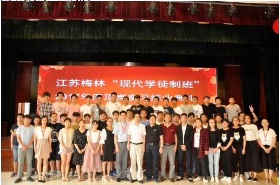
图1 现代学徒制班级在企业结业典礼

实行先招生后招工的招生模式，校企双方在一年级新生报到时进行宣传，学生经过自主报名、面试、到企业现场考察、签订协议、单独组建“现代学徒制”班。先是学生身份，后是企业员工身份，招生与招工同步，学员同时具备学生和企业员工双重身份。校企共同制订畜牧兽医专业“现代学徒制试点”培养方案，明确培养目标、规格、课程体系、学业考核、毕业与就业等问题，满足企业对人才的知识、能力、素质的需要，所培养出来的学生针对性和动手能力强，毕业后即可上岗操作，更加适应养殖行业的发展需求。截止目前校企合作组建了畜牧兽医专业现代学徒制试点班3个，共计80人。