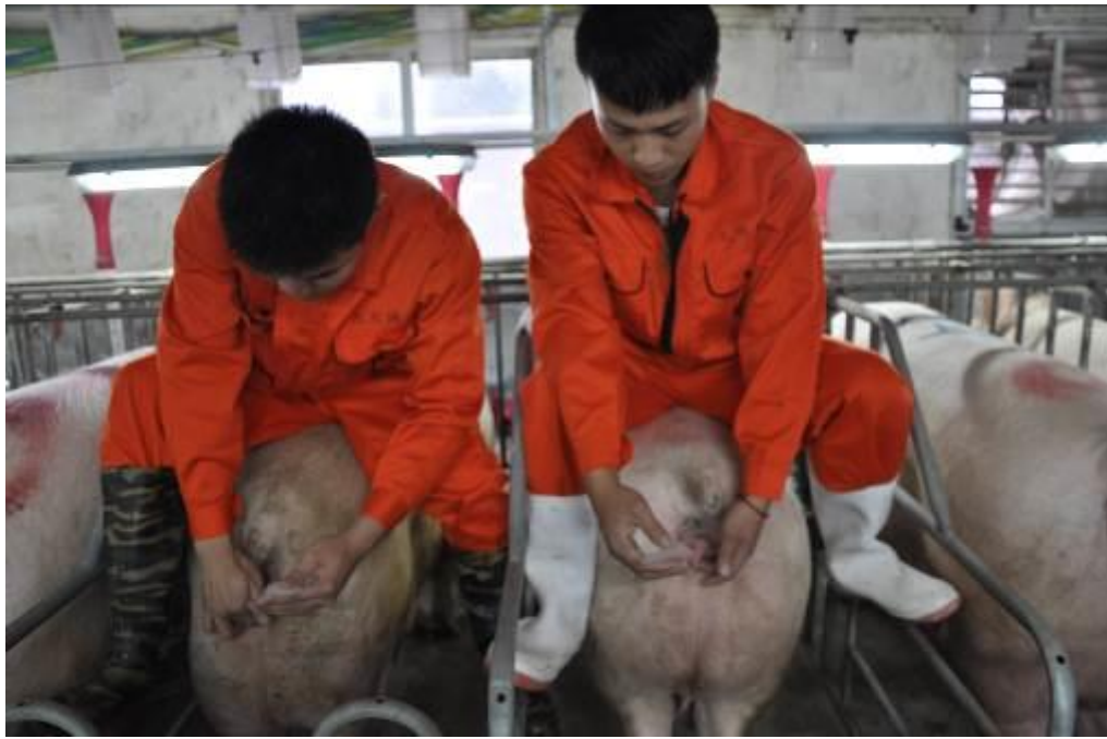
图 5 学生在进行技能操作