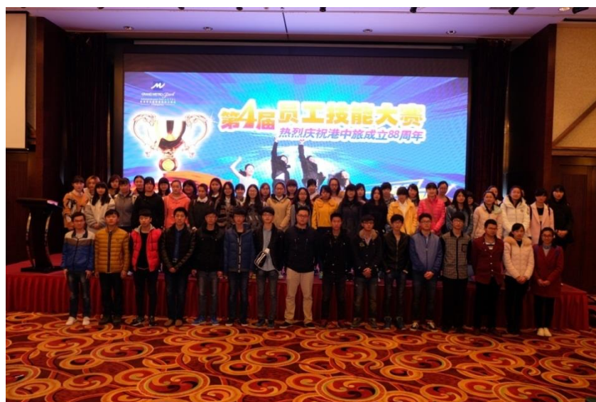
图 7 “港中旅”酒店英才班学生参加技能大赛