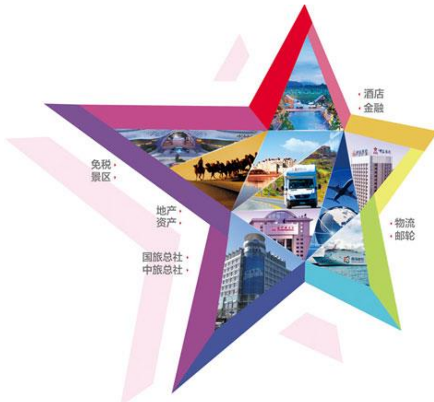
图 1 “港中旅”集团有限公司经营业务范围图示

集团公司在「十三五」期间要努力做旅游业供给侧结构性改革的引领者、旅游强国战略实现的主力军、游客全球旅行的系统服务商和人们美好生活的创造者。集团公司始终坚持以「服务大众，创造快乐」为己任，坚持创新、协调、绿色、开放、共享的发展理念，推动经济发展，成为具有全球竞争力的世界一流旅游文化服务集团。到 2020 年，要实现“规模、效益、品质、品牌和市场占有率达到世界一流”，成为具有世界级影响力和品牌知名度的旅游产业集团，进入世界一流旅游集团行列。集团还将选择和培育新产业，如旅游地产、旅游房车、旅游航空、旅游消费金融服务、旅游免税购物、旅游集散中心等。