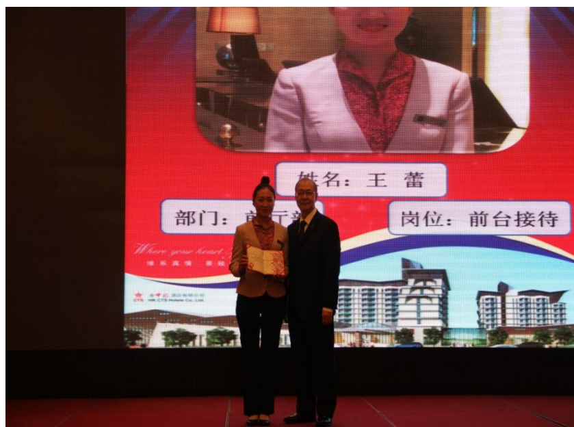
图 6 “港中旅”酒店英才班学生参赛获奖

为配合我校旅游类专业的“校企互嵌 工学结合 旺进淡出”人才培养模式的实施，“港中旅”集团有限公司为学生的“识岗”-“跟岗”-“顶岗”全过程介入，提供实习实训平台和实习岗位，全方位参与指导学生专业知识和专业技能的培养。