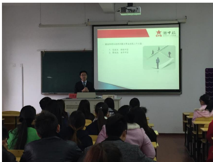
图5 “港中旅”酒店英才班上课场景