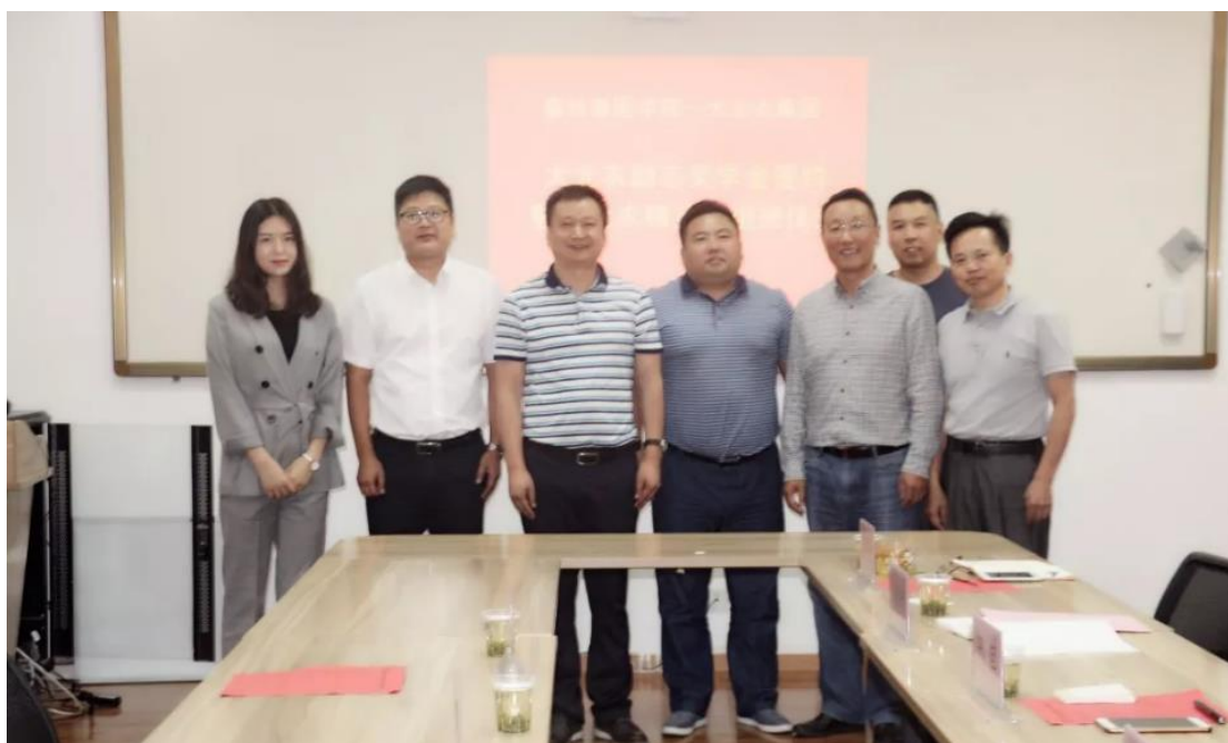
图 1 大北农励志奖学金签约仪式暨大北农精英班组班仪式