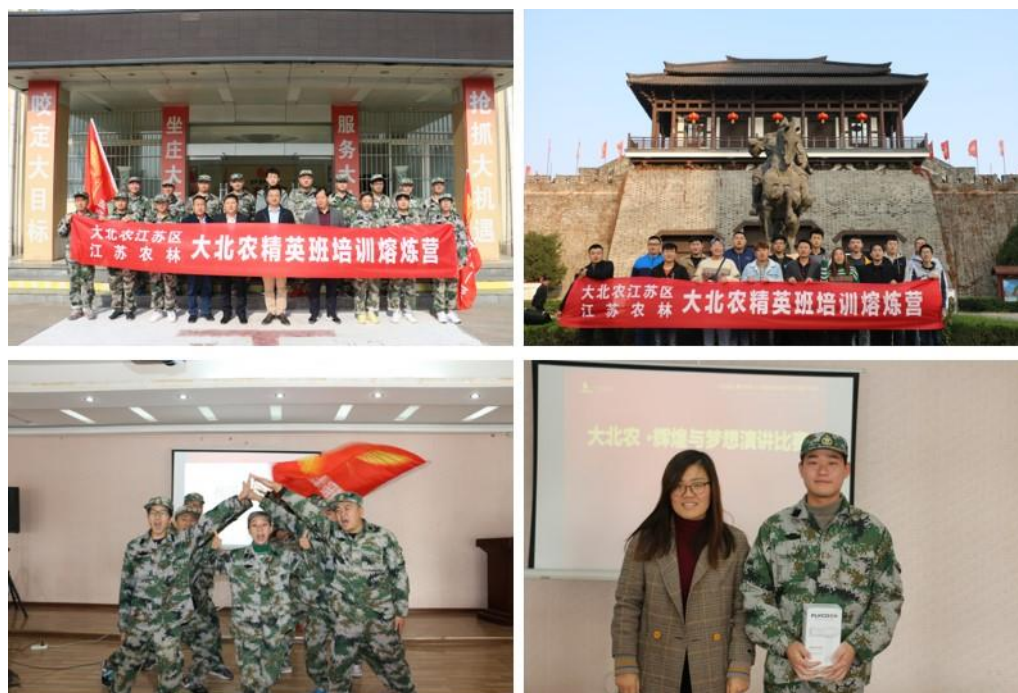
图3 大北农精英班培训训练营

责任和待遇，师傅承担的教学任务纳入考核，并享受相应的带徒津贴。江苏农林职业技术学院专业教师全部到企业一线锻炼，接受行业最新技术，提高实际操作能力和服务行业来增强教师的执教能力。