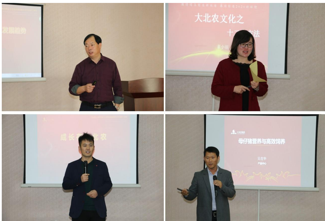
图 5 老师授课

同时，结合寒暑假，在生产任务淡季，为企业人员进行新规范的讲解，新仪器的使用操作培训。企业员工每年举行技能培训活动，促进企业技术人员的技术水平不断提高。