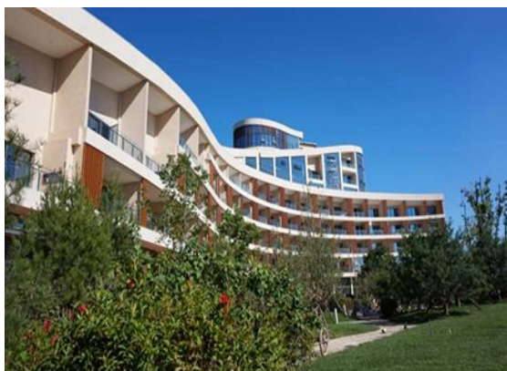
图3 青龙湖酒店工程图