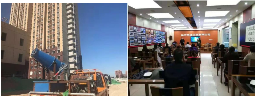
图 12 毕业生顶岗实习期间参与项目建设

作为校企合作单位，崇建公司致力于为毕业生提供顶岗实习及就业岗位，学院也优先为崇建公司输送专业能力强的优秀毕业生，提高人才培养的针对性。如 1501 建筑装饰姜凡同学，入职后先后在崇建公司市场部、项目监管部、项目部实习工作，并参与“千街百巷，环境提升工程”等多项政府工程建设项目。从一开始的工作环境认识，到学习制作标书、学习投标、开标流程、参与公司大型项目建设，再到代表部门向总部领导做工作汇报。学院毕业生在工作岗位上不断充实自己，提升眼界，提高格局，他们吃苦耐劳、善于学习的品质给公司领导留下深刻印象，见图 12。