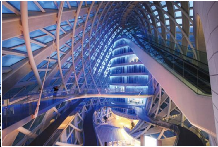
图 2 凤凰国际传媒中心工程