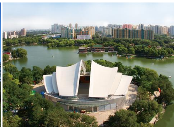
图4 龙潭湖中心岛露天文化广场