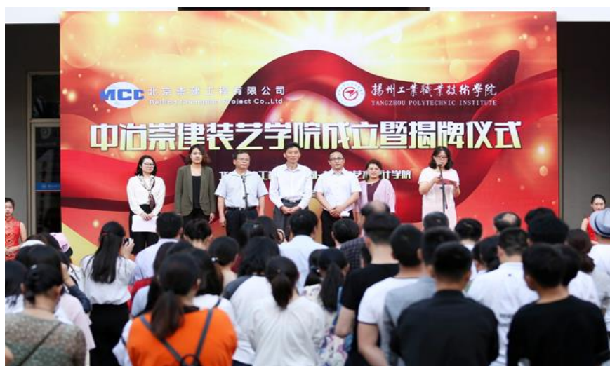
图6 中冶崇建装艺学院暨揭牌仪式

北京崇建工程有限公司成立于2005年，是以建筑业和新兴产业为主的国有企业，拥有包括国家建筑工程施工总承包、建筑装修装饰工程专业承包、展览工程企业和展览陈列工程设计与施工一体化壹级资质以及园林古建筑等在内的十多项工程建设资质，与装饰与艺术设计学院开设的专业契合度很高。2017年，双方签订校企合作协议，成立“中冶崇建装艺学院”（图6），实行校企双主体共管，装饰与艺术设计学院负责日常教学管理与运行，北京崇建公司负责学生企业实习实训及企业导师指导，双方迈入了校企合作的崭新阶段，见图7、图8。