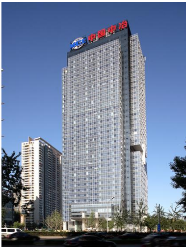
图 1 中冶集团总部大楼

凤凰国际传媒中心工程，极具精妙绝伦的建筑艺术美感，当之无愧成为后奥运时期北京市地标性工程（图 2）。该项目获得中国土木工程最高奖——“詹天佑奖”、“国家优质工程奖”、“中国建筑钢结构金奖”等一系列奖项。