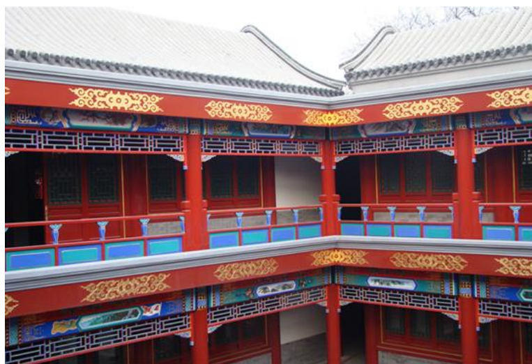
图5 金鱼池金台轩四合院

北京天雅古玩城、金鱼池金台轩四合院、前门大街改造工程与其他项目一道构成公司仿古建筑系列工程，重现了所在区域清末民初的京都风貌，古老与现代相融汇，续写着崇建员工为美化首都北京所做出的不懈努力和价值追求，见图5。