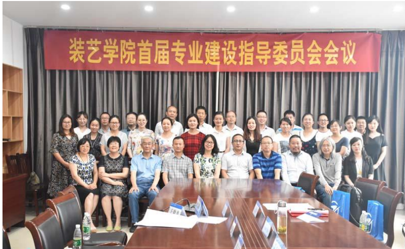
图9 装饰与艺术设计学院首届专业指导委员会