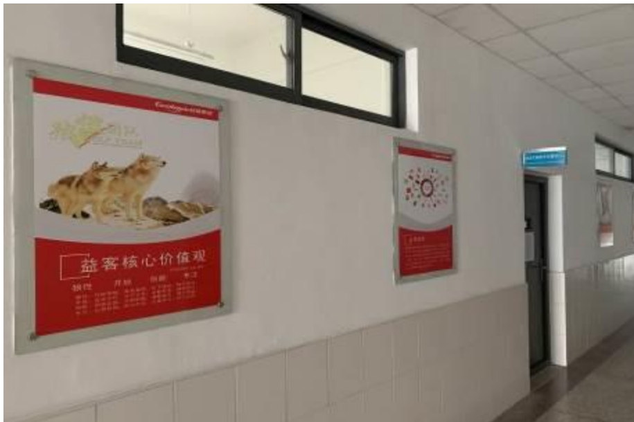
图8 江苏益客集团与江苏牧院共建校内实训

益客集团与江苏农牧科技职业学院食品科技学院共同建设校内专业实训室，满足日常教学及“益客订单班”特色课程实验教学需求。设立企业文化墙，用于企业宣传及“益客订单班”的宣传。