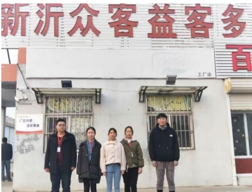
图3 “益客订单班”学员进入企业进行毕业顶岗实习