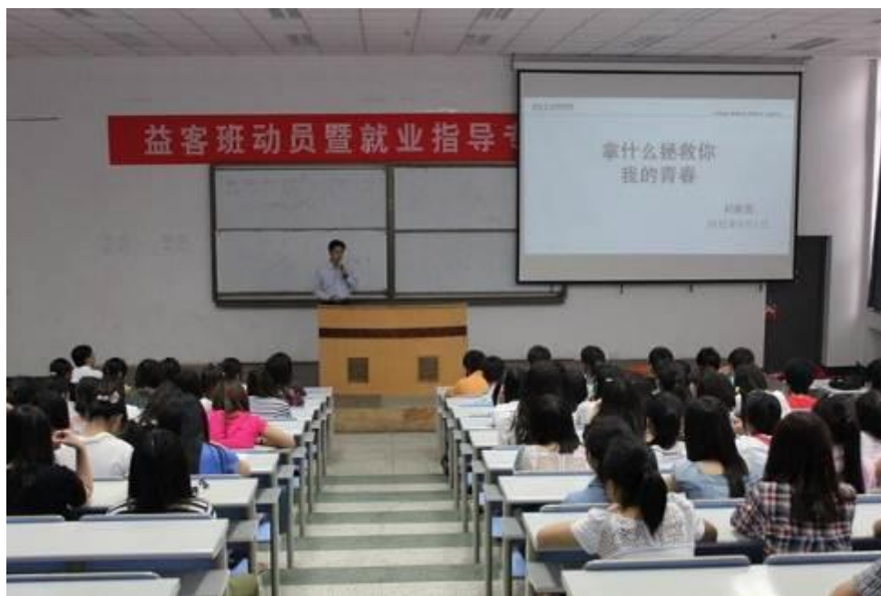
图1 益客集团入校进行“益客订单班”宣讲

为保证教学活动的顺利进行，及“益客订单班”的宣传，益客集团资助我院资源使用和相关活动管理经费20000元，用于特色课程课时费的发放，班主任管理费的发放，学员实验实习材料购买等，以及以“益客班”为平台，策划组织校内文体活动、专业技能比赛等项目。