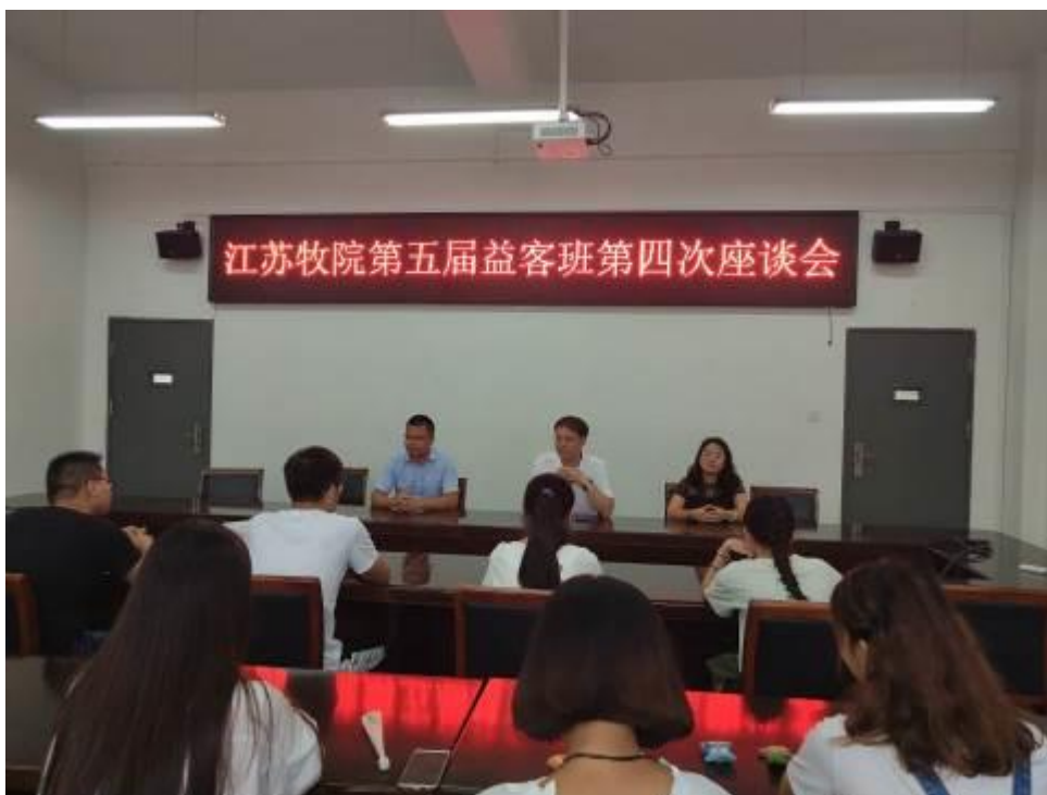
图2 江苏益客集团生产专家为学员进行授课