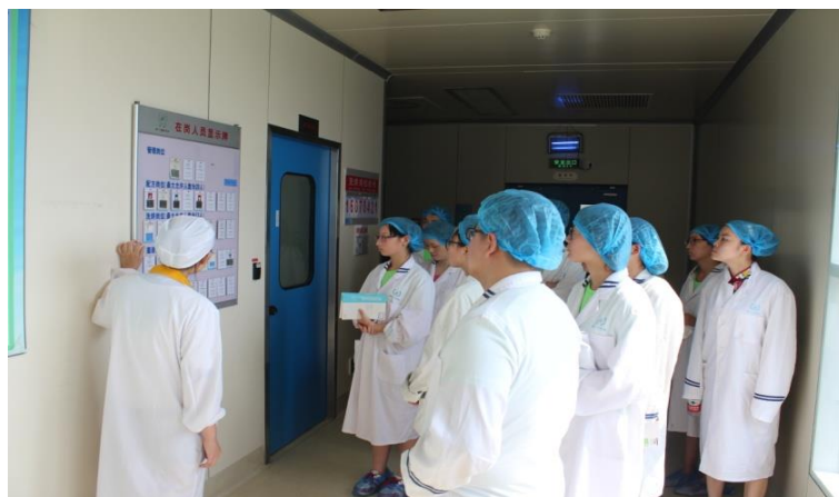
图1 “扬子江” 订单班教学

案，学生二年级进入企业半工半读前，与企业签订“试用工合同”成为企业的“准员工”，企业承担学员二、三年级学费，同时提供给学员（企业学习期间）免费食宿，每月发放1500元补贴，学生毕业与企业签订合同后享受企业正式员工待遇，企业为就业毕业生交纳“五险一金”。学员在企业学习期间，企业提供综合制剂车间4条生产线、质量检测中心，营销部等45个岗位用于学员实训教学，企业按50%的比例配备技术骨干作为企业导师和实训指导教师，建立了一支数量充足、结构合理、技术水平高的专业混编教师团队；为保证了课程教学项目实践条件的完整性，和企业原有的生产线互补，企业向学院捐赠了药品生产实训中心的片剂生产线和溶液剂生产线相关生产性实训设备用于项目教学，价值110万元。订单班纳入企业综合部管理，公司指派专人对该班相关事宜与学院领导、班主任进行接洽协商。此外，企业向药品生产技术专业赞助冠名费10万元，用于有关的人才培养、校企合作等支出。