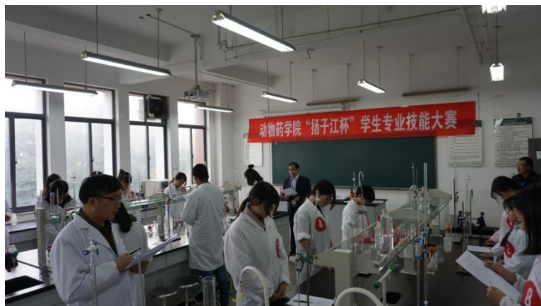
图4 扬子江杯学生技能大赛

与江苏农牧科技职业学院共建教师专业发展基地，以生产和科研促进教学，为企业技术更新、产品换代提供技术支持和智力保障；为教师获取一线实践经验，掌握新科技新技术提供平台；为学院“产学研”结合提供基础，实现资源共享、优势互补。依托教师发展基地，积极构建学习型组织，鼓励教师根据自己的专业兴趣结合学校专业发展的需要制定教师个性化的培养方案，以各类技能大赛为抓手，促进教师专业化发展。