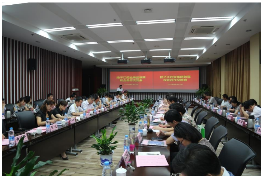
图5 学院参加扬子江药业集团校企合作论坛并做主题发言

公司全程参与专业人才培养方案的修订，提供人才需求数据信息支持，企业部门经理、技术骨干作为成员参与制定了2017、2018级药品生产技术、药品质量与安全专业人才培养方案，主持制定了“扬子江”订单班人才培养方案，使人才培养方案更加贴近企业需求。为向行业企业推介药学类专业开展的人才培养模式，公司与学院联合召开了校企合作推介会，有近40名行业企业的领导、部门主管应邀参会。