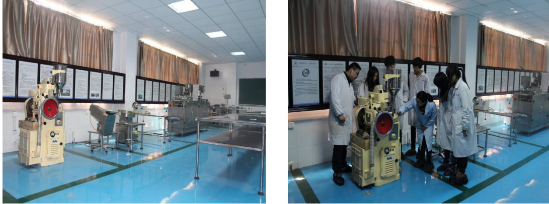
图6 共建药品生产实训中心（片剂生产线）