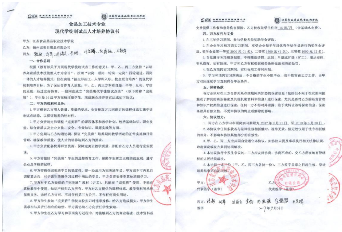
图 3 《现代学徒制》试点班人才培养三方协议

培养了逐渐能“顶上去”的“现代学徒”。经过企校双方的共同努力，2016 级的学徒们经过一年多的学习和成长，已经逐渐能够在不同的岗位上独挡一面。部分学徒已经参加了企业内部岗位竞聘，并取得了很好的成绩，得到了企业相关领导的一致认可。