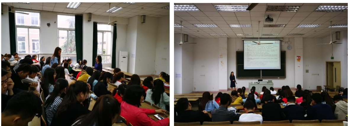
图 1 《现代学徒制》试点招生宣讲