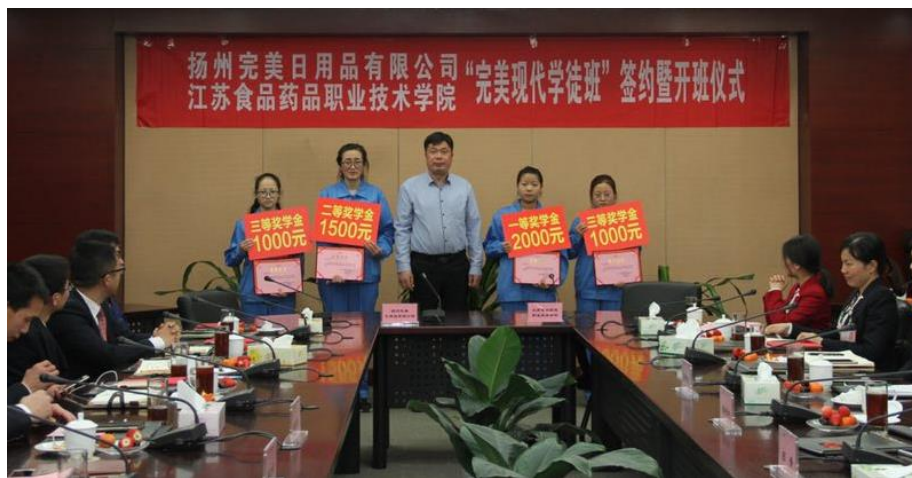
图6 《现代学徒制》完美班开班及奖学金发放仪式