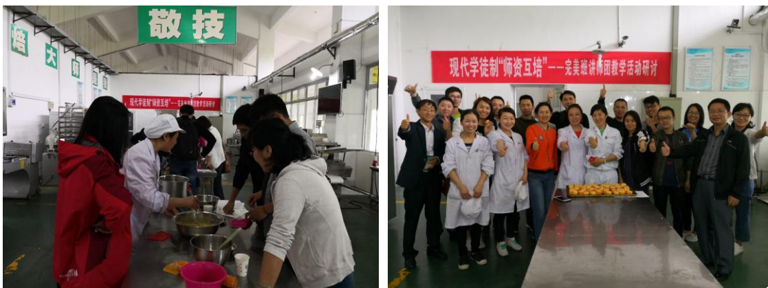
图7 企校教学研讨活动现场