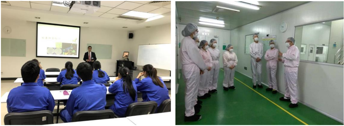
图5 《现代学徒制》完美班学生课堂掠影