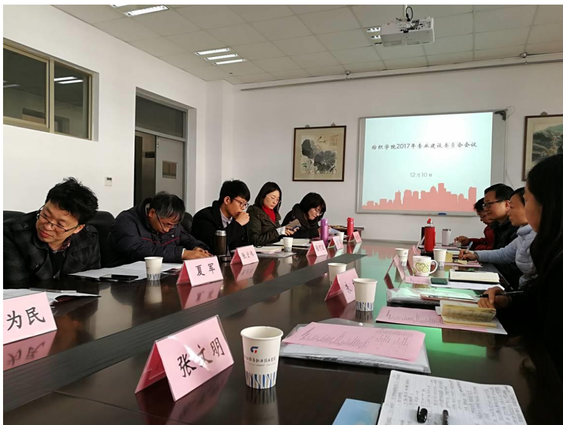
图1 常州天虹纺织公司领导参与专业人才培养方案论证