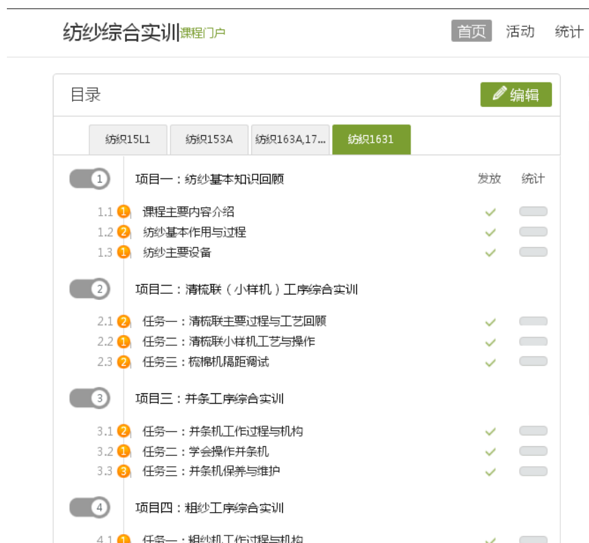
图5 校企合作成果——在线开放课程

在双方通力合作下，现代纺织技术专业承担的“纺纱设备维护”、“针纺织品检验工考工实训”两门国家资源库建设任务圆满完成，目前“纺纱综合实训”课程已完成校级在线开放课程建设，目前正积极申报江苏省精品在线开放课程立项建设。未来企业会持续在微课拍摄、资源制作、项目合作方面进一步提供支持。