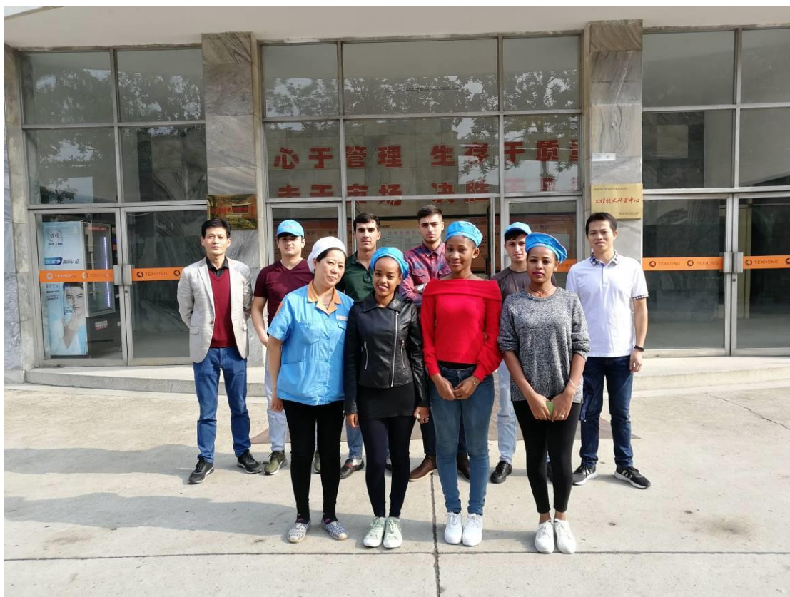
图2 教师带领留学生与天虹企业人员亲切交流