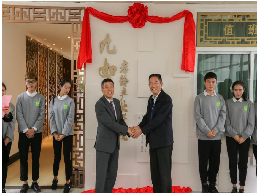
图 1 江苏经贸·九如城老龄产业学院在公司揭牌

“九如城”与江苏经贸职业技术学院，秉持“爱心、公益、专业、坚守”的共同价值理念，开启全方位、深层次合作，现已形成学生培养、师资建设、教学资源和社会服务等 4 个维度的联合体。2015 年，双方共建“江苏经贸·九如城老龄产业学院”（简称“九如学院”），进行了合作办学（Public-Private-Partnership，简称 PPP 模式）的实践，即“公办学校和民营企业深度融合的校企联合体，共育涉老专业人才，”实行“一校两区”（经贸校区和九如校区）开展人才培养工作。