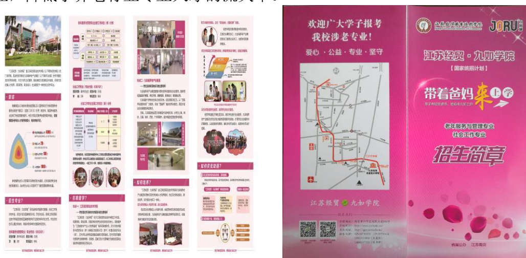
图8 校企合作开展面向社会服务的联合体招生宣传画

在合作办学过程中，为有效解决学生专业价值观培育的载体悬置与流于简单说教问题，校企合作共同打造了情境化、接地气的社会服务联合体。养老服务业是一个独特的行业，养老服务从业人员需要具备“爱心、公益、专业、坚守”独特价值观才能坚守为老服务，才能潜心学习，全情投入为老服务。为了培育涉老专业学生专业价值观，校企携手形成社会服务联合体，共同申报并实施《音乐介入养老照护》等公益项目，学生面对真实的工作情境和服务对象开展专业服务，提升了学生专业技能，培育、内化了学生专业价值观，使学生更加愿意坚守养老行业，降低了养老行业专业人才的流失率。