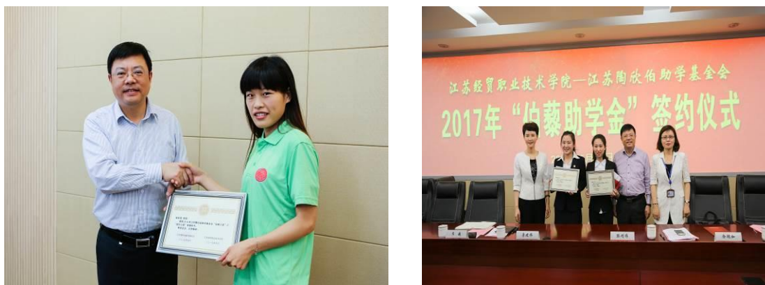
图4 企业在学校设立奖学金资助经济困难学生完成学业