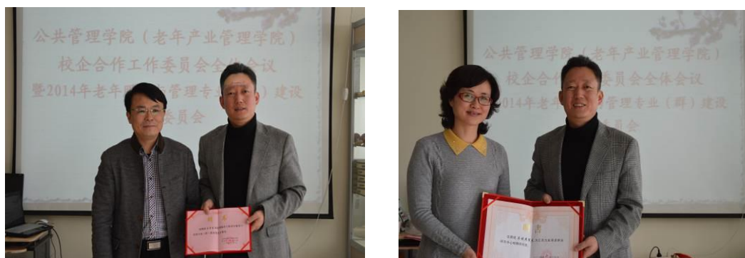
图 6 校企双方实现师资互聘

问题，我们校企双方共同构建了“双元互动”的教师发展联合体。在“二元身份、双兼互聘”的教师发展联合体中，企业能工巧匠既是导师又是师傅，专任教师既是学校教员又是企业员工。九如校区中高级管理人员和专业技术人员承担教学任务为其职责之一，九如校区各城市公司及达到 80 个床位以上的各养老机构承担教学任务并列入年度 KPI 考核。经贸校区专任教师兼任九如城中高级管理人员或研究员等专业技术人员，参与九如城四级养老服务体系规划和建设、职后培训等。