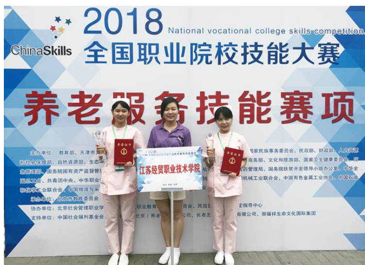
图 9 校企共同培养的学生获全国职业技能大赛一等奖

大赛以养老服务人员典型工作任务为导向，涵盖生活照料、基础护理、康复护理、心理护理、培训指导等内容，设置了案例分析、综合技能 2 个考评站点。优异成绩的取得为学校争得了荣誉，扩大了老年服务与管理专业在全国的影响力。备赛期间，学校领导多次来到院系慰问备赛师生；老年管理专业教学团队认真制定备赛方案，研究竞赛规程；学生刻苦训练，提升专业技能，磨炼意志品质。通过参赛，以赛促学、以赛促教、以赛促改，不断提高专业技能的培养，加强实践教学，提高学生的专业技能水平，促进学校涉老专业人才培养质量再上新台阶。