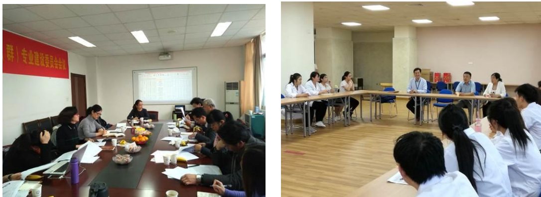
图 3 校企共同开发适合职业教育的课程并组织教学实施

“九如城”为适应企业发展的需要，与江苏经贸职业技术学院的教师共同开发适合职业教育的课程。先后开发了《老年护理与保健》、《适老化建设与设计》等 7 门在岗学习课程，累计 4032 课时。