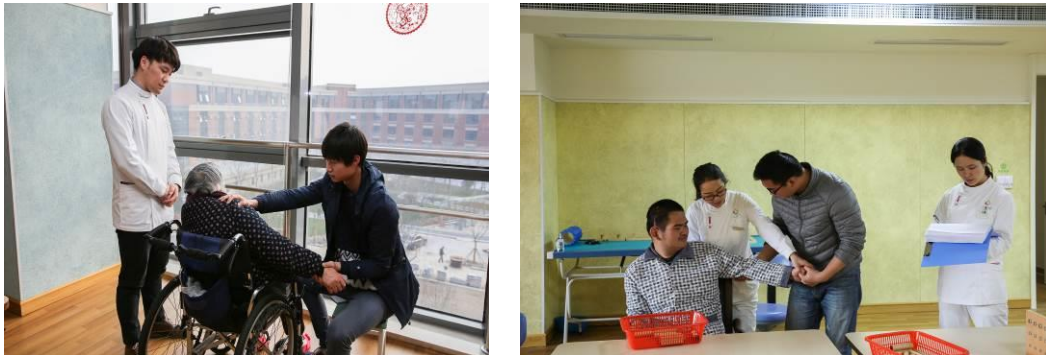
图 2 学校涉老专业在九如城开展现代学徒制顶岗实习

“九如城”在江苏经贸职业技术学院老年服务与管理专业人才培养过程中，在无锡九如城养老产业集团的九如校区，凡具有 80 个床位以上的养老机构中均设专业教学院，为学校开展现代学徒制试点的在校学生，提供顶岗学习和跟岗研习的场所。