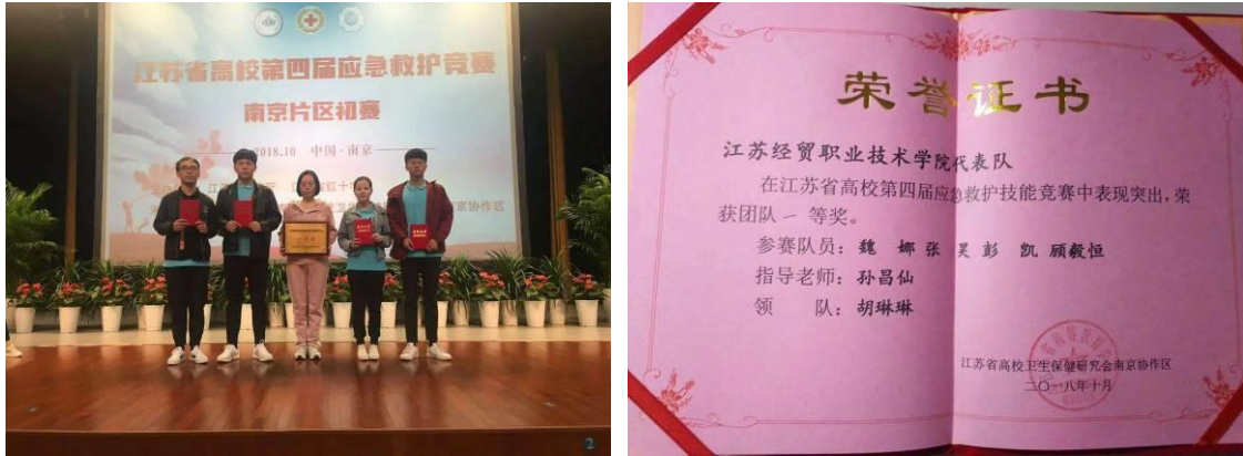
图 10 校企共同指导的学生获江苏省高校急救大赛（南京片区）团体一等奖

工作。我公司选派的业务骨干与学校教师齐心协力，对培训模块中的心肺复苏和创伤救护的 9 项操作，即：头部右侧出血、左前臂出血、左前臂骨折、盆骨骨折、左侧腹部匕首扎伤、腹部右侧肠管溢出、右踝关节扭伤、右小腿闭合性骨折、左大腿闭合性骨折。进行了反复刻苦的训练。最终，共同辅导的 4 名学生参赛选手于 2018 年 10 月 20 日赢得了江苏省南京片区团体一等奖的优异成绩。