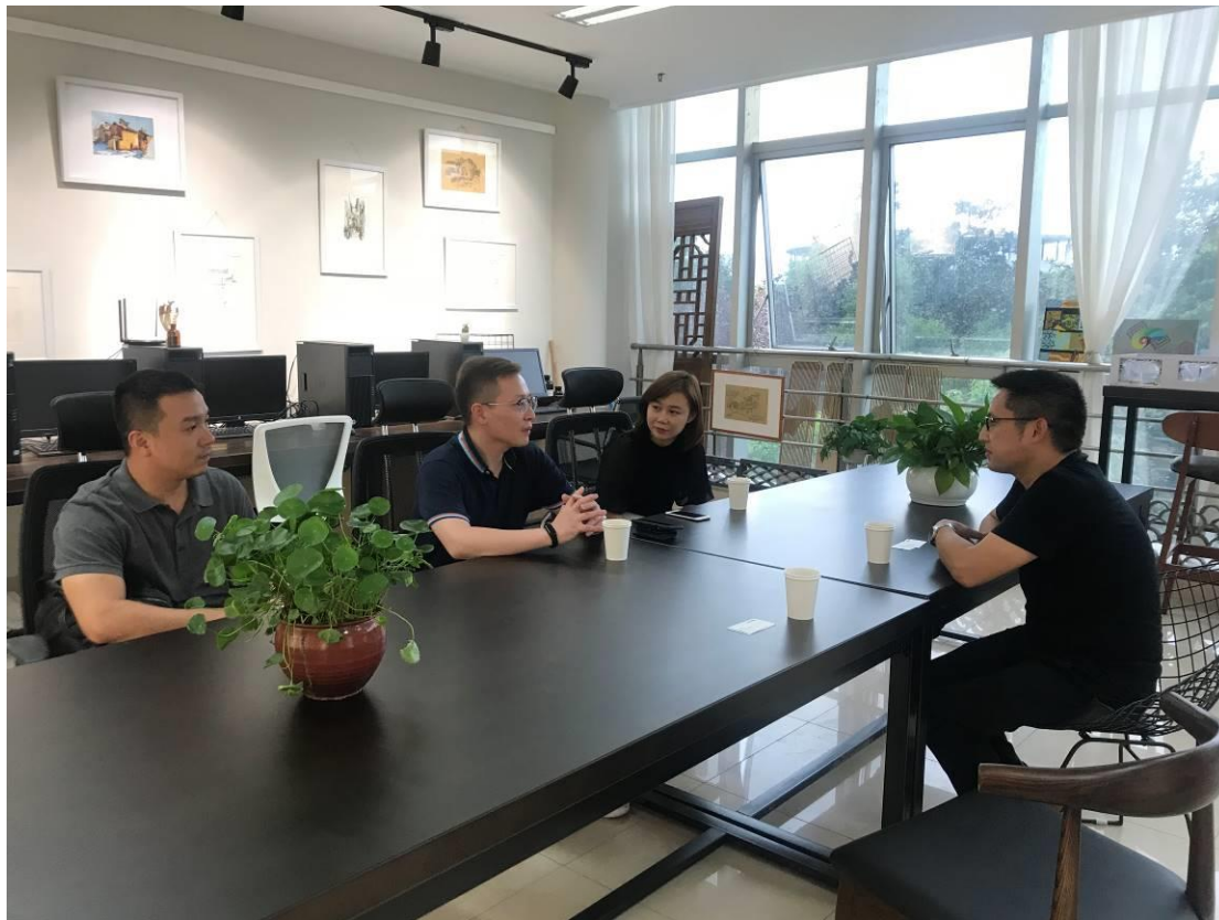
图2 校企就课程开发、学生顶岗实习和就业方面进行探讨