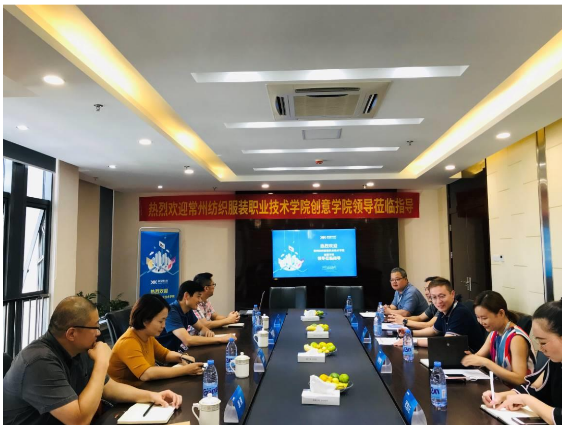
图1 企业与学校深度合作方式