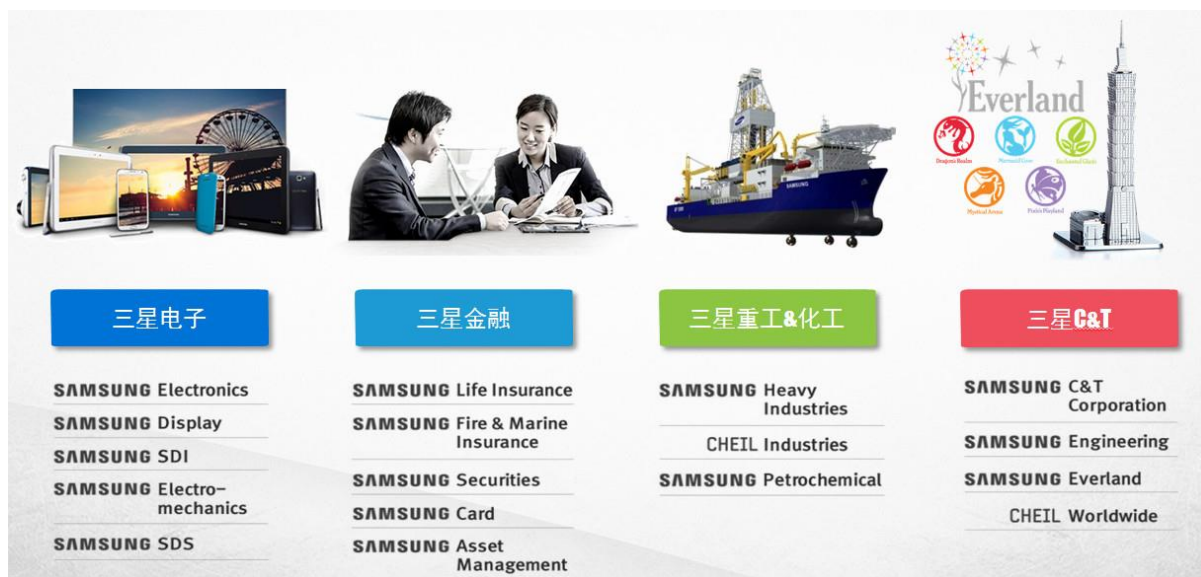
图 1 企业概括

型公司的代表。2016 年，苏州三星电子液晶显示科技有限公司作为副理事长单位加入苏州市现代装备制造职教集团，与我校在校企合作方面开启了新的一页。