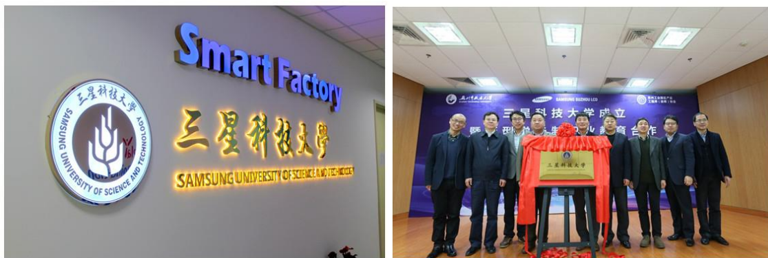
图 2 三星科技大学成立

2016 年底，苏州市职业大学与苏州三星电子液晶显示科技有限公司、苏州工业园区产业工程师（技师）协会三方合作成立“三星科技大学”，并签署新型学徒制职业教育合作项目。