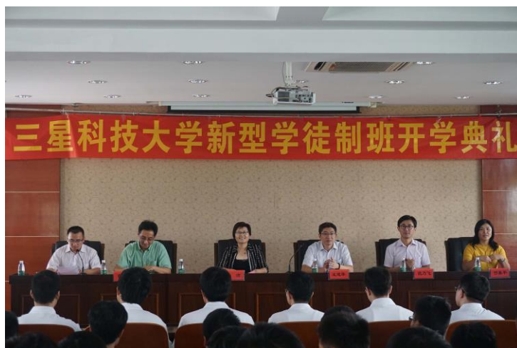
图 3 三星科技大学新型学徒制开学典礼