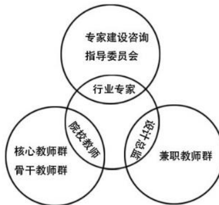
图 2 教师团队架构

三是齐建共享“互联网+”时代，融入信息技术的教学资源。利用学院现有的网络教学平台，建设基于“互联网+”的优质共享专业资源库。校企团队的合作计划联合建成 1-2 门省级在线开放精品课程、3-4 门院级在线开放精品课程，通过课程资源、专业资源、素材资源、职业认证、校企资源、就业服务等 6 个模块的资源积累，系统而有序的资源整理为教学提供有效的支撑，也为校内学习者或校外的学习者们提供资源帮助，实现资源的建设与共享，切实发挥教学资源的价值。在以后的教学中不断增加课程资源并更新其它的资源模块，使资源库成为常用常新，与时俱进的有效资源库。通过合理高效的使用资源库将资源与教学有机的融为一体，提高学生职业岗位技能。