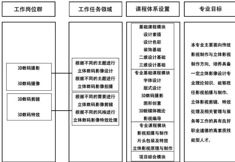
图 4 课程体系图