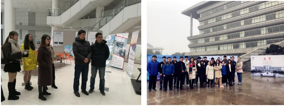
图 1 校企合作人才培养作品展