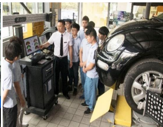
(企业兼职教师给学生授课)