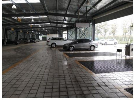
(最新型设备的汽车美容、洗车岗位)