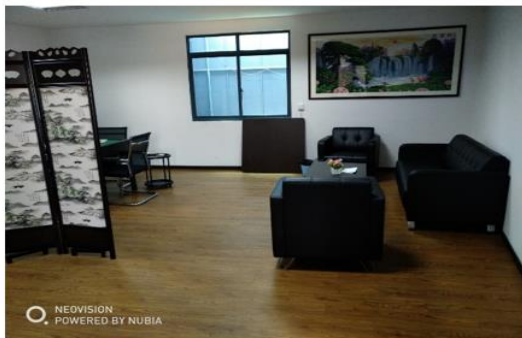
(贵宾接待室：培养学生汽车售后服务能力)