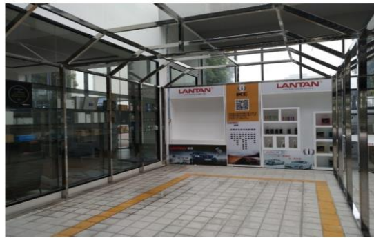
(高端汽车美容用品展位)