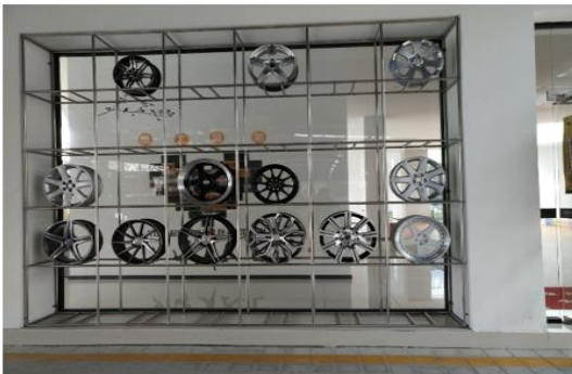
(高档轿车铝合金钢圈展位)

引入爱客公司的其他 3 家分公司作为本专业校企合作的校外实训基地，提供汽车销售、机电维修、保险理赔、汽车喷涂、服务顾问等近 120 个工位，总经营面积 12000 多平米，售后服务面积 10000 余平米，拥有汽车故障诊断仪、四轮定位仪、大梁校正仪等先进的诊断仪器及维修设备，总资产 1280 万元，为汽车专业学生提供了一流的实训实习条件。