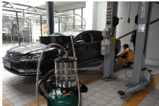
(整车综合故障维修岗位)