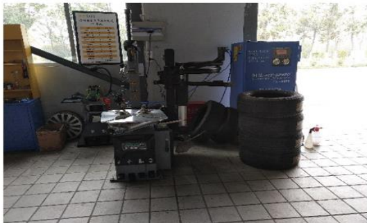
(先进的汽车扒胎机)