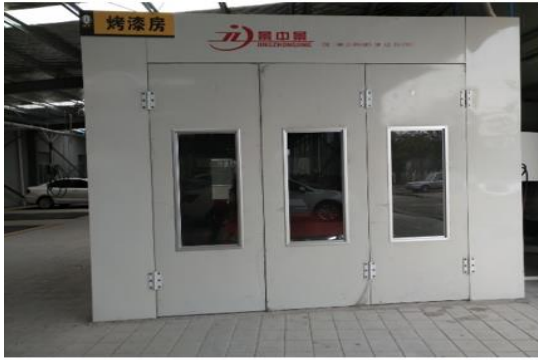
(最新型景中景汽车烤漆房烤漆岗位)