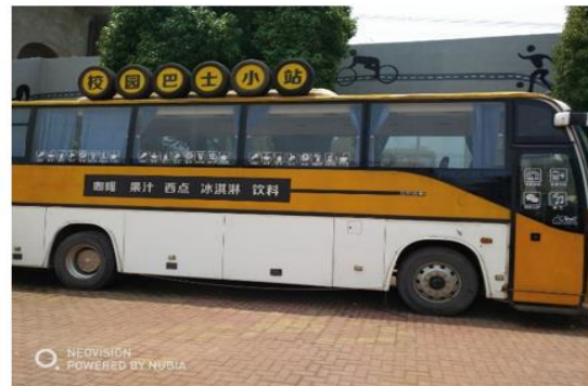
(爱客汽车校园巴士小站：提供学生的创业能力)