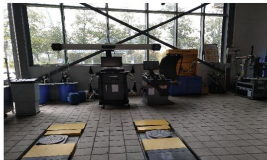
(最新型的汽车四轮定位检测仪)