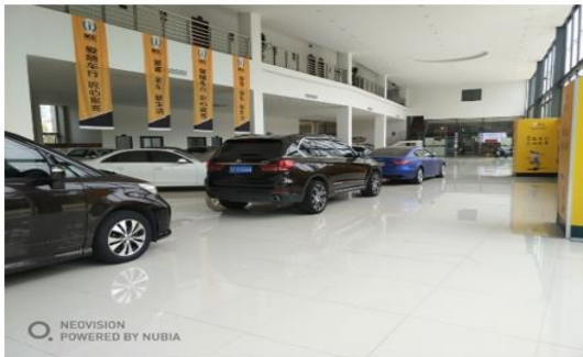
(宽敞明亮的展厅：汽车销售顾问培训区)