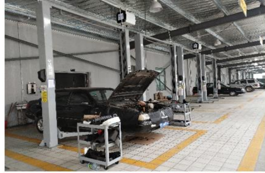
(最新型举升机、专业维修设备的整车综合故障维修岗位)