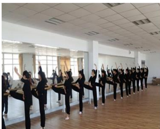
图 3-2 高铁动乘班学生形体训练教学

与南京铁道职业技术学院共建高速铁路动车乘务综合实训室，在高铁动车模拟训练仓型号选用、技术参数设置、功能实现上共同开展方案的论证工作，提供技术支持。最终选用：车型外观选用 CRH380B 车型，模拟训练仓分为：驾驶舱区域、厨房吧台区域、乘客区域和后门区域等，为高铁乘务专门人才培养创造技能训练环境。