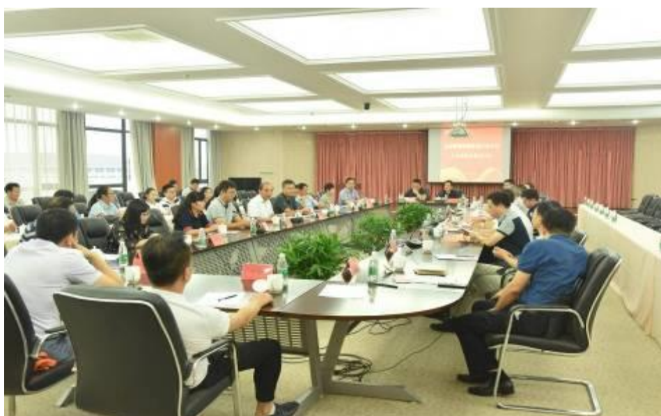
图 2-1 “混编”教学团队共同制订专业教学标准

一直以来，南京客运段和南京铁道职业技术学院在专业建设、技术研发、人才培养、社会培训等方面保持着密切校企合作。在人才培养方面，我段积极为学院学生了解铁路系统、规划职业生涯、培养实践能力提供有益平台，作为学院实习基地，自 2014 年春运首次开启校企合作新模式后，连续五年共 1325 名学生在春运期间到段上车实习，通过实践有效锻炼了能力。段还为学院干部培养锻炼提供平台，2016 年运输管理学院程谦副院长到我段挂职段长助理进行锻炼，参与领导班子会议，深入基层车队调研，与段共同研究制定了“高铁车队标准化管理体系”，将理论研究与实践工作相结合，推动了段相关工作，也促进了挂职干部综合素质的提高。在教学研究方面，段还作为学院铁路文化研究中心“服务文化研究基地”，为学院教学研究提供平台，就加强铁路服务文化建设不断深化合作交流。