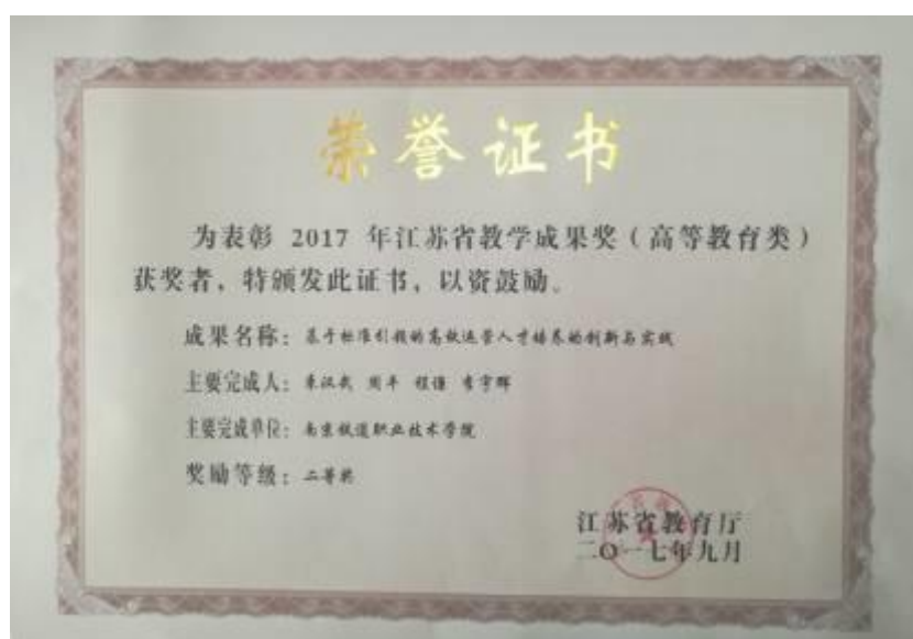
图 2-4 江苏省教学成果二等奖