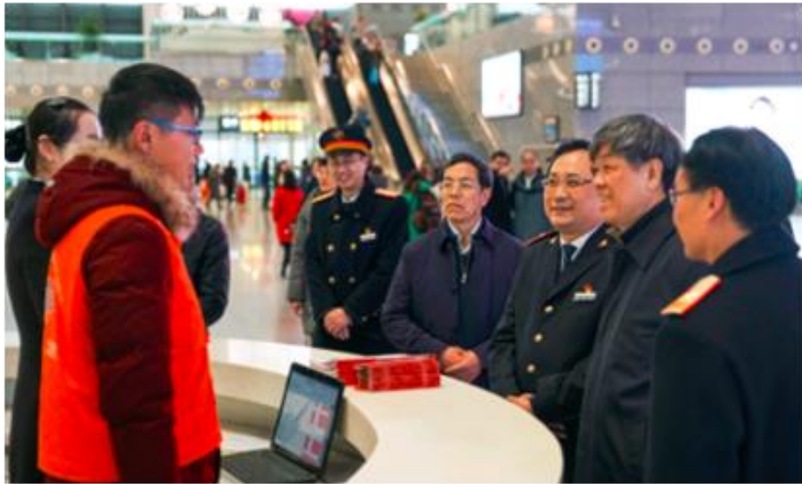
图 6-1 铁路总公司党组书记、总经理陆东福慰问志愿者