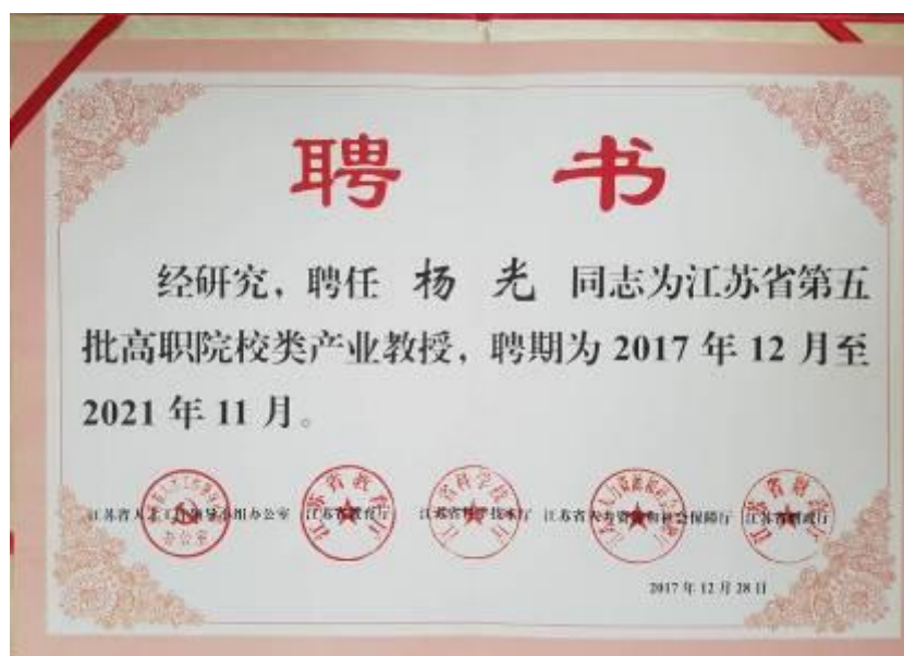
图 2-3 南京客运段杨光段长受聘为江苏省第五批高职院校产业教授

校企双方依托校企合作委员会，在组建企校“混编”教学团队的基础上，进一步优化人员结构，形成了以江苏省第五批产业教授、南京客运段段长杨光为企业代表，运输管理学院院长、行业教学名师周平为学校代表，共计 12 人的“混编”教学团队。校企共同开展教育教学、实训基地建设、职业技能鉴定、科研项目申报、企业文化研究等项目。打造全国铁路列车长等关键岗位品牌培训项目，专业企校“混编”教学团队共同开展高铁客运服务关键岗位员工培训，年度为铁路关键岗位工种培训约 2900 人，共同开展国家铁路局《铁路客运站车餐饮服务质量分析及改进研究》等横向课题研究工作，获国家教学成果二等奖 1 项，江苏省教学成果二等奖 1 项。