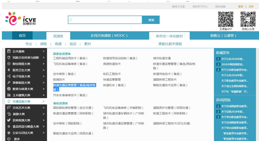
图 3-1 国家级铁道交通运营管理专业教学资源库（备选）

与南京铁道职业技术学院共建铁道交通运营管理专业教学资源库，双方组建合作开发团队，客运段提供高铁乘务最新技术标准和优质课程资源，合作开发了《铁路客运组织》《铁路客运服务心理》等课程教学资源。2018年铁道交通运营管理专业教学资源库遴选为国家级专业教学资源库（备选）。