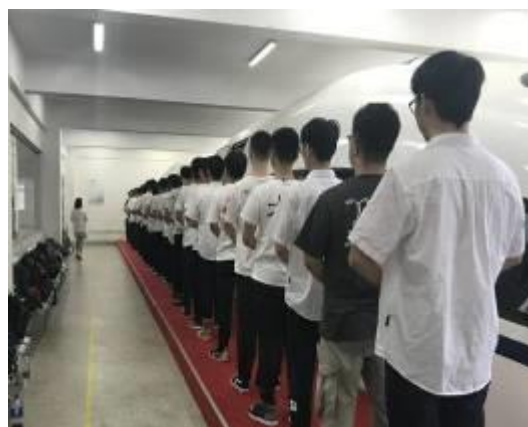
图 3-3 企校共建高速铁路动车乘务综合实训室