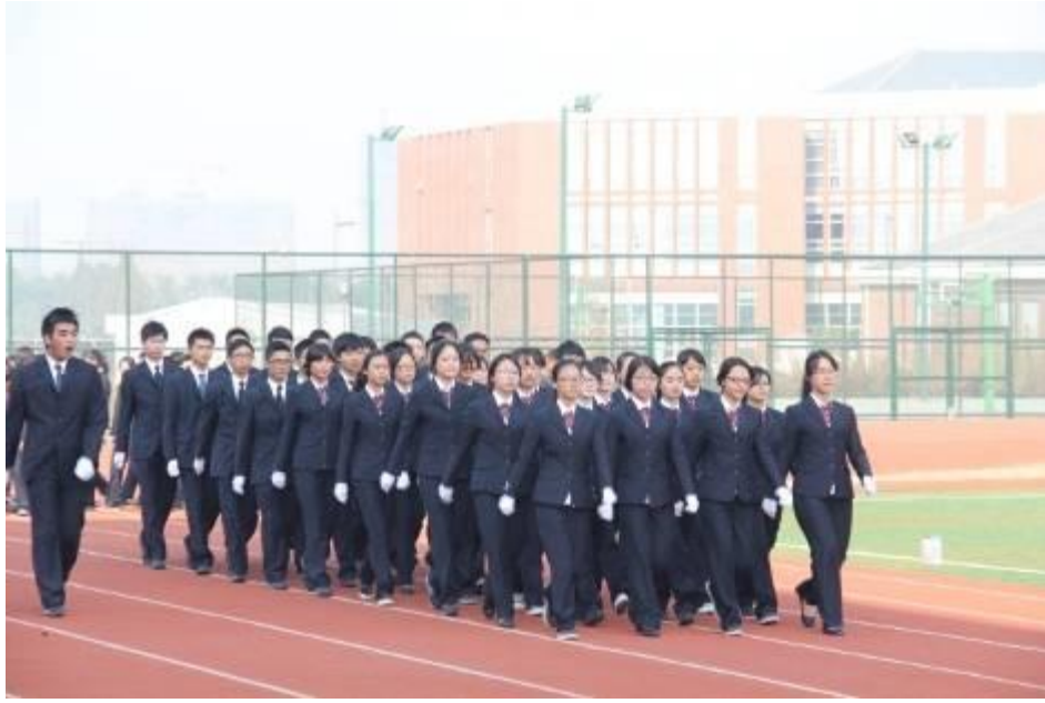
图 4-1 学生半军事化训练（队列训练）