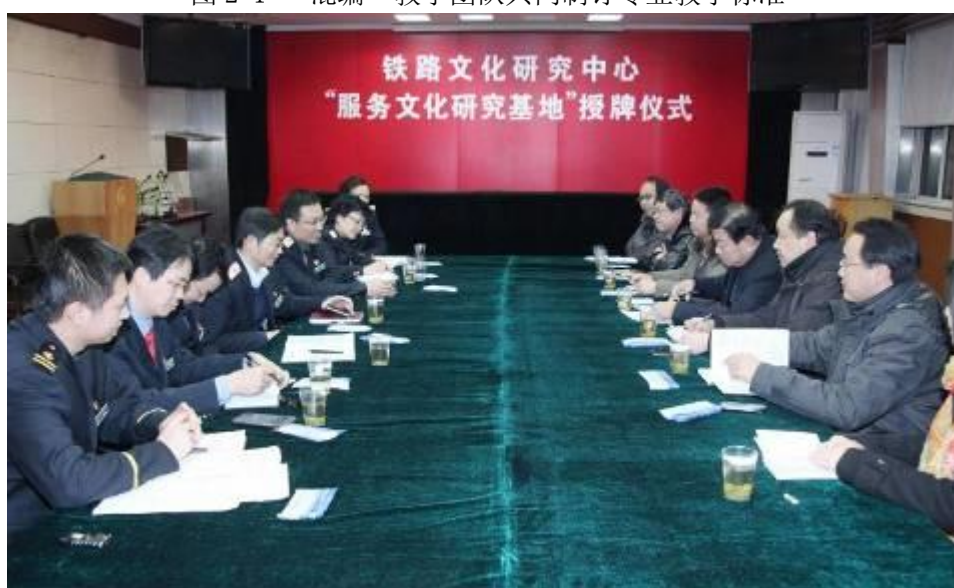
图 2-2 企校合作成立铁路文化研究中心