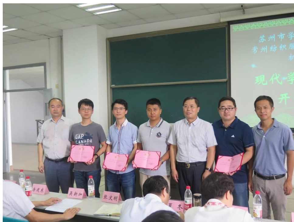
图2 聘请企业工程师为客座讲师

校企安排优秀教师共同组建学徒制项目教学改革小组，聘请客座讲师到学校担任专业课程或者开设专业讲座，并逐步探索“双师型”教师培训模式。