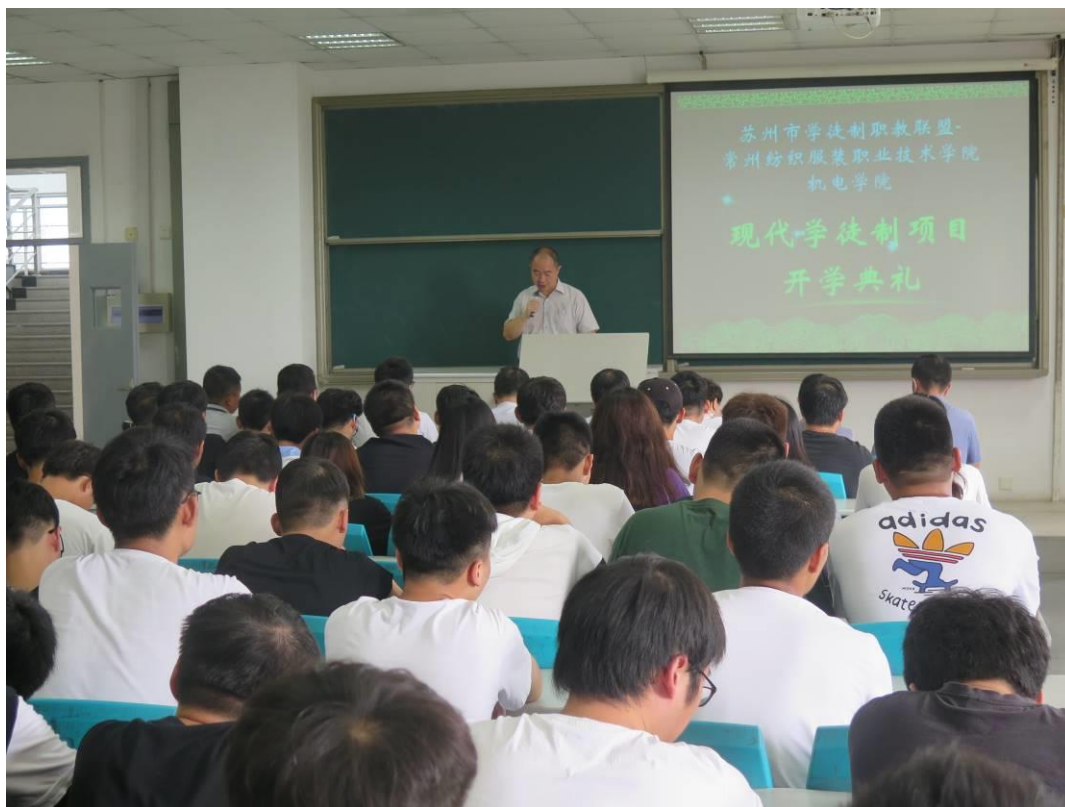
图3 现代学徒制项目开学典礼

签署合作协议，建立现代学徒制项目，学徒实施分阶段培养、多方参与评价的双主体育人机制。