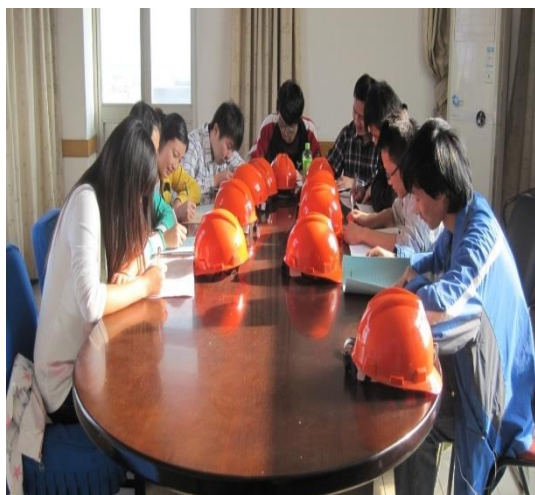
图4 港口对学生进行安全教育

在正式学习专业基础课程和专业课之前，港口与航运管理专业学生前往港口集团进行为期一周的认知学习，了解港口作业流程，切身感受企业文化和工作氛围，加深对专业课程的认识。实习期间，港口集团成立专门负责小组，分组分岗位对学生进行安全教育、作业岗位现场教学等工作，帮助专业新生快速融入专业学习。