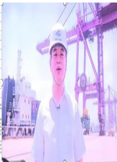
图2 港口集团与专业教师签订实践协议