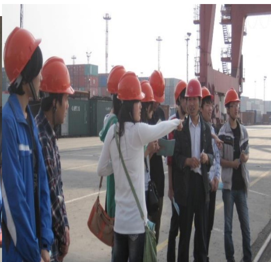
图5 员工现场为学生授课