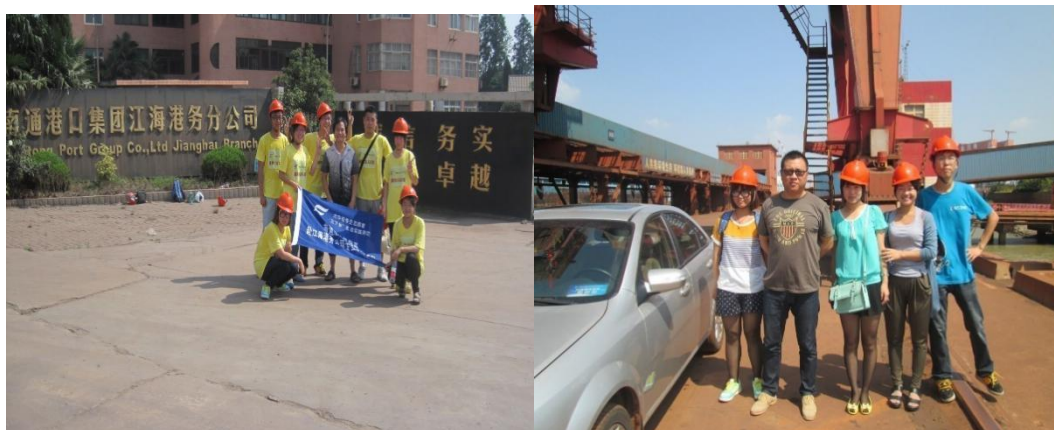
图6 专业暑假社会实践团队