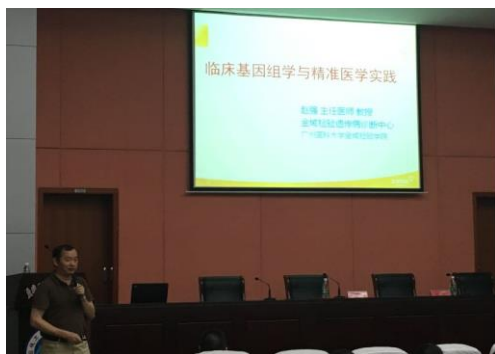
盐卫金城大讲堂照片