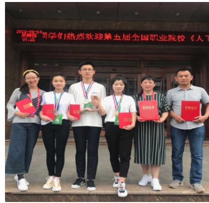
2018 年学生技能大赛获奖

依托盐卫金城医学检验所产教融合实训平台，校企双方合作建成 5 门校级精品开放课程，完成项目化实训指导教材 5 部。共同申报省级科研课题 10 多项、申请实用新型专利 20 多项，指导学生申报各级各类创新创业项目 8 项，产学研全面合作成效明显。通过科技成果转化，提升了社会服务能力。