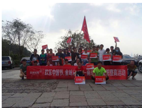
南京金城实习生登山活动