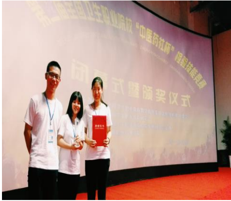
2015 年学生技能大赛获奖