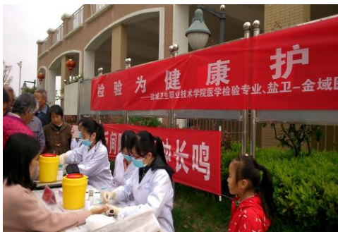
盐城益丰社区血糖、微量元素检测

校企合作后，盐卫金城医学检验所业务量逐年增长。打造高端和非常规检测项目三小时服务圈，专业服务延伸至社区和家庭，年平均服务人次 20 万，服务到账经费达 900 万元；引领区域医疗卫生检验新项目、新技术推广和培训，年平均逾 800 人次，到社区、养老院进行微量元素检测等义诊活动年均 500 人次。