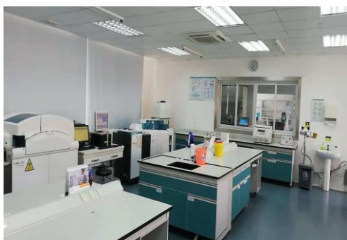
盐卫金城医学检验所生化室

南京金城医学检验所十分重视教学工作，投入了大量的人力、物力，建设教学基地，在江苏医药职业学院内部建立了盐卫金城医学检验所，实验室面积大约 1000 平方米，配备生化室、临检室、免疫室、血液室和标本接收室等，相应设施设备齐全。专门方便检验专业的学生就近进行见习使用。南京金城医学检验所各科室均配备专职或兼职教学老师，为江苏医药职业学院的教学、实习等教学创造了良好的条件。