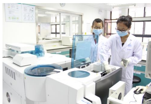
学生在检验所生化项目检测

积极投入教学资源共建，开发优质实践教学资源：①以行企业标准为依据，校企共同开发了 5 门优质核心课程实训项目及评价标准，校企共同评价教学质量。②共同编写了 5 门核心课程涉及 76 个项目的项目化特色实训教材 5 部。③利用盐卫金城医学检验所平台，针对《临床基础检验》、《免疫学检验》和《微生物学检验》等专业核心课程，合作拍摄检验岗位典型任务规范操作的教学视频 30 部；引进并开发医学检验虚拟仿真系统 1 套。④定期开展金城大讲堂，并与金城检验集团下属的 28 家省级中心实验室开展远程视频及互动交流共 50 场次，专业人才培养紧贴行业发展。