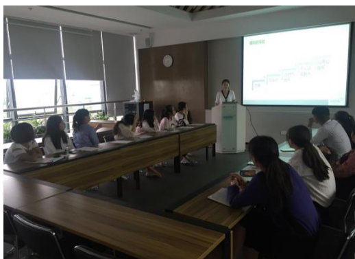
南京金城检验实习生沟通会