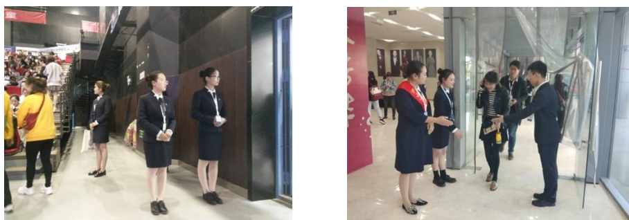
图7 参加全国幼教高峰论坛活动之二