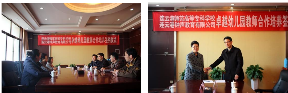
图 1 合作培养签约仪式

除了作为连云港师专的教育实践基地、承担教育见习指导任务之外，钟声教育集团还充分发挥民办幼儿园机制灵活的优势，主动介入连云港师专学前教育专业的人才培养工作。经过反复协商，2017 年 12 月 21 日，双方正式签署了“卓越幼儿园教师合作培养协议”，启动了共同培养卓越幼儿园教师的深度合作工作。