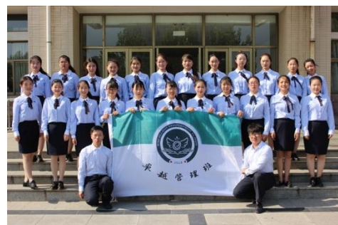
图2 卓越管理学生设计的班徽、班旗和班服。