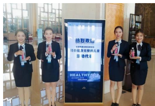
图 6 参加全国幼教高峰论坛活动之一