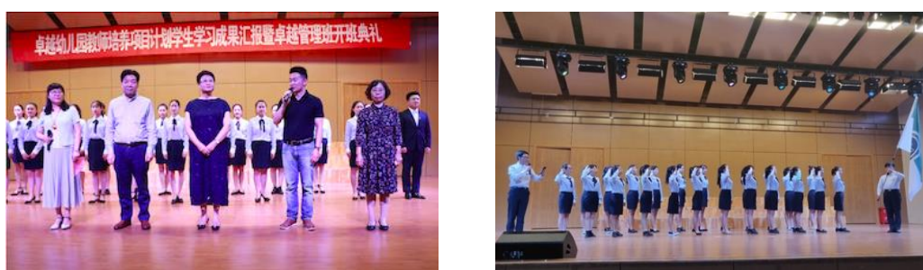
图 3 2018 级卓越管理班开班典礼

首批 2018 级卓越管理班共有 25 名学生，是从学前教育专业 2015 级本科生和 2016 级专科生中经过多次考核筛选出来的。他们来自不同的班级，在学习经验、兴趣爱好、能力特长、个性特征等方面存在差异，但是，他们都有挑战自我、追求卓越的强烈愿望。