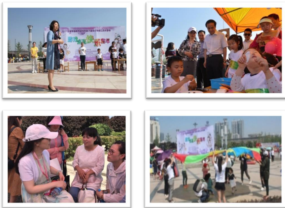
图9 策划、组织2017年学前教育宣传月江苏分会场的活动

10月19日，由连云港市教育局主办，钟声教育集团承办，中国精英园长联盟协办的“全国健康幼教高峰论坛”在江苏连云港隆重开幕。本次论坛以“健康幼教责任与使命：培养健康完整的儿童”为主题，吸引了来自江苏、浙江、山东、湖南、福建、四川、河南、重庆、内蒙、新疆等全国各地幼教同仁600余人齐聚港城，进行为期三天的研讨和学习。