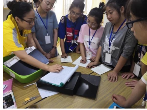
图 4 在钟声教育集团本部进行保育见实习