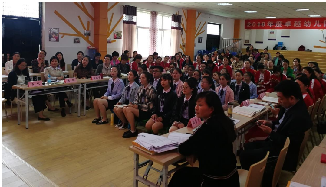
图 5 参加卓越幼儿园教师培养大讲堂活动