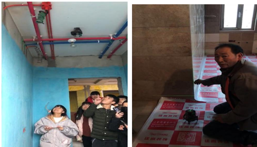
图 4 工地实践课程

2018年，阔达装饰工程有限公司为建筑室内设计专业的学生提供合适的工地和公司的能攻巧匠和技术能手，为实践教学提供了强力支撑。公司安排学校附近的工地和师傅，学校组织学生到施工现场进行实践教学，通过实践教学，进一步提高了学生动手能力，将理论知识与实践工作相结合，从而更好的掌握了专业技能。