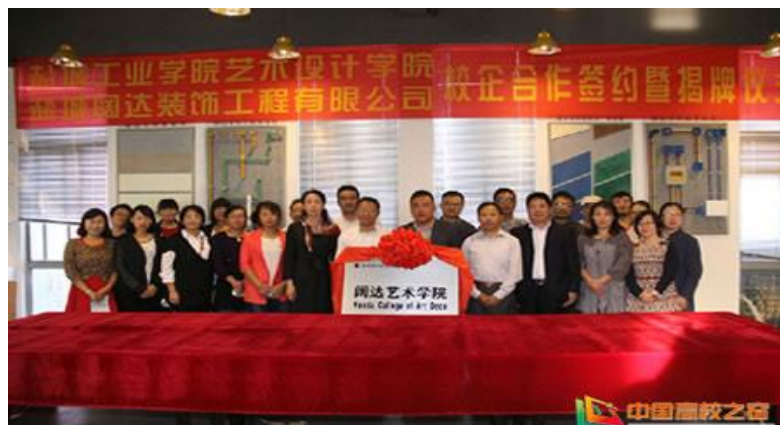
图 1 阔达学院成立授牌仪式

2016 年，新阔达，TA 是互联网+时代的成品化族群定制家居服务商。基于 19 年家装产品基因，结合“匠心产品+全民参与”的互联网+时代的精神，整合全产业链的资源提供成品化、平民价格的优质家居产品。