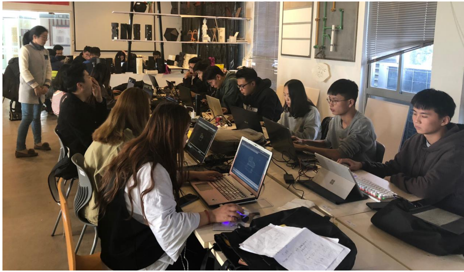
图 3 竞赛现场图片