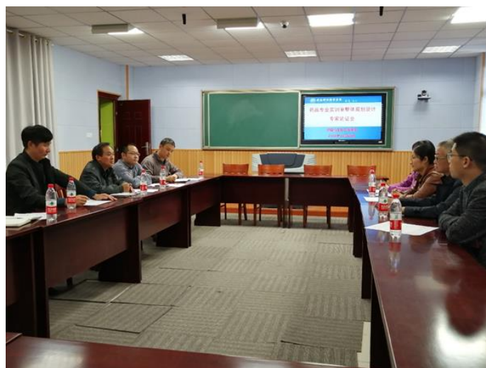
图2 企业专家参与实训室规划建设

培养模式的教做一体化材。使学生在校期间就能体验了解精华制药的企文化，同时将课堂知识与企业实际结合，掌握药品生产技能。企业专家参与南通科技职业学院校内实训基地建设，按照真实生产环境整体建设规划校内实训场所，使学生在校期间就能体验企业真实生产岗位。