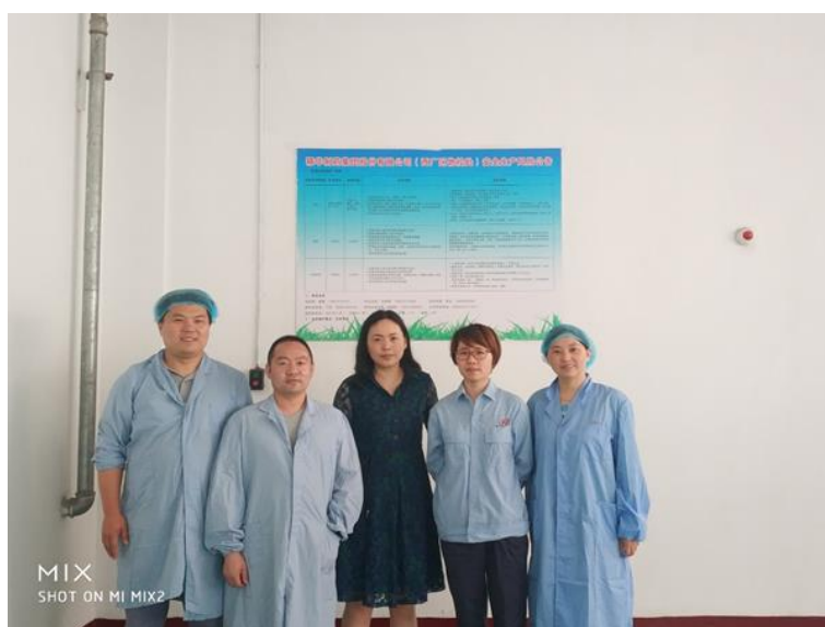
图3 学院教师赴企业车间看望毕业生