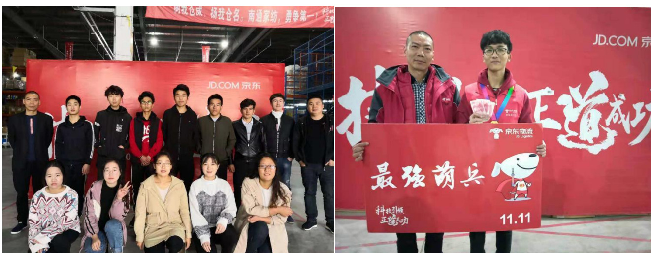
17 物流学生在京东南通公司实习