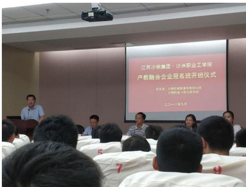
图4 沙钢冠名班开班仪式

沙钢集团有限公司本着“产教融合、校企共赢”的合作理念，在现代学徒制人才培养的基础上，先后组建了冶金机械专业订单班、冶金技术专业订单班和机电一体化技术专业沙钢冠名班等，从人才培养方案、课程设置、奖学金设立、教师互聘、实习实训等各个环节开展合作。