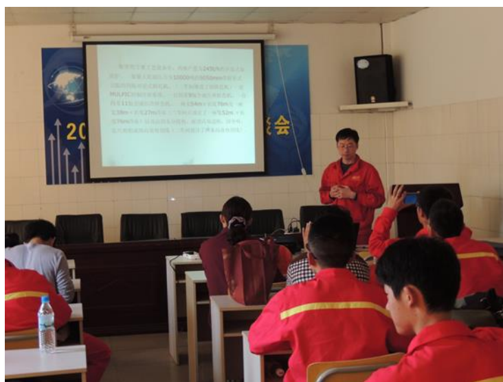
图7 沙工老师为沙钢一线技术人员学历教育授课

从2013年到目前为止，沙工共为沙钢一线技术人员开设了高起专成人学历教育共5届，分别开设机电一体化技术、冶金技术等专业，共为沙钢和控股公司永钢培养307名成人专科毕业生。