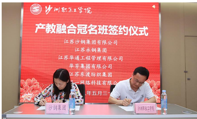
图3 2018年沙钢与沙工产教融合冠名班签字仪式

7、2018年5月，公司与沙工签订协议，以现代学徒制人才培养模式成立“产教融合沙钢冠名班”进行专项人才培养，其中机电一体化技术专业成为首批冠名班。