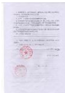
安全协议 实习协议正面 实习协议反面