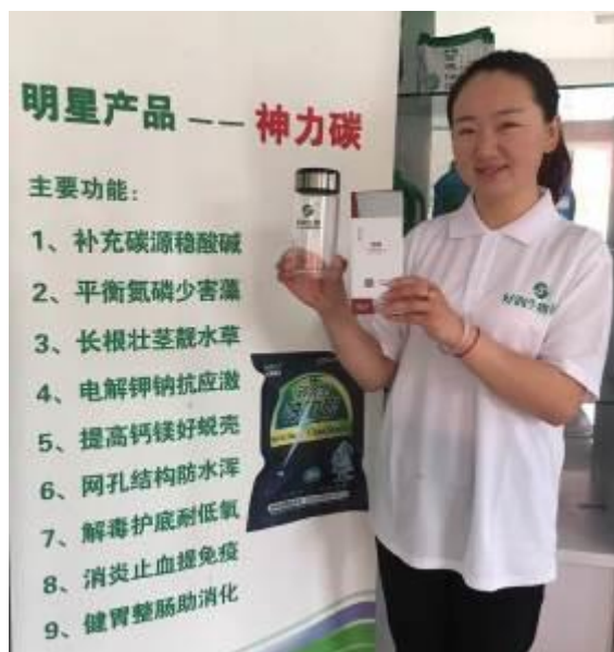
图6 对产品熟悉的培训（含奖惩环节）

2、指定专人当教练。从学会测水及了解当地品种生理特征着手，结合当前养殖阶段容易出现的问题、原因、解决方案等辅导。根据当地养殖模式，把握住推广卖点，明确行动方案和目標；