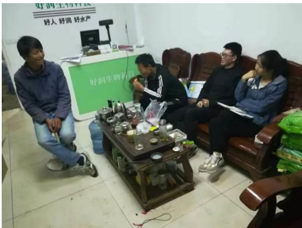
图4实习同学在店面同企业员工学习交流