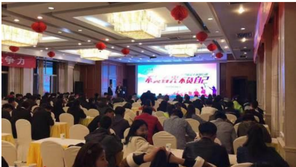
图3 为实习同学们打造的公司层面培训

由专业教师团队和企业专家共同成立专项课题组，多层次对同学们进行培训。提高学生专业知识和技能。