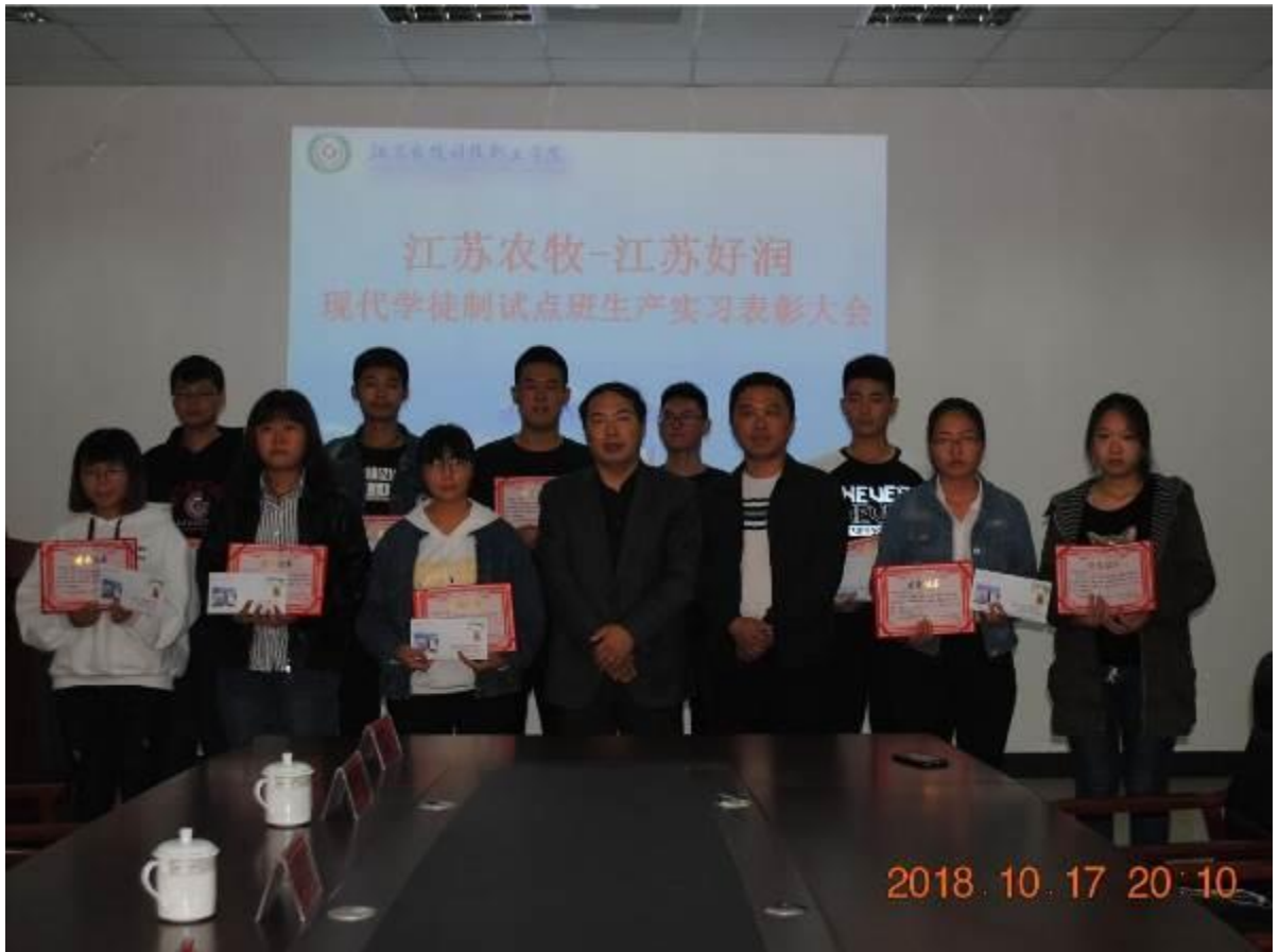
图8 好润现代学徒制试点班生产实习总结大会