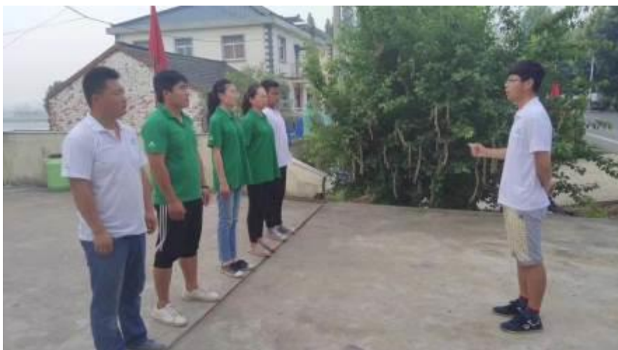
图5 团队凝聚力建设

2、指定专人当教练。从学会测水及了解当地品种生理特征着手，结合当前养殖阶段容易出现的问题、原因、解决方案等辅导。根据当地养殖模式，把握住推广卖点，明确行动方案和目標；