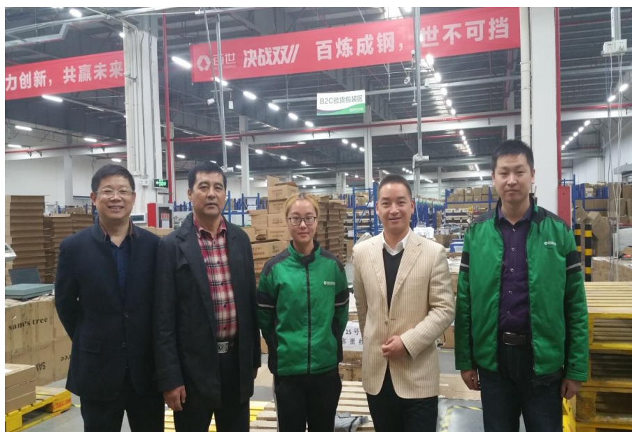
图 2 设在公司的教师工作站接受学校教师挂职锻炼

“百世物流”南京公司，利用企业的实践资源，2012 年与学校建立教师工作站至今，每年都接待物流管理专业带头人和骨干教师进站培养。通过进站挂职学习和访问工程师培养，学校物流管理专业带头人和骨干教师的业务水平获得普遍提升。