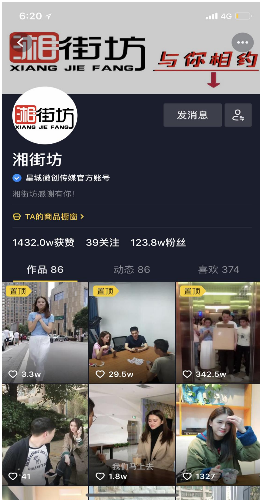
实习学生作品在网络上的点击量