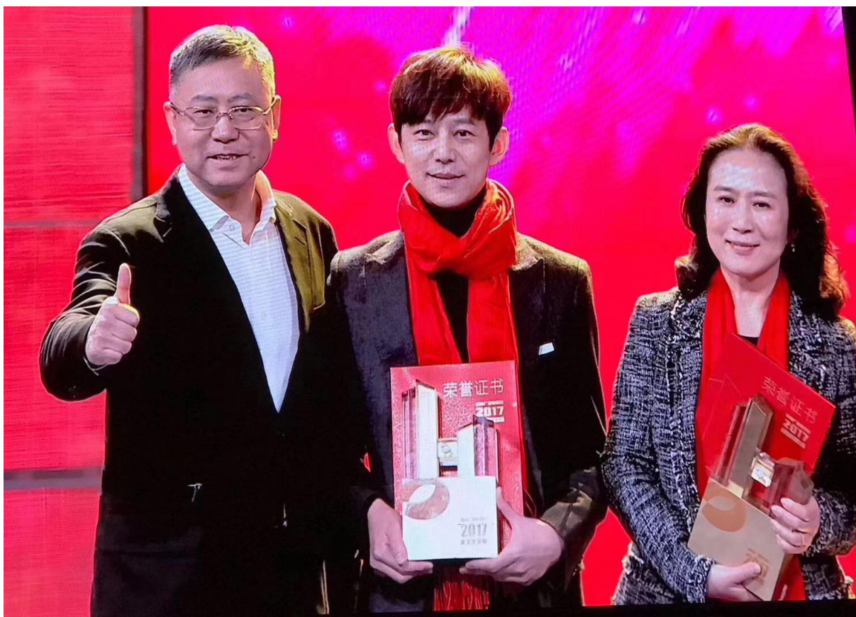
公司业务《话山论见》获奖

湖南人都有“吃得苦耐得烦霸得蛮”的特点，湖南大声集团也极力倡导这样的文化，公司希望打造一个良好的创作环境，给真正的内容创作者空间和平台，让大家在这里天马行空的想象，让公司成为内容创作的良田。