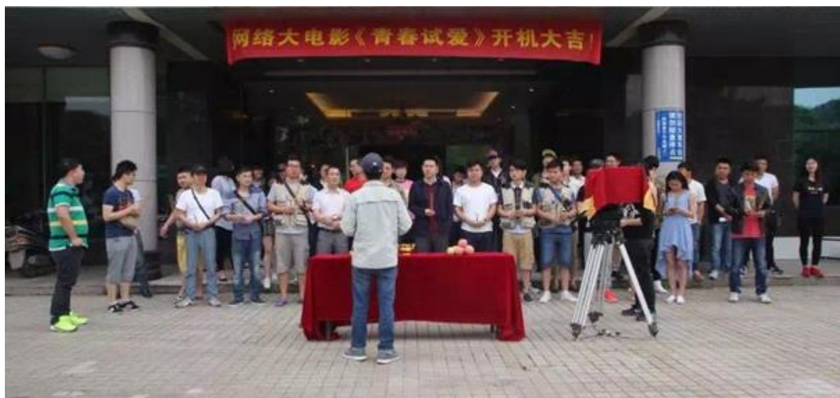
实习学生参与公司网络大电影《青春试爱》的拍摄制作工作