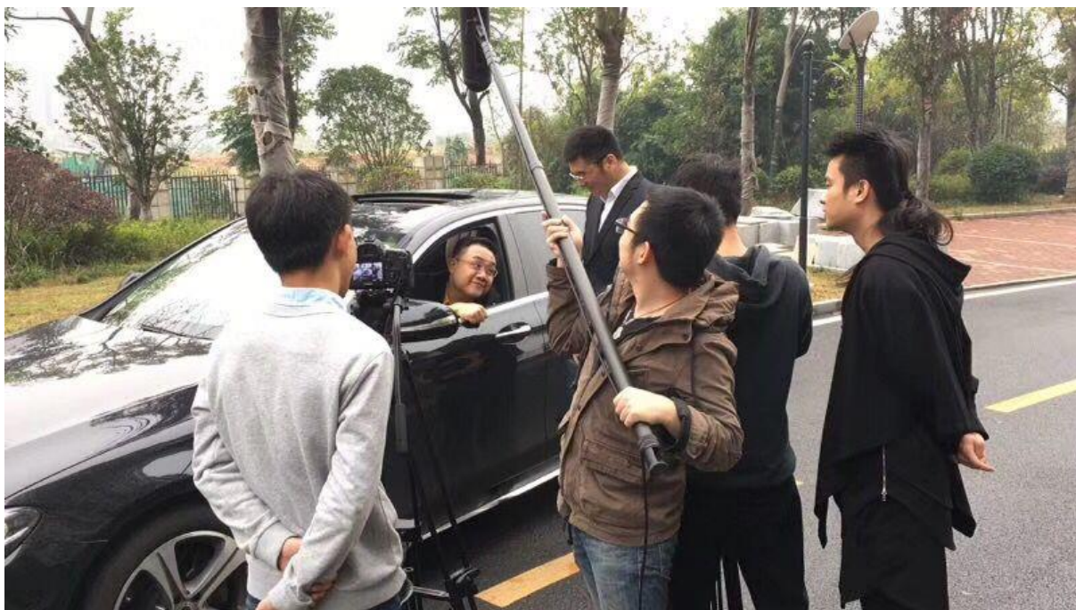
实习学生参与《大笑一声》短剧拍摄工作

我们企校之间的合作模式灵活多样，以项目为载体，实现资源共享、优势互补，共同发展，达到企业、学校和学生三赢。