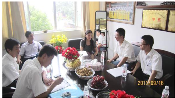
台达班机械学员学习情况