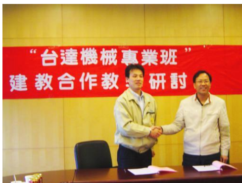
公司与学校签订校企合作意向

公司与湖南生物机电职业技术学院签订校企合作协议，成立了以企业与学院主要领导牵头的校企合作指导委员会。指导委员会是“台达机械班”的领导机构，主要负责顶层设计、办学模式、师资交流、实习就业等重大事项的决策。