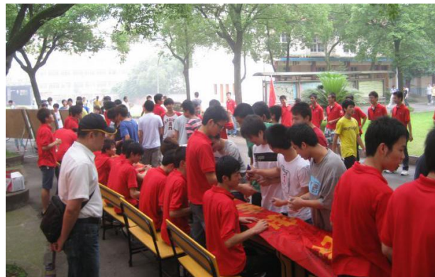
台达班学员公益活动宣传展板