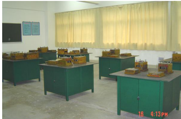
赠送给学校的制图桌、投影机 赠送的模具

也是一个基础实训室。公司与湖南生物机电职业技术学院合作建立了机加工实训室、模具设计实训室，赠送了制图版、锡炉、模具等教学设备；并派技术人员到校进行实训指导，把工作现场搬到了学院教学课堂。