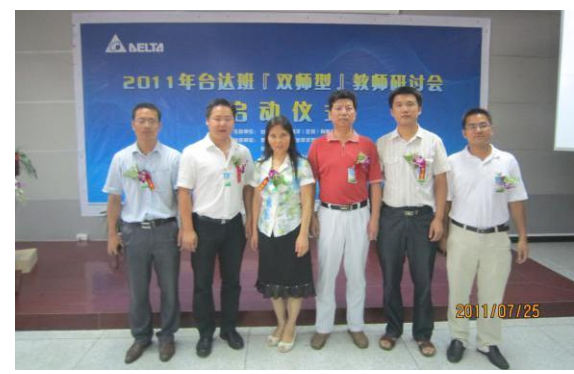
学院教师来公司参加“双师型研讨会”