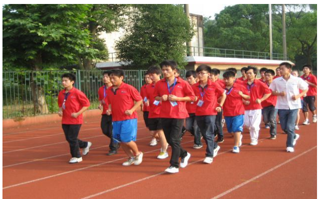
“台达机械班”开展形式多样业余活动