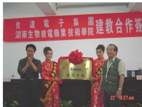
在学院举行中达公司授牌仪式