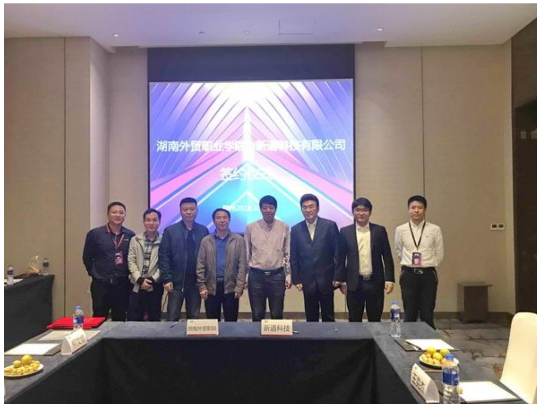
湖南外贸职业学院与新道科技战略合作签约仪式

(8) 实习和就业推荐：利用优势行业产业资源，建立学生实习和就业渠道，完善实习管理与指导，采用多种形式为合格毕业生提供就业岗位推荐。