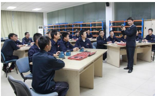
工程机械液压一体化实训室