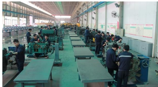
工程机械发动机实训基地