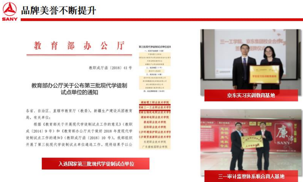
图 6 教育部第三批现代学徒制单位

1. 校企合作开展现代学徒制试点，2018 年学校成为教育部第三批现代学徒制试点单位（图 6）。