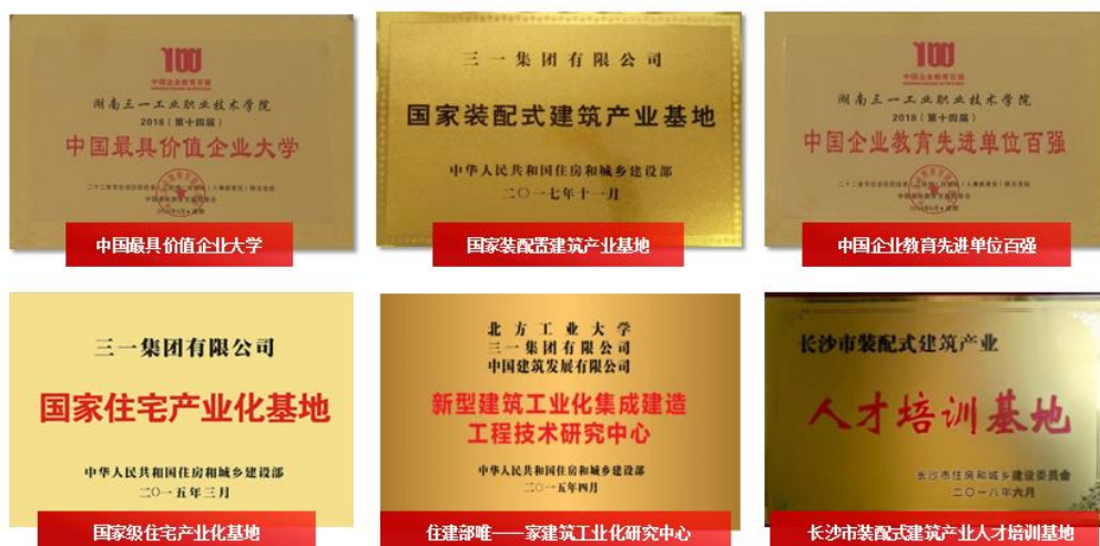
图 7 学校部分荣誉奖牌

4. 校企共建专业群，工程机械智能制造专业群立项为湖南省高职教育一流特色专业群、长沙市高等职业教育特色专业群。