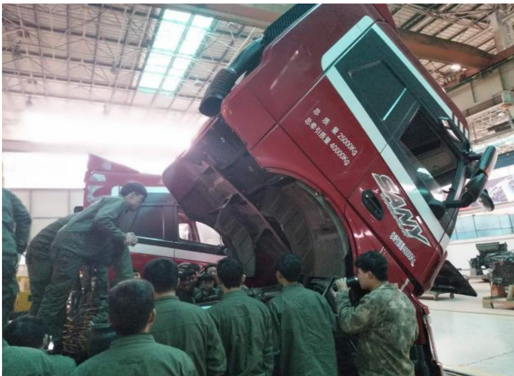
图 3 学生在进行新型重卡项目实训

（5）泵送、重机事业部免费赠送整车、发动机零部件及工量具，价值超过 100 万元。