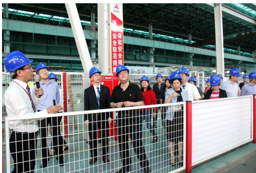
图 8 国家发改委调研团参观校内实训工厂

5. 国家发改委社会司、基础司、教育部发展规划司、联合国儿基会、各省/市发改委等 28 家单位 50 多人到学校实地调研(图 8)。三一集团和学校产教融合的经验得到推广。