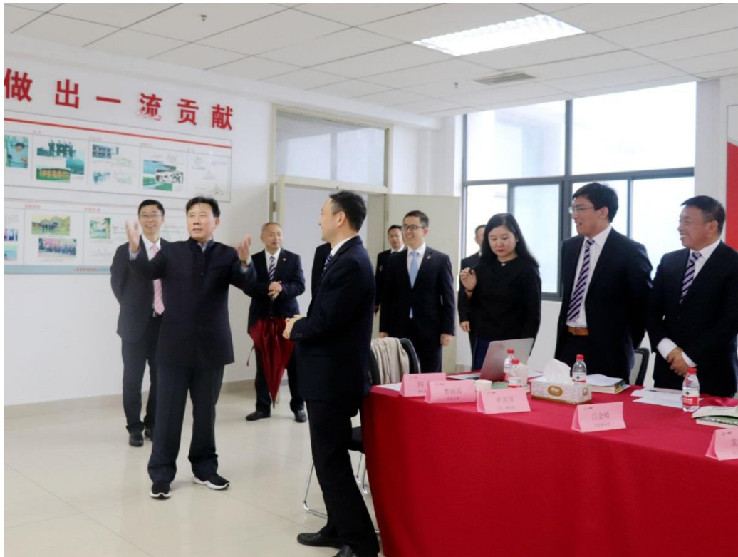
图1 三一集团董事长梁稳根先生指导学校工作

学院上市后，三一集团领导在全国公开招聘院长，并选聘了全国知名教育专家张辉教授博士（2018 年被评选为长沙市首批次高层次人才）担任学院院长及法人代表，全权负责学院的治理运行。按照学院和公司章程条例，变更法人代表，组建由学院举办者、公司领导、院长、教师代表组成的新一届董事会。2018 年企业支持学院基础设施及改造，新增一栋学生宿舍，基础设施及改造项目 20 大项，累计投资 4428.99 万元，具体见表 1。