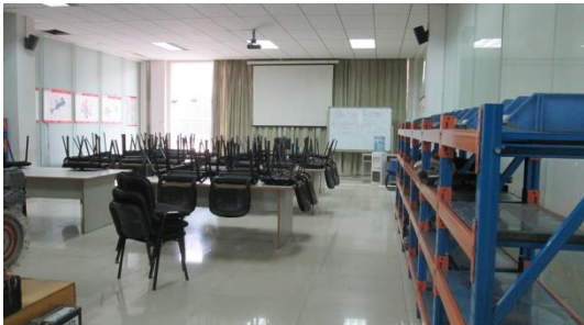
工程机械发动机一体化实训室