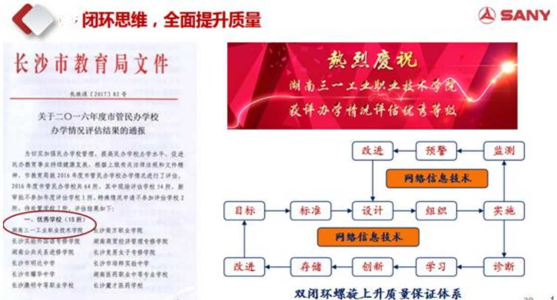
图 7 长沙市民办院校办学评估 2018 年优秀等级

2. 学校在 2018 年长沙市民办学校办学情况评估中获得优秀等级，排名第一（图 7）。