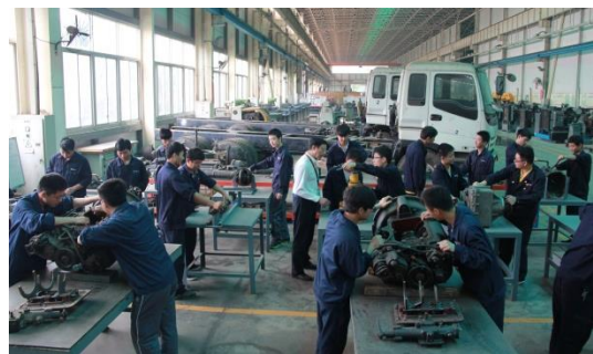
工程机械底盘实训基地