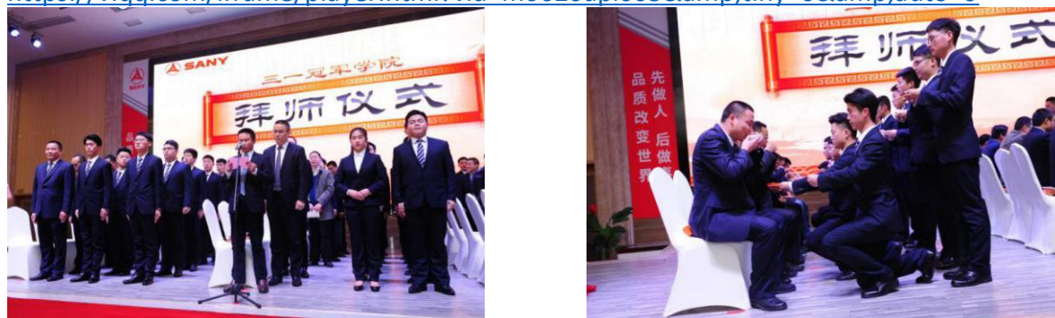
图2 学院学徒制订单班拜师仪式

https://v.qq.com/iframe/player.html?vid=m0620apl665&tiny=0&auto=0