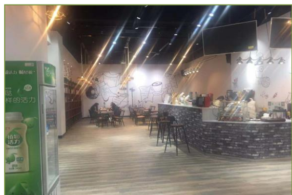
图一 OTO 新零售创新创业孵化基地