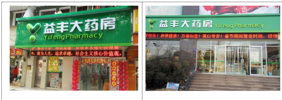
图 1-1 湖北武汉六顺路