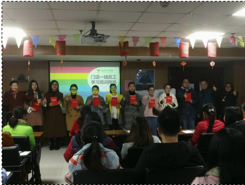
图 3-1 2018 年益丰大药房奖学金发放现场

立了益丰励志奖学金。主要针对品学兼优的学生进行奖励。2018年投入奖学金的各项经费合计10000元。