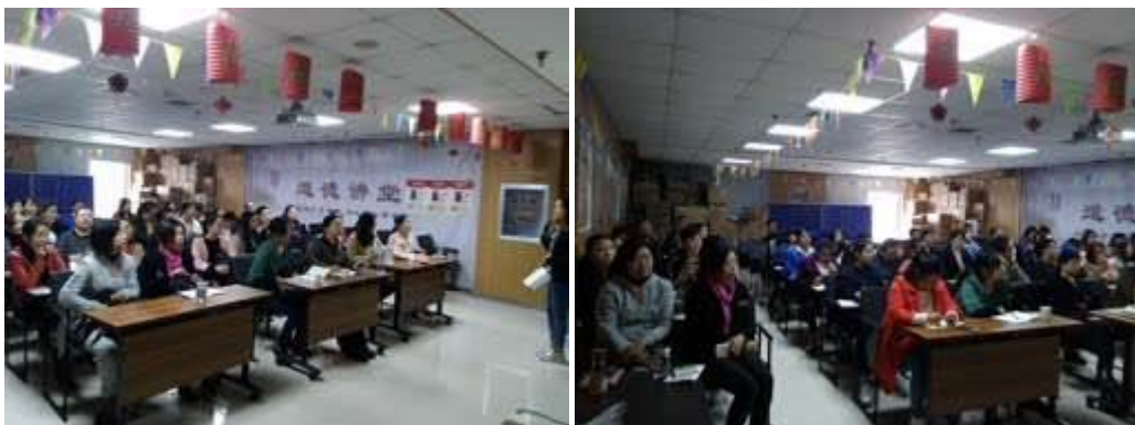
图 5-1 2018 年员工培训

以企业发展为战略导向，建立高技能人才培训机制，积极与合作学校搭建继续再教学平台，鼓励员工学历提升，益丰大药房连锁股份有限公司注重员工专业素质的培养，积极鼓励员工专业技能和学历水平不断的提升。同时学院积极开展对企业技术咨询服务，为企业提供医药市场理论指导、市场营销策划等技术服务工作，助推企业发展。