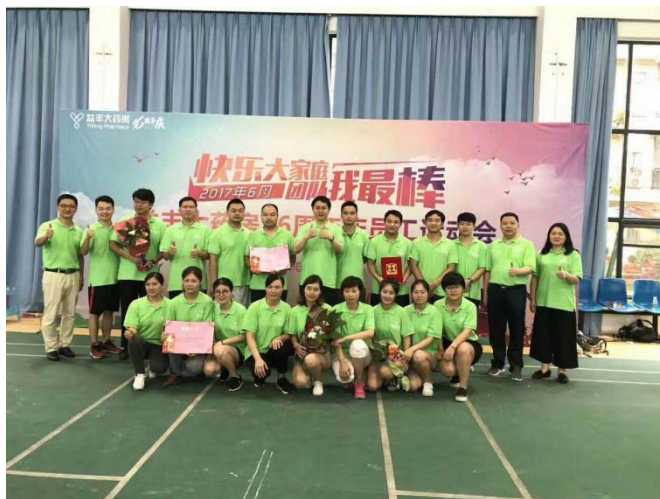
图 5-2 益丰大药房员工运动会