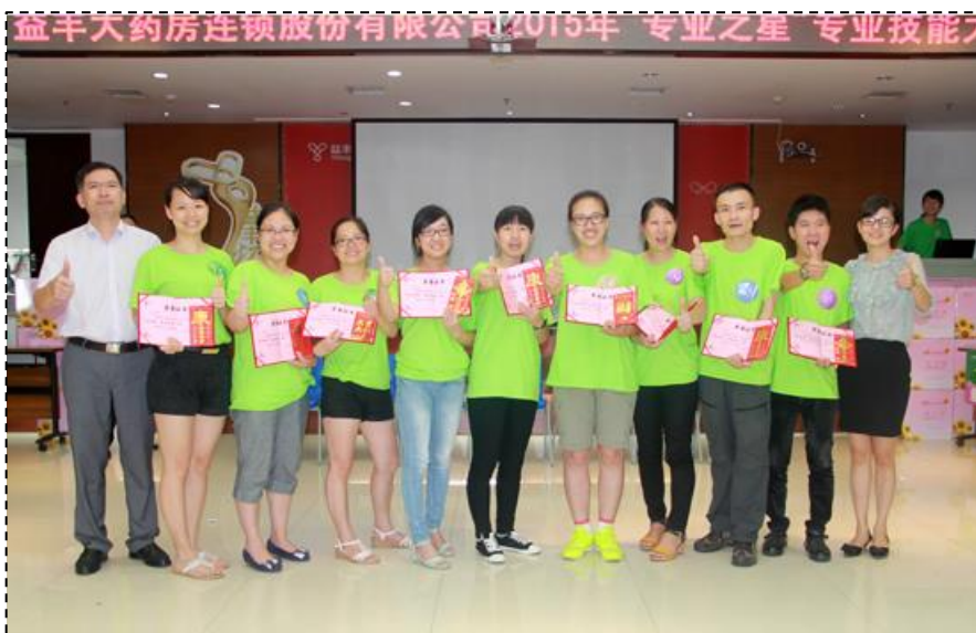
图 4-1 “专业之星”专业技能大赛

入企业“一月一交流”活动，定期开展班级茶话会与同学共同分享实习感受、交流经验、化解顾虑与矛盾。针对学生们提出的问题及困难无论是工作中还是生活上的都给予解决与关注。企业将优秀的见习生和实习生以及转正员工纳入此项计划并进行专项培养，为培养管理层人员提供良好的、坚实的团队基础。