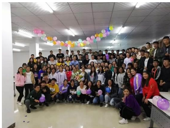
图6 教师节辅导员和同学们在一起