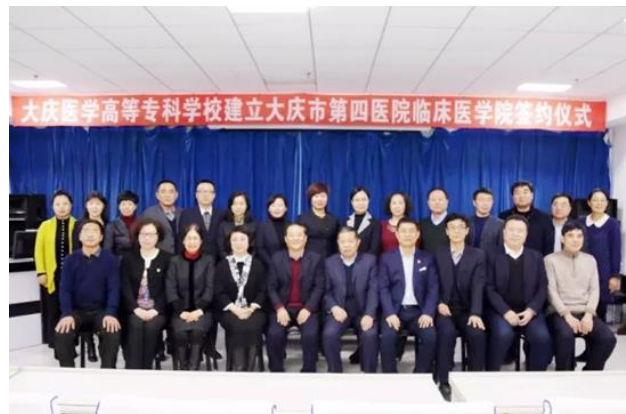
图 2 临床医学院签约揭牌仪式