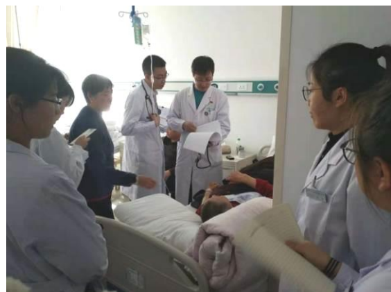
图 4 教学查房