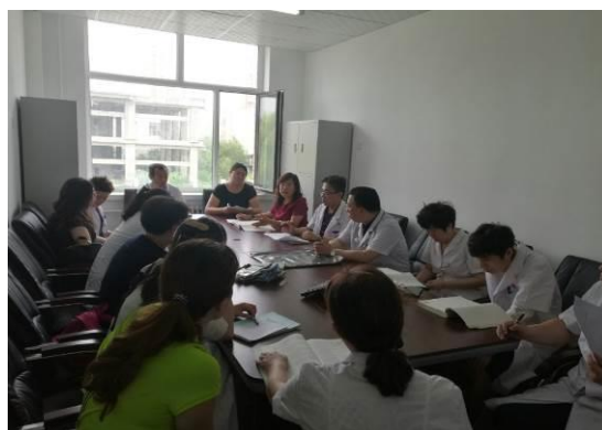
图 11 院校共同研讨修订教学大纲