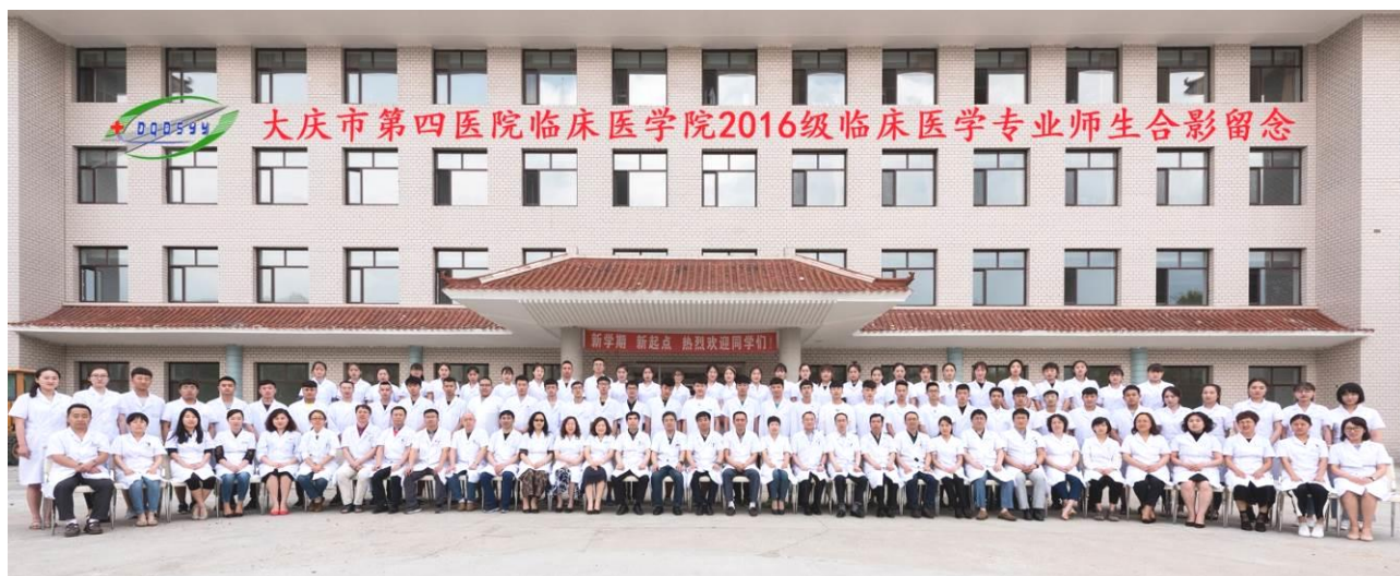
图7 临床医学院教师与第一批学生合影