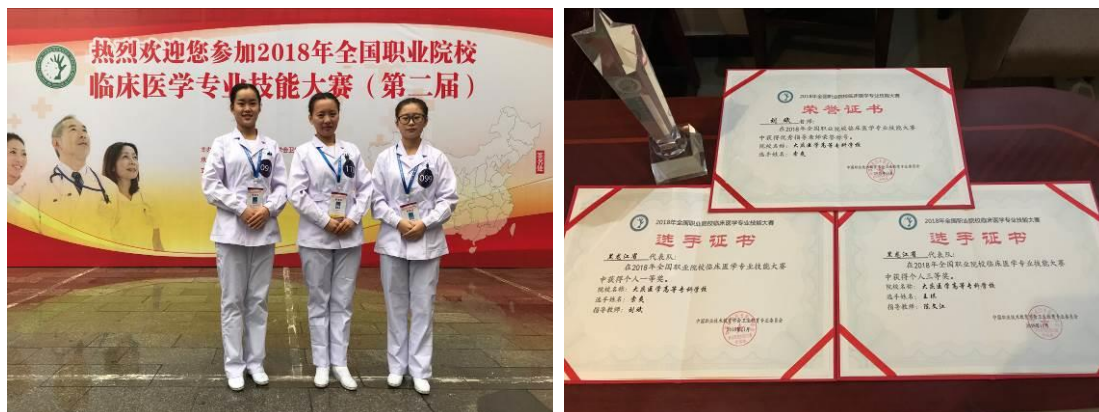
图 24 指导学生参加全国职业院校技能大赛分获一等奖和三等奖

国职业院校临床医学专业技能大赛中以优异的成绩分别斩获了一等奖、三等奖，为学校赢得了荣誉。