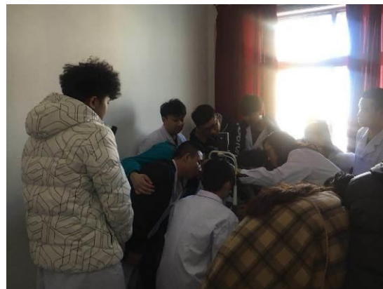
图18 学生进行眼科临床见习