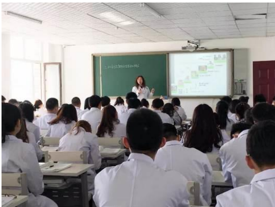
图 12 在医院教室进行理论教学