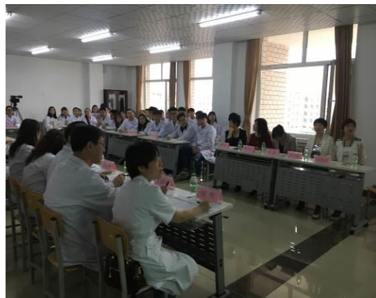
图 16 医院兼职教师指导学生病分析比赛