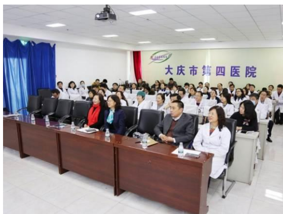
图 3 第一次院校级试讲总结