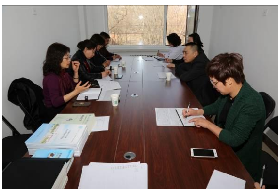
图 10 院校共同研讨人才培养方案

3. 共同开发教学资源、共建教材。医院与学校共建课程，共编制教学大纲等教学文件。医院兼职教师与学校共同编制修改《临床医学专业关键技能指导手册》，并通过学校推荐 2 名教师参编人民卫生出版社十三五规划教材编写。