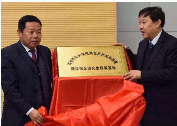
图 1 糖尿病足研究生培训基地揭牌

医院重视医学教学工作，以医促教，以教带医，医教并进。依托较强的医疗、教学、科研能力，几十年来一直承担着省内五所知名医学院校的临床带教工作，自 2016 年 10 月起，成为首都医科大学附属北京世纪坛医院的糖尿病足研究生培训基地，如今，第四医院又成为省内两所高等院校的临床教学医院，承担着两个校区临床医学系学生第三、第四学期的教学任务。