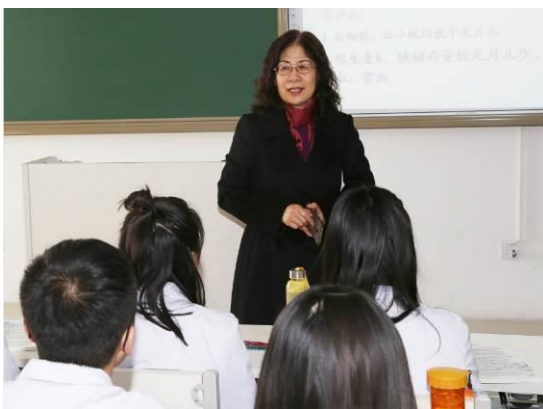
图 22 学校教学副校长看望学生

3 “五同”育人模式。医院与学校在临床医学专业共建、共管、共育人才，建立“五同”模式，即共同开展专业调研、共同实施人才培养方案、共同建设校内外实习基地、共同建设双师教学团队、共同监控评价教学质量，确保人才培养的质量。