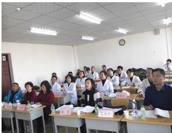
图19 进行第二次院校级试讲