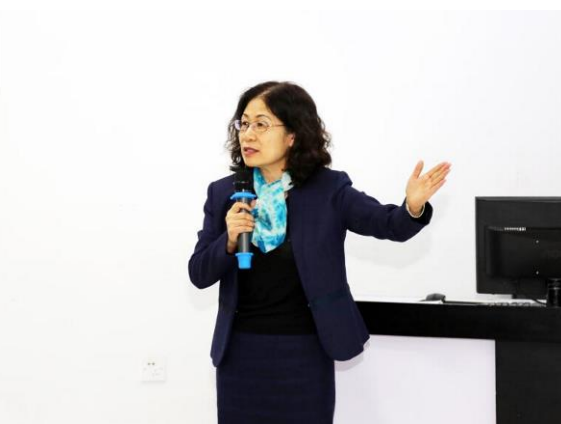
图20 教学副校长做师德培训讲座