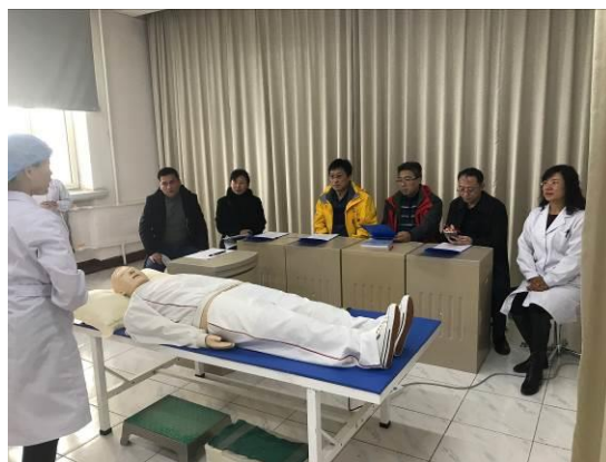
图 14 医院兼职教研室主任与学校教师共同指导学生参加全国临床技能大赛操作