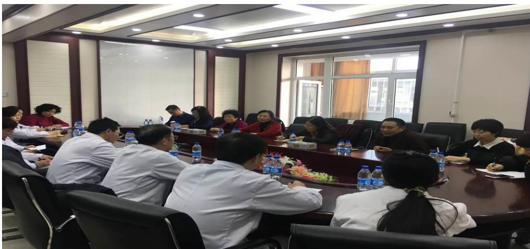
图8 院校教学情况调研座谈会