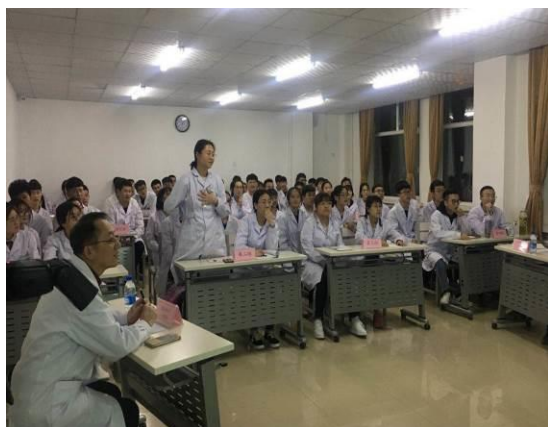
图 15 医院兼职教研室主任指导学生 外科学知识竞赛