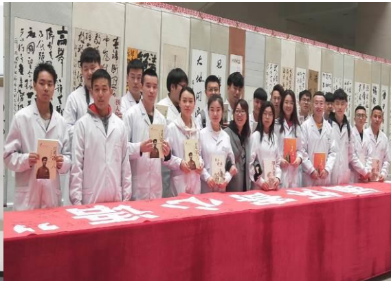
图 23 医院专职辅导员带领学生学习铁人精神