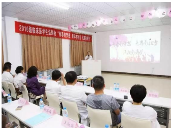
图5 第一批学生欢送会

习带教任务，校院合作可谓源远流长。2017年11月30日，双方隆重签约，大庆市第四医院正式成为大庆医学高等专科学校临床医学院，达成了紧密的合作关系。目前，医院全程参与学校人才培养，在医院内改建教室，配备各种教学设施，为学校提供兼职教师，承担专业理论课教学、实践课授课、临床见习、实习带教和管理工作任务等，与学校双主体育人。