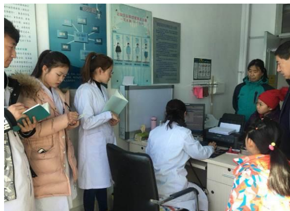
图17 学生休息日跟导师出门诊

学校专业带头人、教研室主任采取“双聘任”制度，聘任具有行业影响力的专家作为专业带头人、教研室主任，共同引领和指导专业和课程建设。聘任经验丰富的临床医生作为兼职教师，承担专业教学和学生导师，指导学生专业认知、临床见习及顶岗实习。