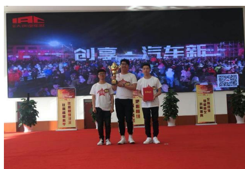
4.4 二手车评估行业赛