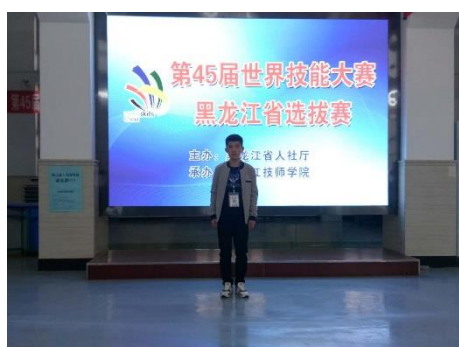
4.3 45 届世界技能大赛