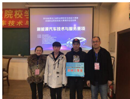
4.2 新能源汽车技术与服务赛项