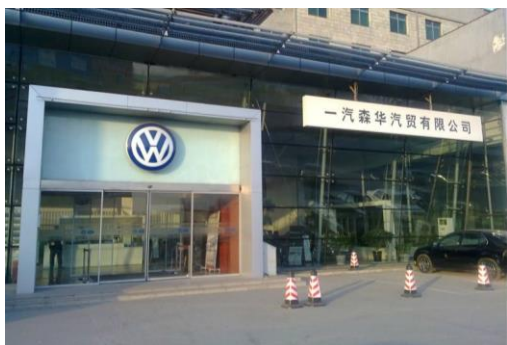
2.1 一汽森华汽车贸易有限公司

管理体系，成立了以森华集团部门领导为首的实习工作小组，小组成员共同建设校外实训课程，明确生产实践教师的职责与考核办法，建立校企合作保障条件与措施。