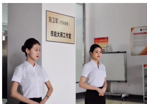
2.7 技能大师工作室成功揭牌