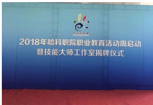
2.5 成立技能大师工作室