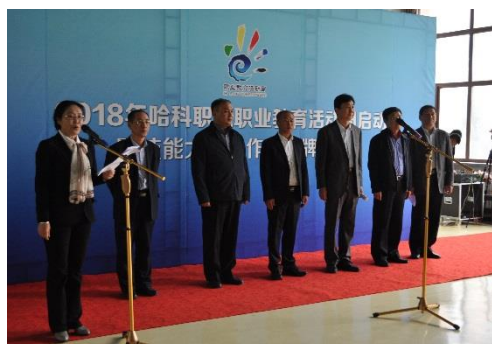
2.6 技能大师工作室启动仪式