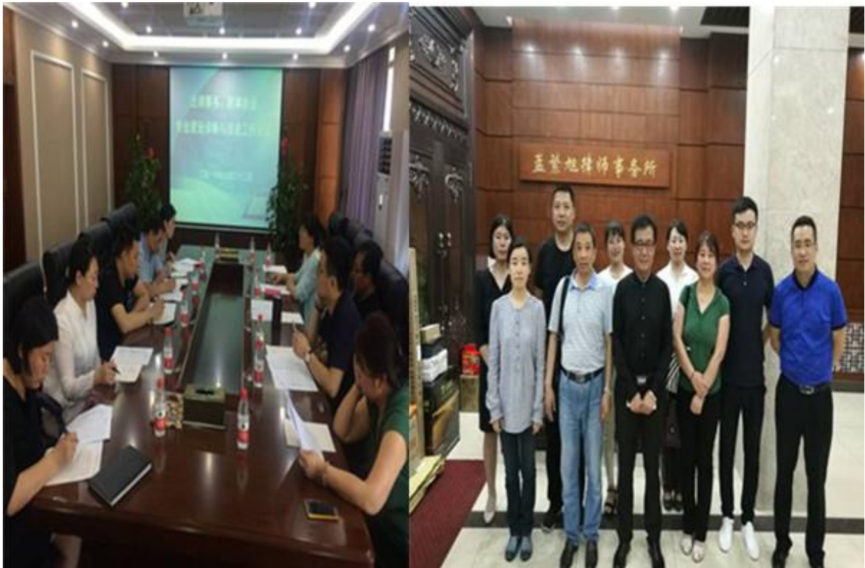
（图片 1：孟凡旭律师事务所参加专业建设诊断与改进工作）