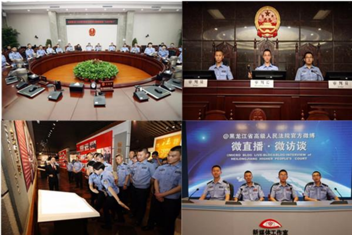
（图片 3：法警务专业学生赴黑龙江省高级人民法院开展校外实践教学活 动）