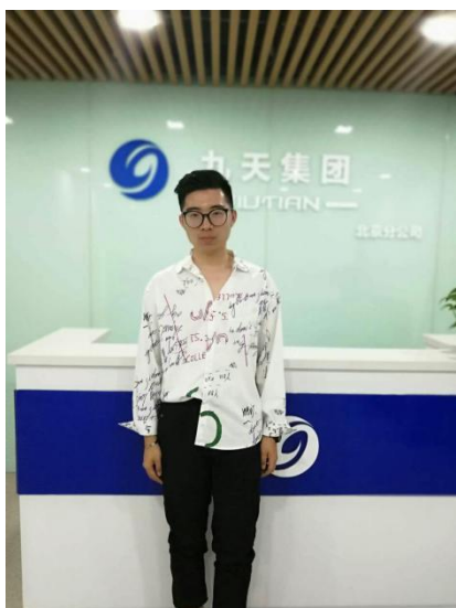
侯金辰 北京九天同发工程 6000+包食宿