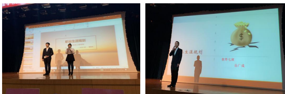
学生进行职业规划展示

2018年11月，为切实贯彻落实《教育规划纲要》“加强就业创业教育和就业指导服务”的总体部署和要求，普及大学生职业生涯规划知识，引导广大学生树立正确的成才观、就业观，科学合理地规划大学学习与生活，提高就业技能与实践能力。哈尔滨职业技术学院电子与信息工程学院与甲骨文华育兴业联合举办第十五届甲骨文杯职业规划大赛，甲骨文华育兴业为大赛选手提供全程职业规划培训与技术指导。此次大赛，学生展示了个人对于当前就业形势，本专业的行业优势的理解，为自身树立明确发展目标的同时也为所有到场学生提供了有价值的参考目标。