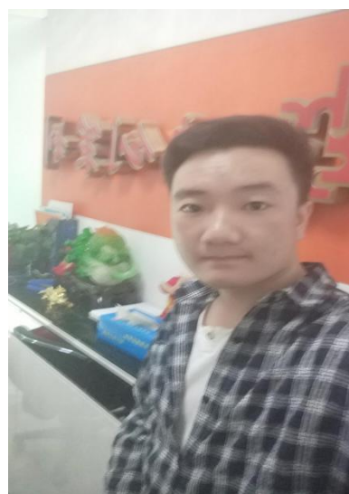
刘帅 北京鸿创励志 8000 五险，包住宿