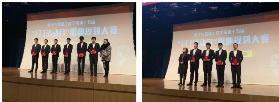
校企领导为获奖学生颁奖